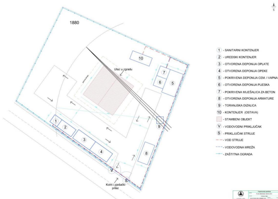
Sl. 1. Shema organizacije gradilišta

Da bi se objekt realizirao kvalitetno, u predviđenom vremenskom roku i ekonomično, važni su organizacija i uređenje samog gradilišta. Shema organizacije gradilišta podrazumijeva higijensko- tehničke zaštitne mjere na gradilištu odnosno brigu o životu i zdravlju radnika, što je regulirano posebnim propisima. Ona je tlocrtni prikaz svih sadržaja na gradilištu u određenom mjerilu. Shemom se utvrđuju gdje se nalaze prilazni putovi, deponij za materijal, položaj mehanizacije i strojeva, položaj radionica, razvod pogonske energije i vode na gradilištu i smještaj kancelarija i drugih objekata za potrebe radnika. Nakon izrade sheme pristupa se uređenju samog gradilišta što znači da se gradilište čisti od svih nepotrebnih stvari koje bi mogle smetati pri građenju novog objekta, gradilište se mora ograditi, podižu se privremeni objekti za potrebe radnika i radi se potrebno osiguranje gradnje. [3]