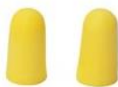
Sl. 10. Neformirani čepić za zaštitu sluha

Neformirani čepići se proizvode od plastičnog materijala i radnik ga formira sam prema svom ušnom kanalu.