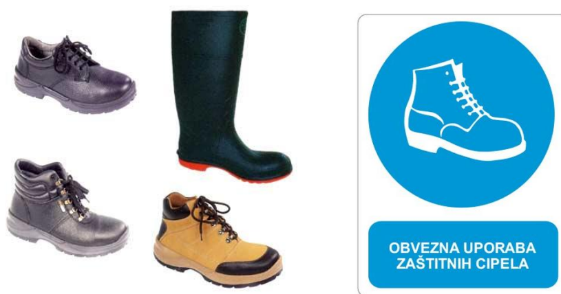
Sl. 7. Osobno zaštitno sredstvo za zaštitu nogu i pripadajući znak obaveze

Zaštitna obuća mora zadovoljavati 3 kriterija a to su opremljenost obuće, nosivost i održavanje. Kod opremljenosti obuće ocjenjuje se prostor za nogu, dubina profila đona, zaštita gležnja, utore i drugo. Nosivost je najvažniji kriterij pri ispitivanju a ispituju se zaštitna kapica za prste, nosivost na visokim i niskim temperaturama, ponašanja pete, prijanjanje đona uz tlo kao i položaj stopala u obući. Kod održavanja ispituje se lakoća čišćenja kao i uklanjanje prljavštine s površine obuće. Zaštitna sredstva za zaštitu nogu ne smiju za vrijeme rada izazivati žuljanje ili znojenje nogu i one moraju zadovoljavati tehničke uvjete koji su propisani standardima. U građevini se najčešće koriste cipele sa čeličnom kapicom zato jer je čelik otporan na udarce i pritiske. [9]