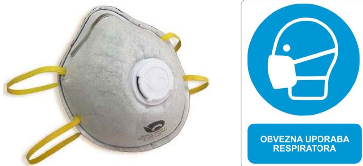
Sl. 12. Zaštitna maska sa filtrom i znak obaveze