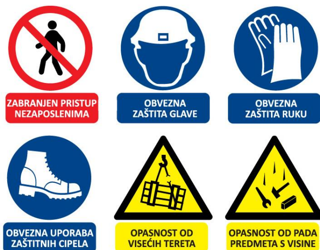
Sl. 3. Primjer ploče sa sigurnosnim znakovima

Najčešće znakovi zabrane su zabranjen pristup nezaposlenima a obaveze su obavezna zaštita glave, ruku i nogu, neke od opasnosti na gradilištu su opasnost od visećih tereta i opasnost od pada predmeta s visine. Ove znakovi se mogu razlikovati od gradilišta do gradilišta.