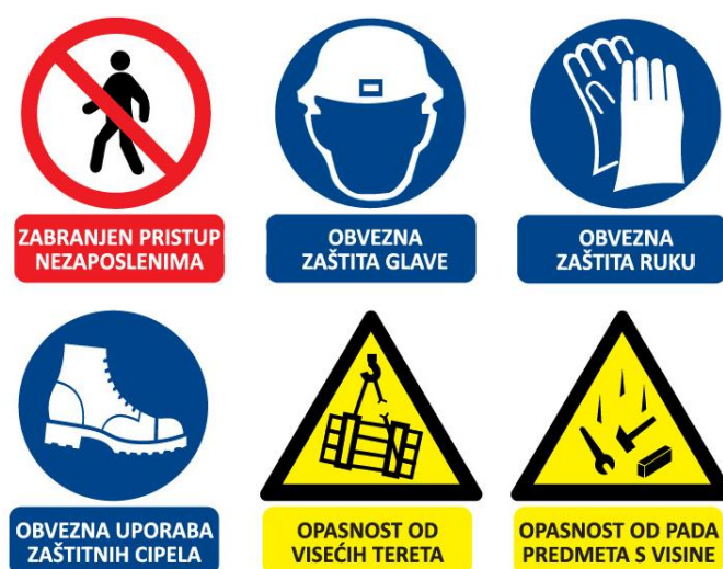
Sl. 3. Primjer ploče sa sigurnosnim znakovima

Najčešće znakovi zabrane su zabranjen pristup nezaposlenima a obaveze su obavezna zaštita glave, ruku i nogu, neke od opasnosti na gradilištu su opasnost od visećih tereta i opasnost od pada predmeta s visine. Ove znakovi se mogu razlikovati od gradilišta do gradilišta.