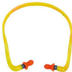
Sl. 9. Formirani čepić za zaštitu sluha

Zaštitni čepovi se upotrebljavaju u svim granama gospodarstva gdje se tehničkim sredstvima ne može postići intenzitet buke do 75 dB. Dijelimo ih na formirane koje sami ne možemo formirati, koji su izrađeni od čvrstog materijala, glatke površine s nastavkom za prihvat prstima kod vađenja i stavljanja u uho i neformirani koje sami formiramo prilikom stavljanja u uho i oni su jednokratni. Formirani čepići se mogu upotrebljavati više puta, oni su najprimjereniji za radnike koji rade u okruženju s bukom s prekidima. [9]