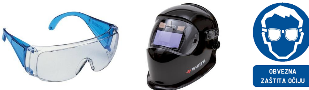
Sl. 8. Osobno zaštitno sredstvo za zaštitu očiju i pripadajući znak obaveze

Za zaštitu očiju postoje i štitnici za oči i lice. Postoje 3 vrste štitnika: štitnik za zaštitu od krupnijih letećih čestica, štitnici za zaštitu od tekućih i nagrizajućih materijala i štitnici za zavarivače. Radnik koji obavlja poslove zavarivanja na gradilištu mora nositi zaštitni štitnik za zavarivanje koji štiti oči, glavu i vrat od djelovanja ultraljubičastog zračenja i čestica koje se stvaraju prilikom zavarivanja materijala. Unutarnja strana takvog štitnika je tamna i bez sjaja dok je vanjska obložena sjajnom metalnom folijom, materijal od kojeg se rade takvi štitnici su slabi provodnici topline i struje i ne smiju biti lakozapaljivi. [9]