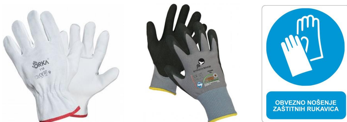
Sl. 6. Osobno zaštitno sredstvo za zaštitu ruku i pripadajući znak obaveze

Prije proizvodnje rukavica se u laboratorijima provode istraživanja korištenja kvalitetnih materijala koji će poboljšati i povećati sigurnost i zdravlje radnika koji rade takve poslove gdje u opasnosti mogu doći ruke. Svaka rukavica mora biti pravilno označena, mora sadržavati na vidljivom mjestu: godinu proizvodnje, kodni broj, broj proizvodne serije, logo proizvođača i veličinu proizvoda. Da bi zaštitne rukavice štatile ruke od štetnih djelovanja moraju biti otporne na velike temperaturne promjene, vremenu i dužini izloženosti štetnostima, dužini i vrsti, kao i koncentraciji štetne kemijske tvari. Na gradilištu se upotrebljavaju: gumene rukavice za električare, zaštitne rukavice od kože, zaštitne rukavice za zavarivače, antivibracijske rukavice. [9]