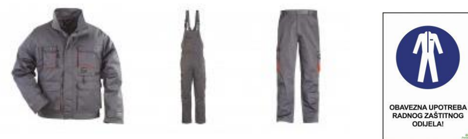
Sl. 14. Osobno zaštitno sredstvo za zaštitu tijela i pripadajući znak obaveze

U sredstva za zaštitu tijela spadaju i opasači za zaštitu sa visina u zaštitne skele. Opasači za zaštitu sa visina se koriste za dodatno osiguranje od pada sa visina prilikom izvođenja radnih zadataka, u građevini se primjenjuju pri radu na stupovima, montažama i popravcima na visinama. Važno je da opasači moraju imati dva užeta kao garanciju da će radnici koji obavljaju poslove na visini biti sigurni. Zaštitne skele se rade od metala i upotrebljavaju se za one radove na visini kod kojih ne možemo upotrebljavati opasače kao što je ugradnja potrebne opreme i tehnike. [9]