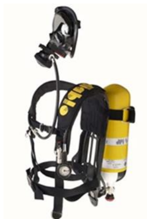
Sl. 13. Izolacijski aparati za zaštitu dišnih organa