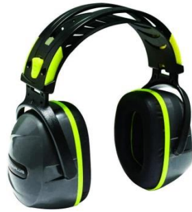
Sl. 11. Ušni štitnici za zaštitu sluha