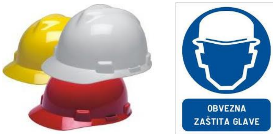
Sl. 5. Osobno zaštitno sredstvo za zaštitu glave i pripadajući znak obaveze

Zaštitna kaciga se sastoji od štitnika, otvora za prozračivanje, kolijevke, oboda i školjke. Kaciga mora dobro prijanjati uz glavu, bez obzira na kretanje radnika. Radi higijene se mora jednom godišnje promijeniti cijela kolijevka. Na obodu mora biti sustav za mogućnost podešavanja kacige s obzirom na veličinu glave. Horizontalna šupljina, prostor između gornjeg dijela kacige i tjemena, mora biti dovoljno prozračan a ta prozračnost se postiže otvorima na školjci. Školjka je izrađena od materijala koji se naziva polimer, on se upotrebljavaju zato jer ima relativno nisku cijenu proizvodnje i dobro oblikovanje, dobru toplinsku i električnu izolaciju, otpornost na propuštanje vode, otpornost prema kiselinama i lužinama, otpornost prema koroziji, dobro upija vibracije i ima niski faktor trenja. Svaka kaciga mora biti atestirana i treba se slagati sa zahtjevima standarda s obzirom na: apsorpciju udaraca, otpornost probijanja, otpornost na zapaljivost, elektroizolacijske karakteristike i bočne tvrdoće. [9]