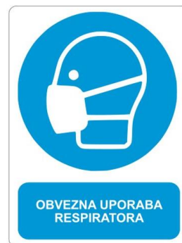
Sl. 12. Zaštitna maska sa filtrom i znak obaveze