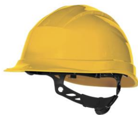
Slika 4. Zaštitna kaciga

1. Sredstva za zaštitu glave, na primjer zaštitni šljem ( kaciga) koja mora štiti glavu od padajućih predmeta. Zaštitni šljem mora imati ugrađenu kolijevku koja ima mogućnost podešavanja po veličini s razmakom od šljema između 2 i 4 cm.[4]