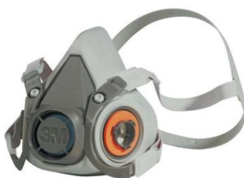
Slika 7. Zaštitna polumaska

4. Sredstva za zaštitu dišnih organa služe kako bi se zaštilili dišni organi od štetnih čestica, prašina i plinova koji se vrlo lako mogu udahnuti i na taj način doprijeti do pluća i uzrokovati oštećenja tkiva. U ova sredstva spadaju respirator, cijevna maska s kisikom i zaštitna plinska maska. [7]