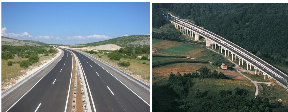
Slika 2. Objekti niskogradnje

Geotehnika obuhvaća gotovo sve građevinske aktivnosti i ključna je u izvođenju skoro svih građevinskih objekata koji se temelje na tlu. Geotehnika kao građevinska disciplina oslanja se na mehaniku tla i mehaniku stijena.