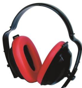
Slika 6. Zaštitne slušalice

3. Sredstva za zaštitu sluha u koje spadaju vata, čepići i zaštitne slušalice (antifoni) se daju na korištenje osobama izloženim za vrijeme rada povećanoj buci koja se drugim mjerama ne može spriječiti. [6]