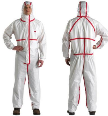
Slika 10. Zaštitni kombinezon

7. Sredstva za zaštitu tijela u koja spadaju zaštitna kuta, kombinezoni i slično služe kao zaštita od prašine i prljanja. [10]