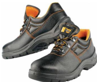
Slika 9. Zaštitne cipele

6. Sredstva za zaštitu nogu štite noge od padajućih predmeta (cipele sa čeličnom kapicom), zaštitu od štetnog toplinskog djelovanja (npr. cipele sa drvenim đonom) [9]