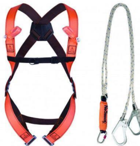
Slika 11. Zaštitno sredstvo za rad na visini

8. Sredstva za zaštitu od pada s visine koriste radnici kojima nije moguće na niti jedan drugi način osigurati radno mjesto. U ovu zaštitnu opremu spadaju zaštitna užad i opasači. [11]