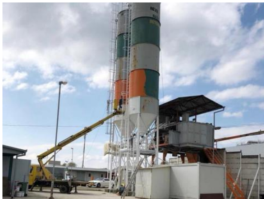
Slika 3. Proizvodnja građevinskog materijala

Građevni elementi za ugradnju u građevinu obuhvaćaju sanitarije, instalacije, građevnu stolariju i bravariju (prozori i vrata), podne obloge i dr. Polugotove građevne konstrukcije (obične i prenapregnute armiranobetonske konstrukcije, drvene lijepljene i čelične tipske konstrukcije), sklopovi (npr. kupaonice) i objekti (npr. montažne kuće) izrađuju se u zasebnim tvornicama.