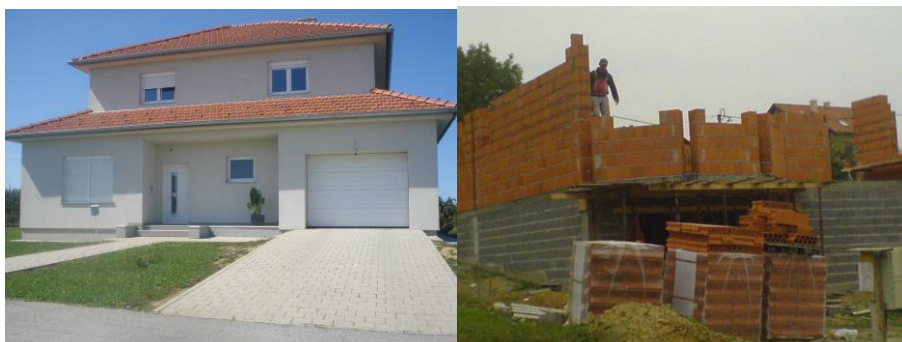
Slika 1. Objekti visokogradnje