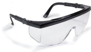
Slika 5. Zaštitne naočale

2. Sredstva za zaštitu očiju i lica, poput zaštitnih naočala ili štitnika za varioce, služe za zaštitu od ulijetanja čestica i strugotina u oči. [5]