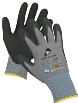
Slika 8. Zaštitne rukavice

5. Sredstva za zaštitu ruku štite ruke od hladnoće i topline, električne energije, mehaničkih opasnosti, štetnog djelovanja kiselina i slično. Rade se od gume (za rukovanje kiselinama, za rad s uređajima pod naponom) ili od kože (kod varenja).[8]