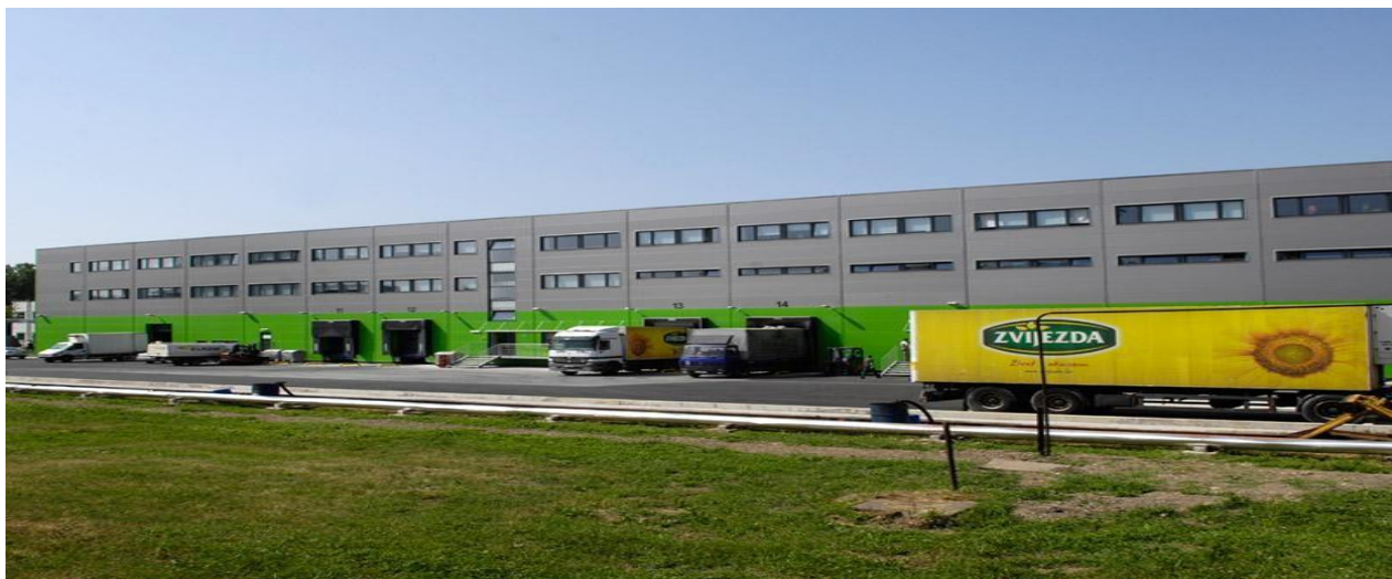
Slika 1. Upravna zgrada "Zvijezda Plus d.o.o" [18]

Sami kompleks prehrambene industrije čine: parking za osobna vozila, orijentiran prema sjeveru koji se dijeli sa „Fortenova grupom“, koja je ujedno i vlasnik „Zvijezde Plus d.o.o.“, upravna zgrada „Fortenova grupe“ odmah uz parking. Sa južne strane nalazi se vaga za kamione, gdje se mjeri masa kamiona sa robom koja se uvozi/izvozi. Cijeli kompleks ograđen je metalnom ogradom visine 180 centimetara. Na ulazu na parking i u krug industrije nalaze se prijemne porte s rampama koje sprječavaju neovlašteni ulaz osobama i vozilima. [12]