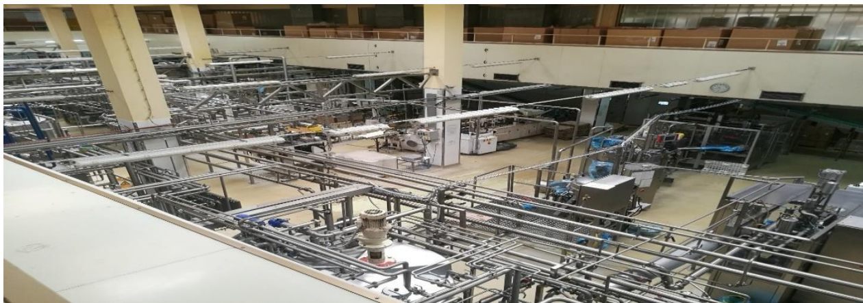
Slika 4. Pogon margarina i delikatesa [21]