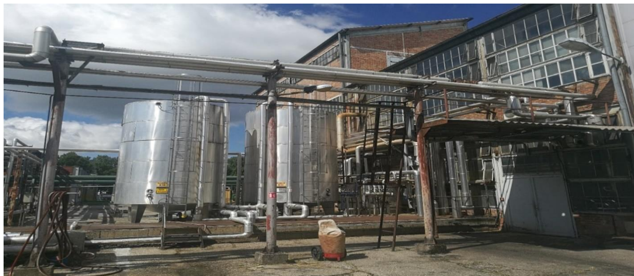
Slika 3. Pogon hidrirnice [20]

Odlukom direktora društva od 28. lipnja 2010. godine u pogonu hidrirnice je trajno obustavljen proces hidrogenacije ulja zbog značajno smanjenih potreba za hidrogeniranim biljnim mastima i dotrajalosti opreme za hidrogenaciju. Sukladno toj odluci dana 26.01. i 27.01.2011. godine obavljeno je uklanjanje kompresorskog postrojenja za vodik čime je onemogućen daljnji rad na opremi za hidrogenaciju. Sukladno odluci od 15.11.2016. obustavljen je rad i dijela pogona za deodorizaciju, a to obuhvaća i plinsku kotlovnicu pogona hidrirnice. S obzirom na gore navedeno u objektu pogona hidrirnice u upotrebi je ostala samo oprema za prijem sirovina iz auto cisterni (sa pripadajućim cjevovodima, ventilima i rezervoarima za prijem sirovina). Uz pomoć iste opreme moguće je putem cjevovoda sirovine isporučiti u pogon margarina. Pogon je zadržao naziv iz doba kada se obavljala hidrogenacija suncokretovog ulja koje u takvom stanju predstavlja sirovinu u daljnjoj proizvodnji margarina. Objekt više nije u funkciji, već zajedno sa spremnicima uz objekt služi za prihvat određenih vrsta ulja te ne predstavlja nikakav rizik za sigurnost radnika. [12]