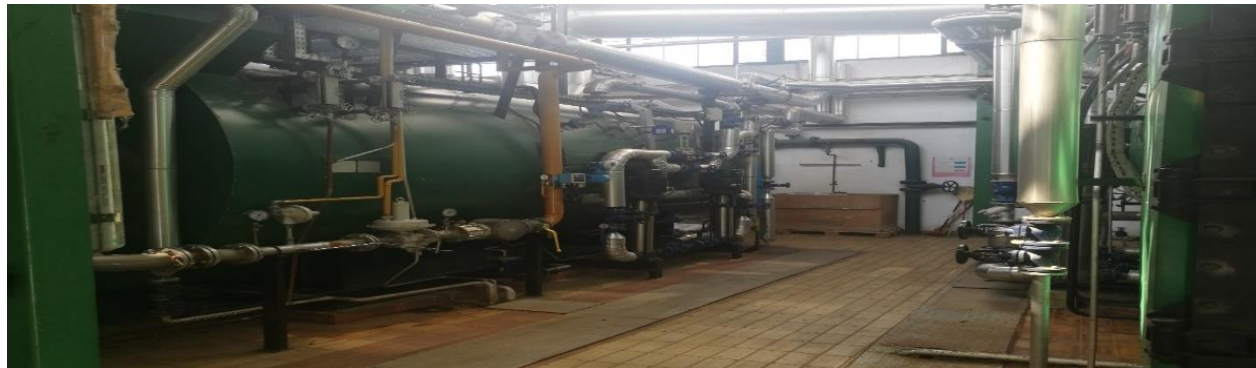
Slika 5. Kotlovnica [22]

U objektu kotlovnice potencijalnu opasnost predstavlja zemni plin koji služi kao pogonsko gorivo i u ovom slučaju opasnost postaje stvarna tek u slučaju incidenta. U kotlovnici su instalirana dva kotla za proizvodnju pare i predstavljaju opasnost posude pod tlakom. Kao i kod svih drugih posuda pod tlakom, redovito se kontroliraju sigurnosni ventili, manometri te se čiste i provjetravaju dimovodni kanali.