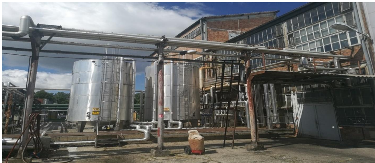
Slika 3. Pogon hidrirnice [20]

Odlukom direktora društva od 28. lipnja 2010. godine u pogonu hidrirnice je trajno obustavljen proces hidrogenacije ulja zbog značajno smanjenih potreba za hidrogeniranim biljnim mastima i dotrajalosti opreme za hidrogenaciju. Sukladno toj odluci dana 26.01. i 27.01.2011. godine obavljeno je uklanjanje kompresorskog postrojenja za vodik čime je onemogućen daljnji rad na opremi za hidrogenaciju. Sukladno odluci od 15.11.2016. obustavljen je rad i dijela pogona za deodorizaciju, a to obuhvaća i plinsku kotlovnicu pogona hidrirnice. S obzirom na gore navedeno u objektu pogona hidrirnice u upotrebi je ostala samo oprema za prijem sirovina iz auto cisterni (sa pripadajućim cjevovodima, ventilima i rezervoarima za prijem sirovina). Uz pomoć iste opreme moguće je putem cjevovoda sirovine isporučiti u pogon margarina. Pogon je zadržao naziv iz doba kada se obavljala hidrogenacija suncokretovog ulja koje u takvom stanju predstavlja sirovinu u daljnjoj proizvodnji margarina. Objekt više nije u funkciji, već zajedno sa spremnicima uz objekt služi za prihvatanje određenih vrsta ulja te ne predstavlja nikakav rizik za sigurnost radnika. [12]