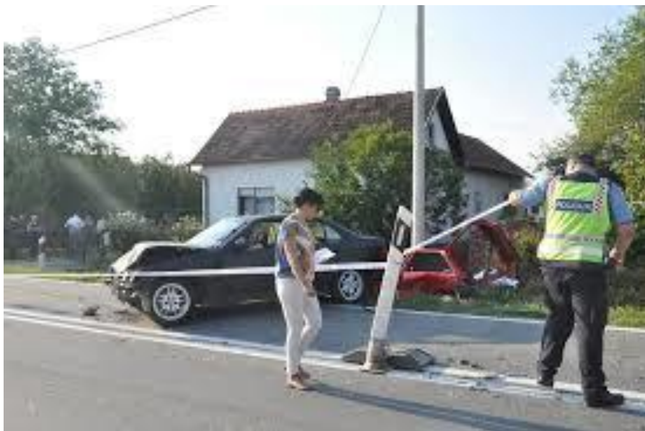
Slika 6. Proces osiguranja mjesta događaja [23]