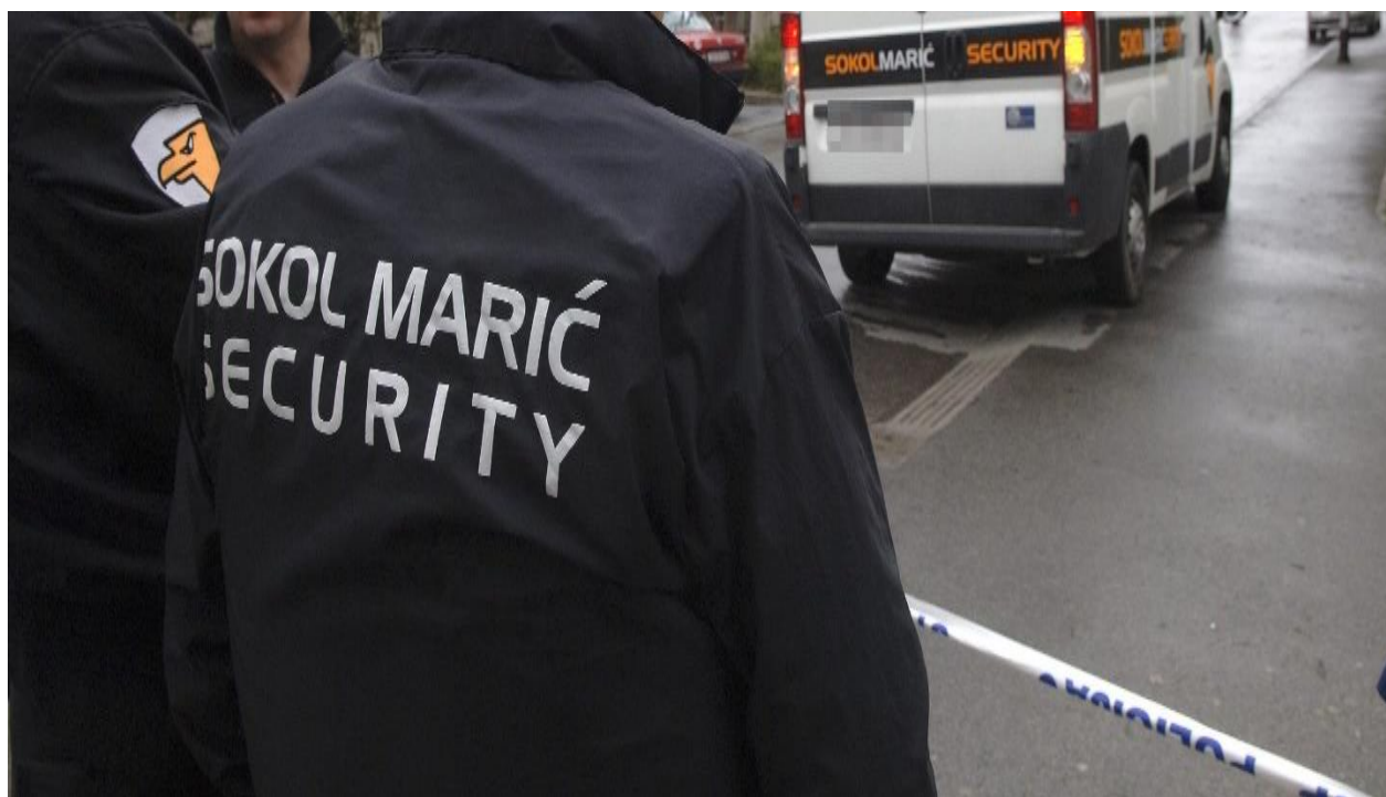
Slika 8. Zaštitari tvrtke "Sokol - Marić" [25]