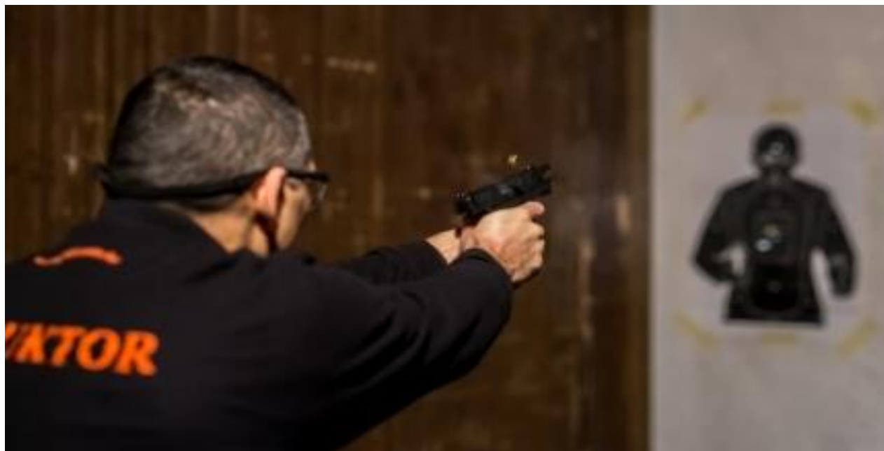
Slika 7. Uporaba vatrenog oružja [24]

Uporaba vatrenog oružja nije dopuštena protiv maloljetnika ili kada se dovodi u opasnost život trećih osoba, izuzev kada je uporaba vatrenog oružja jedino sredstvo za obranu od izravnog napada na život zaštitara ili štićene osobe. U tvrtki „Zvijezda plus d.o.o.“ nema osoba koje su u sustavu zaštite objekta i osoba koje su opremljene vatrenim oružjem.