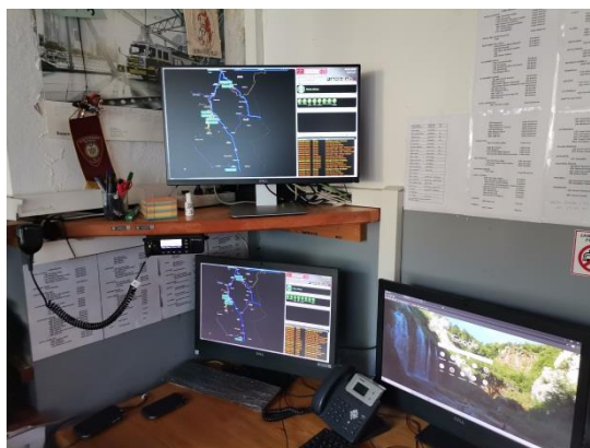
Slika 14 - sustav ABSsistem DC1 u dežurnoj sobi vatrogasne postrojbe

Izvršne funkcije i signal prorade svih sustava zaštite od požara, a vezano za stabilne sustave za dojavu i gašenje požara za sve objekte NP Plitvička Jezera, pa tako i Restorana „Labudovac“, prebačene su prostoriju dežurne sobe u vatrogasnoj postrojbi NP Plitvička Jezera.