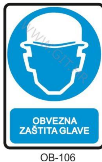
Slika 12. Obvezna zaštita glave [10].

Sredstva za zaštitu glave, na primjer zaštitni šljem mora štiti glavu od padajućih predmeta. Zaštitni šljem mora imati ugrađenu kolijevku koja ima mogućnost podešavanja po veličini s razmakom od šljema koji je između 2 i 4 centimetra, Slika 12. [10]