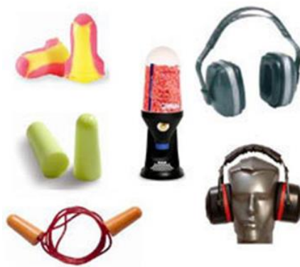
Slika 15. Sredstva za zaštitu sluha [10]

Kao sredstva za zaštitu od sluha u građevini možemo koristiti ušne čepiće, ušne školjke pričvršćene na kacigu, kacigu s potpunom akustičkom zaštitom, štitnike s prijammnikom za nisko frekvencijsku indukciju, zaštitno sredstvo za uši s opremom za međusobnu komunikaciju. U građevini se radi vrste posla najčešće koriste ušni čepići i ušne školjke pričvršćene na zaštitnu industrijsku kacigu. Sredstva za zaštitu sluha u koja spadaju vate, čepići i zaštitne slušalice koriste osobe koje su za vrijeme rada izložene povećanoj buci koja se drugim mjerama ne može spriječiti, Slika 15 [10].