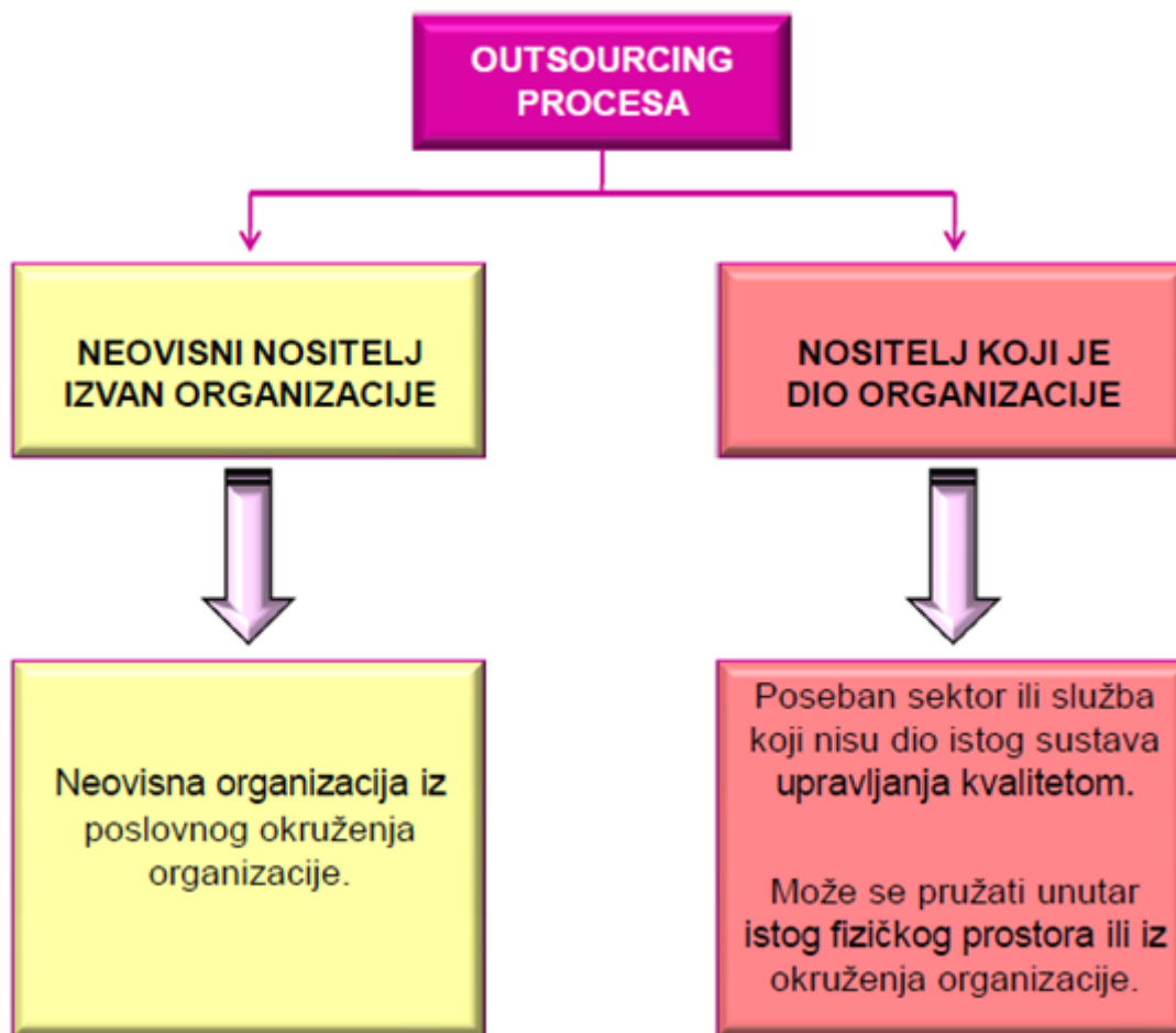
Slika 4. Nositelji procesa u outsourcingu