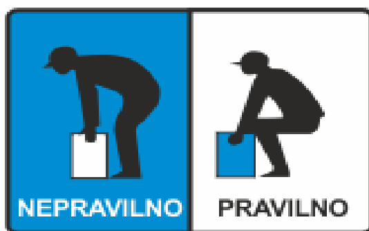
Slika 5: Pravilno podizanje tereta

smjera ne smijemo okretat gornji dio tijela nego smjer mijenjamo isključivo promjenom položaja tijela.