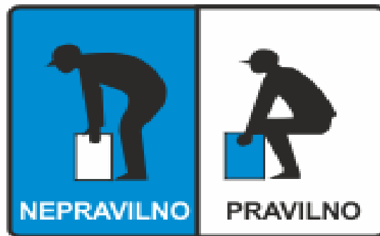
Slika 5: Pravilno podizanje tereta

smjera ne smijemo okretat gornji dio tijela nego smjer mijenjamo isključivo promjenom položaja tijela.