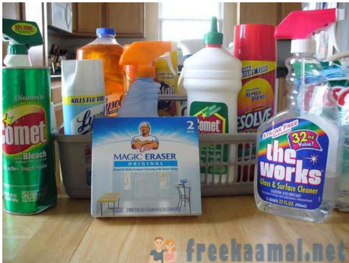
Slika 3. opasni otpad u kućanstvu

otpada. Nije opasan po zdravlje ljudi, i za okoliš jer ne ispušta nikakve štetne tvari (SOFILIĆ, BRNARDIĆ, 2015.).