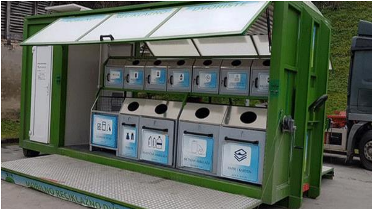
Slika 5. Mobilno reciklažno dvorište

Recovery: regeneracija materijala i energije je postupak kojim se kemijskom, fizikalnom i toplinskom pretvorbom materijala ponovno proizvodi materijal ili energija (BULJAN, 2020.).