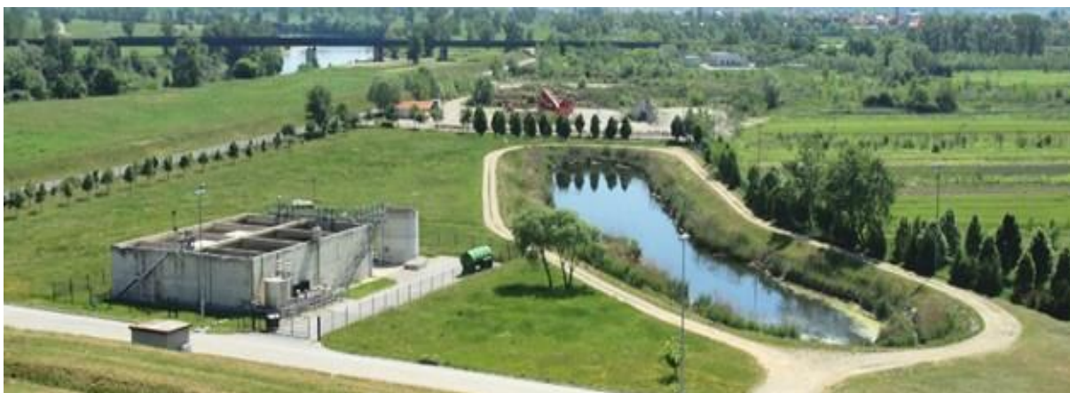
Slika 11. Uređaj za pročišćavanje procjednih voda