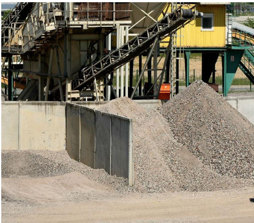
Slika 9. Građevinski otpad nakon obrade