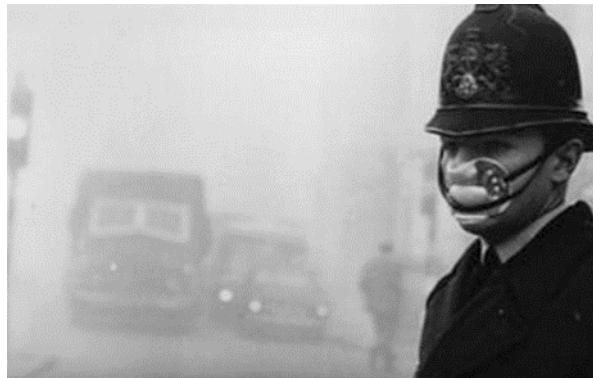
Slika 1: Smog u Londonu 1952. godine

Moderni ili fotokemijski smog nastaje zbog emisija prometa i industrije pod utjecajem sunčeve svjetlosti i uz prisustvo primarnih onečišćivača, a jedan od glavnih sastojaka fotokemijskog smoga je prizemni ozon. On je štetan za ljude i životinje, a čini štete i na poljoprivrednim kulturama. Povećane količine ozona javljaju se u gradovima i industrijskim područjima, a zrak onečišćen ozonom vjetrom se raznosi i na ruralna područja gdje na kraju budu najviše koncentracije ozona (PAVIŠA, P., 2020.).