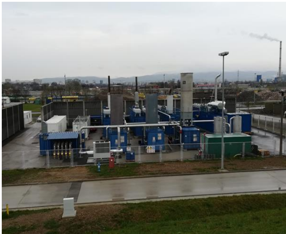
Slika 10. postrojenje za gospodarenje plinom

mTEO plinsko postrojenje je postrojenje u kojem se stvara električna energija, a od prosinca 2004. do lipnja 2020. godine u postrojenju je proizvedeno 148.473 MWh električne energije (ANONYMOUS c, 2020.).