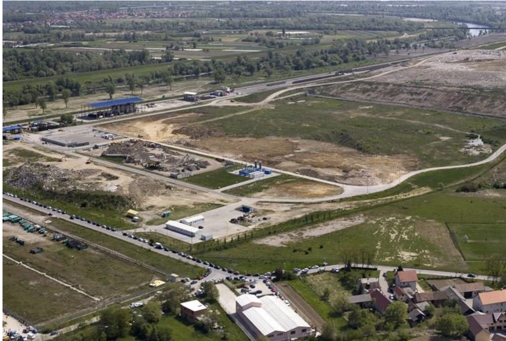
Slika 8. Odlagalište otpada Jakuševac – Prudinec