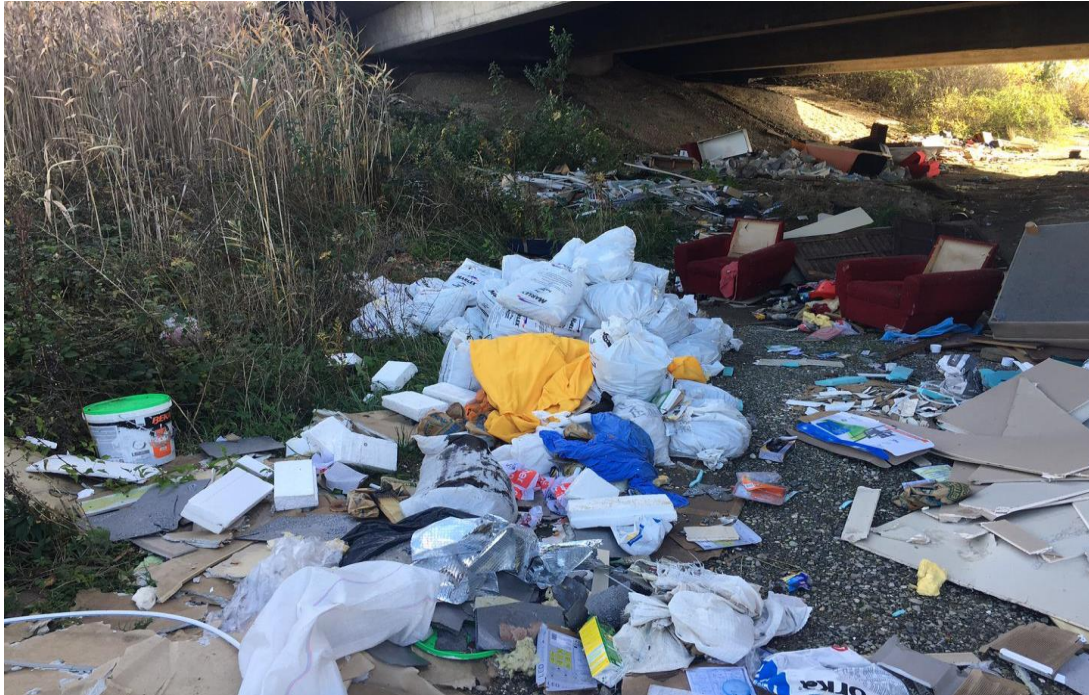
Slika 4. Divlje odlagalište otpada

smanjila količinu ambalažnog otpada Europska unija donijela je posebnu direktivu kojom su svi oni koji ambalažu stavljaju na tržište, dužni pobrinuti se za njezino zbrinjavanje. Proizvođači ambalaže moraju osigurati najmanje 50% iskorištavanja otpadne ambalaže, pri čemu trebaju izravno reciklirati najmanje 25% ukupne ambalaže, ovi uvjeti obavezni su za svaku članicu EU, kao i za zemlje koje će postati buduće članice (SPRINGER, 2001.).