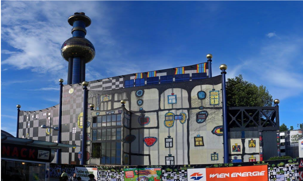
Slika 6. Spalionica otpada u Beču