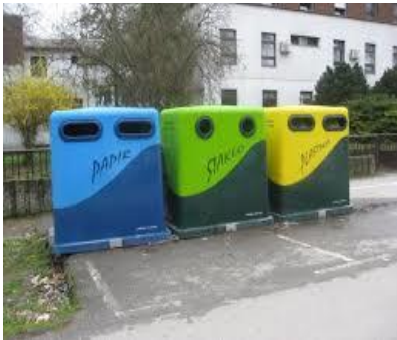
Slika 7. spremnici za odvojeno sakupljanje otpada u Općini Nuštar