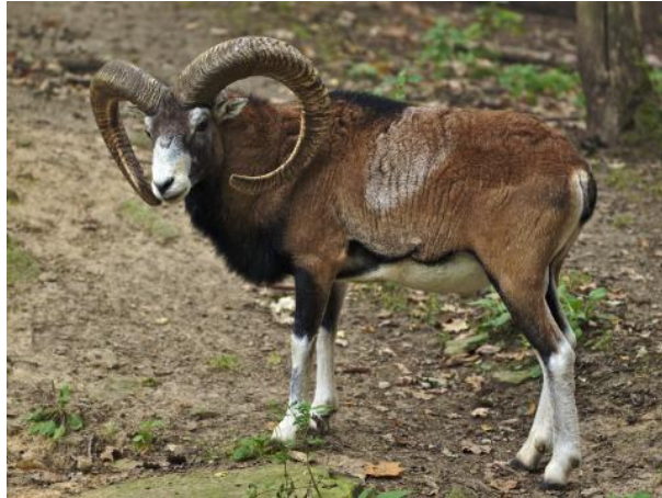
Slika 1. Muflon (Hempel/DJV, 2018.)