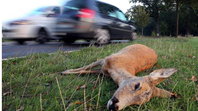
Slika 5. Srna stradala u prometnoj nesreći

Njemački lovački savez, Državno lovačko udruženje i Sveučilište Schleswig-Holstein zajedničkim su djelovanjem 2016. godine pokrenuli nacionalni katastar životinja. Katastar omogućava jedinstven skup podataka o žarištima nesreća. Namijenjen je svim sudionicima u prometu i ljubiteljima životinja koji brinu za dobrobit životinja i žele podići razinu sigurnosti na cestama (ANONYMOUS, 2019.).