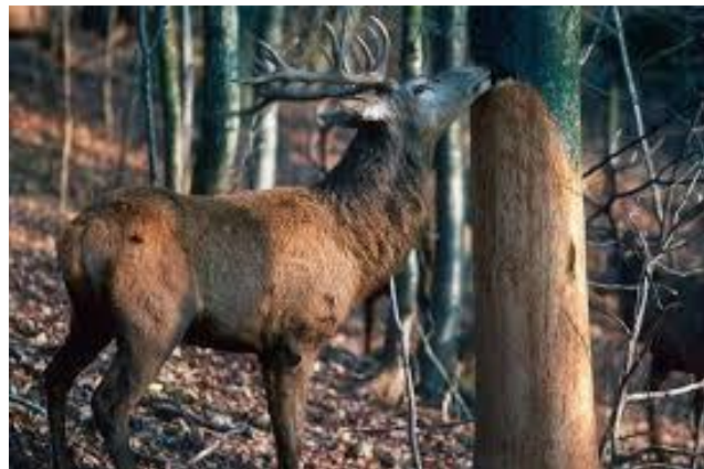
Slika 3. Guljenje kore (Melani Mijić, 2019.)

Povećanje turizma i visok lovni pritisak, također se krive za povećanu štetu na drveću. Šumari se prepiru oko toga da se jeleni više ne usuđuju danju napustiti šumu i stoga se hrane unutra (WOTSCHIKOWSKY, 2011.).