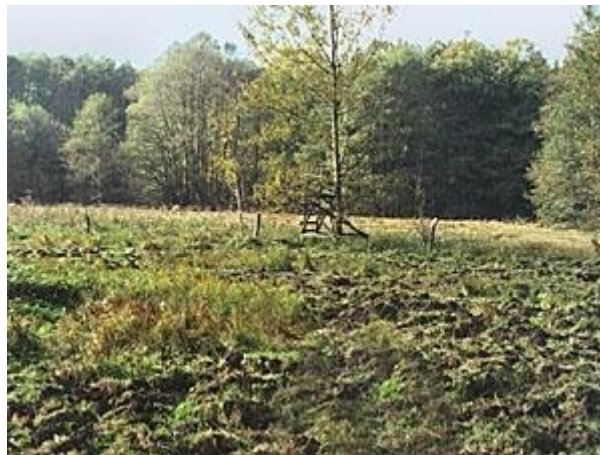
Slika 2. Livada uništena od strane divljih svinja (Johann Koch, 2015.)

Divlje svinje uzrokuju daleko najveću štetu na usjevima. Najveća šteta je na kukuruznim poljima i livadama, te u manjem stupnju na usjevima krumpira ili zobi. Sve veća veličina kukuruznih polja je poseban problem. Divlja se svinja u tim velikim poljima može skrivati mjesecima, što ju čini nemogućom za loviti. U nekim dijelovima zemlje, zemljoposjednicima je sve teže zakupiti lovišta jer potrebna kompenzacija za štetu uzorkovanu divljim svinjama premašuje cijenu najma.