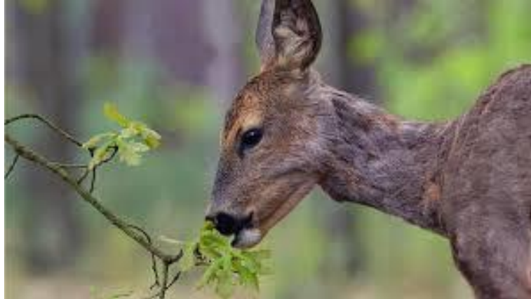
Slika 4. Brštenje lista (Melani Mijić, 2019.)

U Bavarskoj je najveća koncentracija brstenja na područjima poznatima po visokoj gustoći srne, te rijetko na područjima visoke brojnosti jelena običnog. Globalno, šteta uzrokovana brstenjem znatno je veća na privatnim lovištima, nego u državnim šumama(WOTSCHIKOWSKY, 2011.).