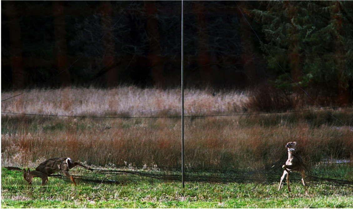
Slika 10. Prijenosna pogonska mreža