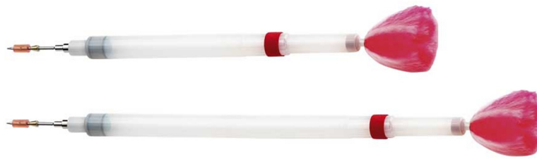
Slika 16. Strelice Dan-inject

Manje strelice rade manju štetu na životinji, osim kad pogode životinju velikom brzinom pri čemu mogu izazvati veću štetu nego velike strelice (KREEGER i sur., 2002). Vratilo igle može biti glatko ili opremljeno različitim bodljama čija je svrha da zadrže strelicu u životinji. Iznimno su dugotrajne, izrađene da izdrže različite klimatske i temperaturne varijacije te su pogodne za korištenje u svim ekološkim prilikama i iznimno su dugotrajne.