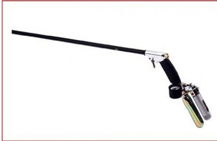
Slika 15. Pištolj Dan-inject

komprimirani zrak (KREEGER i sur., 2002). Relativno su jeftini te pogodni za upotrebu u zoološkim vrtovima, veterinarskim ordinacijama i manjim parkovima i farmama jelena i srneće divljači.