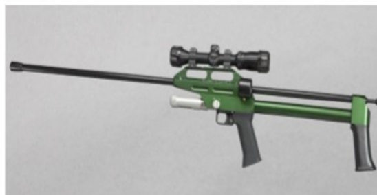
Slika 14. Puška Dan-inject

Puške za uspavljivanje pokreću strelice pomoću plina, komprimiranog CO 2 ili komprimiranog atmosferskog zraka. Za njih se koriste strelice od 11 do 13 mm jednostavnim mijenjanjem cijevi (KREEGER i sur., 2002). Efektivne udaljenosti za imobiliziranje mogu biti i do 75 metara, čak i do 100 metara za veće životinje koje imaju veće ciljne površine, a mogu biti opremljene različitim ciljnicima. Puške koje imaju mjerni uređaj i koje pokreću strelice pomoću CO 2 su najbolje i najskuplje. Strelice mogu biti zapremine i do 25 ml, iako te veće su teže i brzo padaju, što otežava precizno pucanje na daljinu. Sve strelice padaju, međutim, strelice od 1 do 2 ml koje putuju većom brzinom putuju ravnije i dalje od velikih strelica.