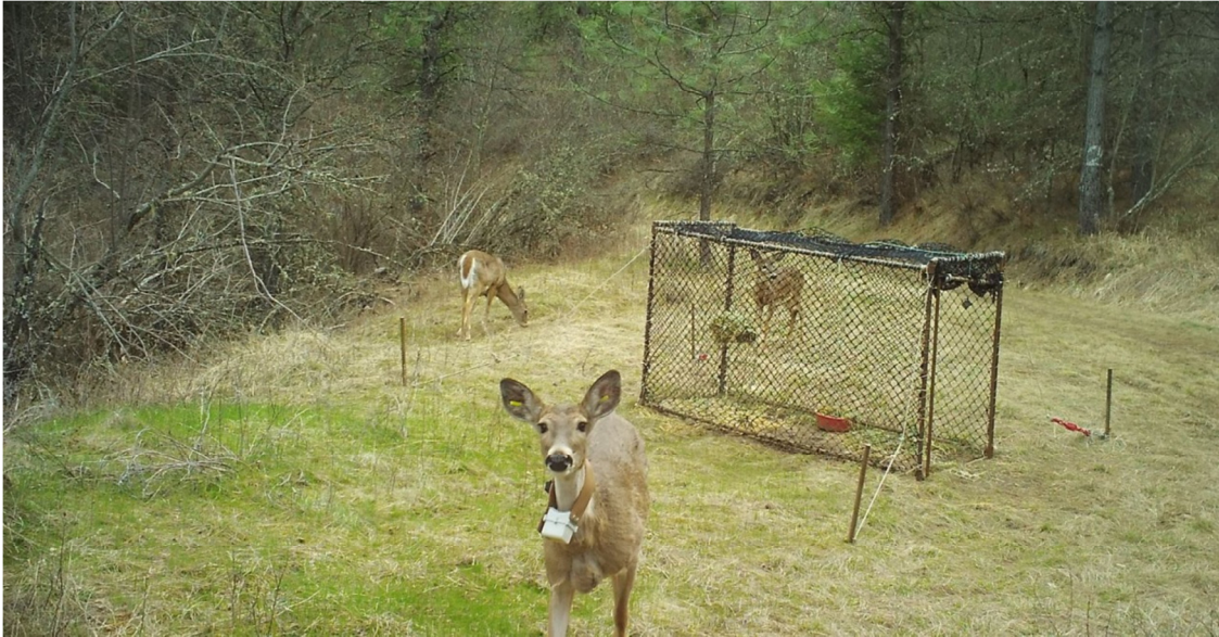
Slika 7. Kavezna zamka s mrežom