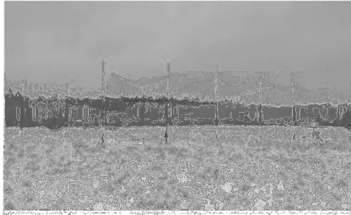
Slika 11. Padajuća mreža

se vitlo, na kojeg je pričvršćena najlonska užad i povlačenjem užadi dolazi do okidanja mehanizma kojeg aktiviraju promatrači koji su u daljini u zasjedi kada jeleni dođu ispod mreže. Kao mamac između stupova stavlja se sijeno i kukuruz. Nakon što se divljač počne redovito hraniti ispod mreže, promatrači koji sjede u zasjedi u sumrak bi ispustili mrežu kada se divljač nalazi ispod nje (JEDRZEJEWSKI i KAMLER, 2004.).