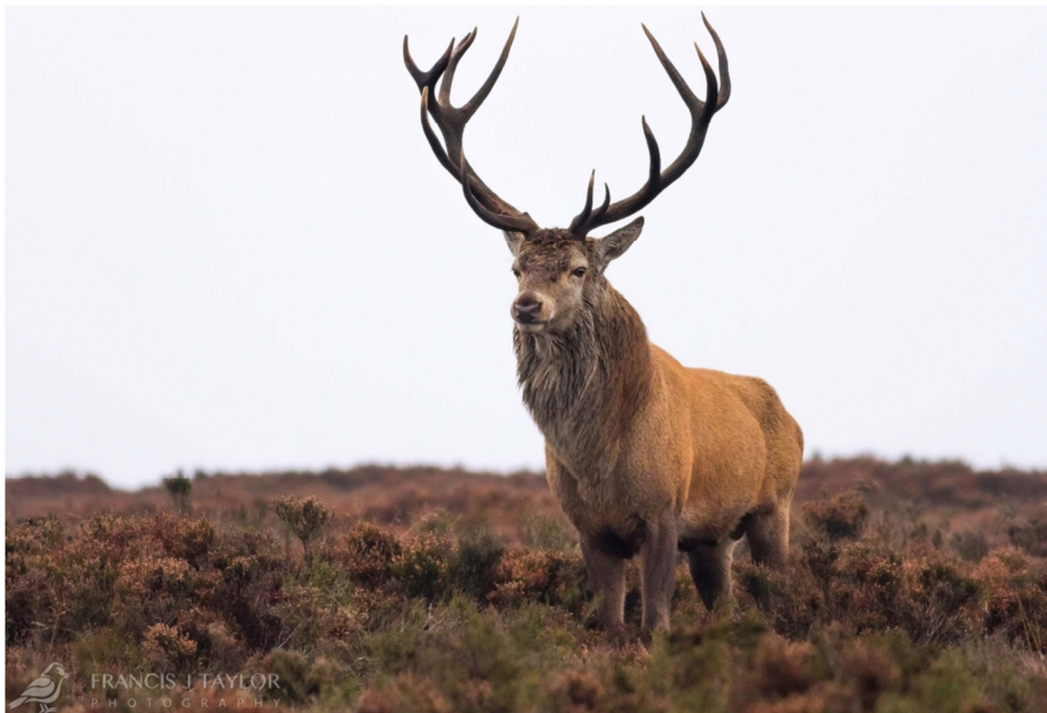
Slika 1. Jelen obični ( Cervus Elaphus )

Rogovlje se veličinom i ljepotom poboljšava sa starošću životinje sve do trenutka kada postupno počinje opadati. Kod jelena običnog rogovlje trofejna vrijednost opada između 12. i 14. godina života, dok kod srna opada između 7. i 8. godine života. Za vrijeme rasta, rogovlje je prekriveno kožom (tzv. bast ) s kratkim dlakama te dobro prožetom živicima, a koja prvenstveno štiti rastuće tkivo od infekcija (JANICKI i sur., 2007).