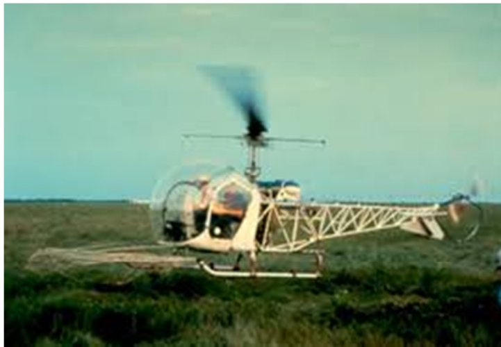
Slika 9. Ispucavanje mreže iz helikoptera.

Za uspješan rad potreban je manji broj radnih sati i radnika od nekih drugih tehnika. Izravan mortalitet i mortalitet nakon ispuštanja divljači je relativno nizak (SCHEMNITZ, 2012). Ispaljivanje mreže iz helikoptera omogućuje hvatanje od 225 do 300 životinja u relativno kratkom vremenskom razdoblju od oko tri dana (WEBB i sur., 2008.) .