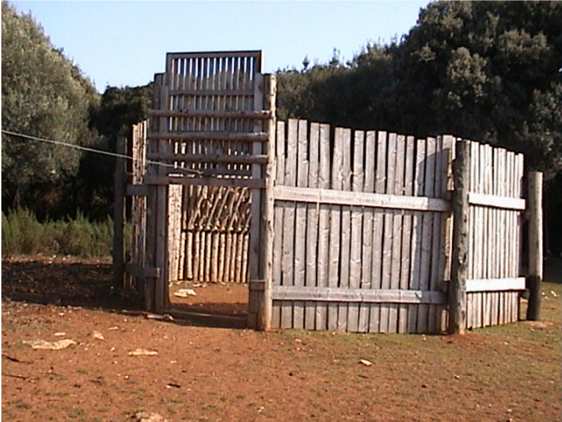
Slika 6: Lovka za jelene u NP Brijuni