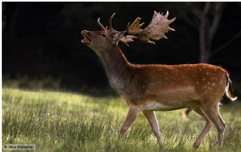
Slika 2. Jelen lopatar

Zbog specifičnosti izgleda i boje dlačnog pokrivača nepomičnog jelena lopatara je iznimno teško primjetiti u šumi.