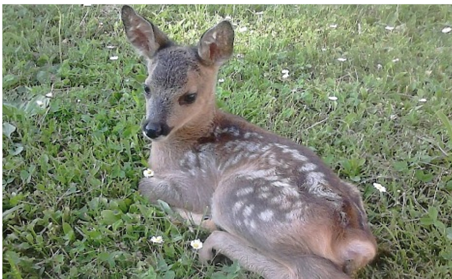
Slika 4. Lane