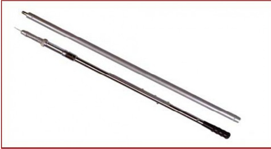
Slika 12. Injekcijski štap Dan-inject,