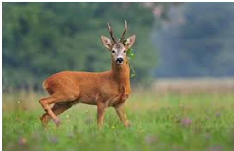
Slika 3. Srna obična ( Capreolus capreolus )

Srne su više u stražnjem dijelu tijela nego u prednjem, što govori da su građene za skokove, a ne za trčanje. Srne lako preskaču grmlje, šikaru, visoku travu i slično, ali ne mogu dugo trčati (DARABUŠ i sur., 2012).