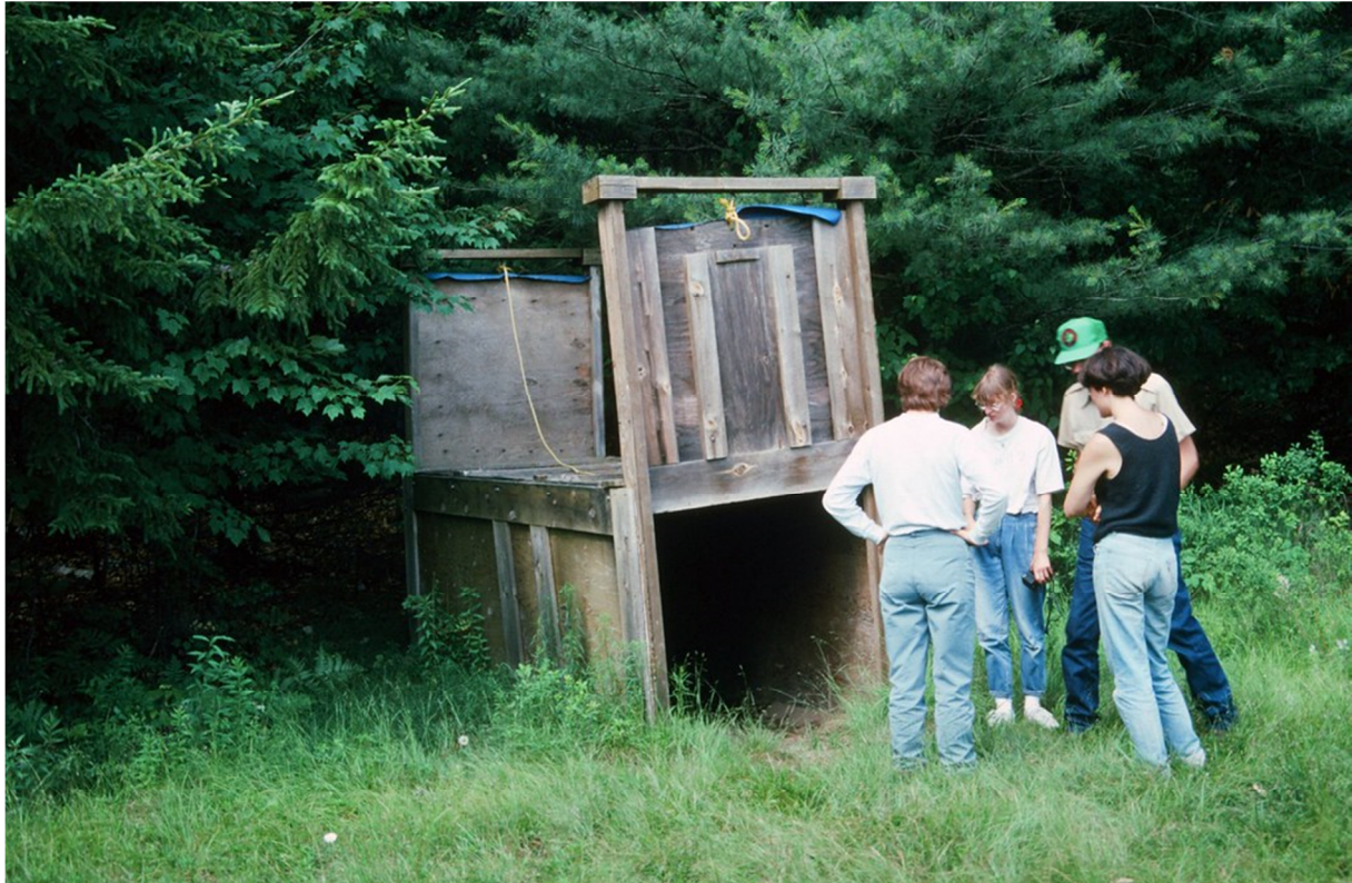
Slika 8: Stephenson zamka

Stephenson zamke su zamke koje se koriste za hvatanje cervida u sjevernoj Americi, a sastoje se od dvoja vrata, dva bočna panela, jednog gornjeg panela, jednog okidača, jednog kabela i mehanizma za povlačenje (SCHEMNITZ, 2012). Za gradnju se koristi drveni materijal za sve drvene dijelove i nehrđajući ili pocinčani materijal za većinu okidača. Okidač je izrađen od čelika i potreban je temeljni premaz te boja kako bi se spriječilo hrđanje.