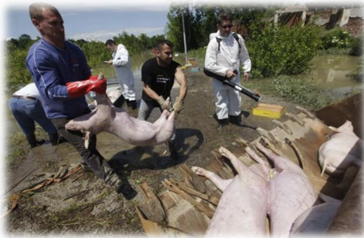
Slika 25) Prijevoz uginulih životinja

Ovaj dio zadatka postrojbe civilne zaštite obavljaju uz koordinaciju veterinarske službe. Leševi se do stočnog groblja prevoze, zakopavaju pomoću mehanizacije i čuvaju najmanje 24 sata. Treba se voditi računa da određeni prostori za stočna groblja budu izvan naselja, putova i što dalje od izvora vode. Uz zakopavanje, može se koristiti i spaljivanje leševa životinja - sigurniji način, ali i mnogo skuplji. Nakon završetka sahranjivanja životinja cijeli prostor sa svim alatima, sredstvima i opremom te odjećom pripadnika postrojbi civilne zaštite, kao i drugog osoblja potrebno je dezinficirati.