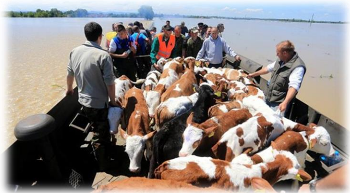
Slika 22) Evakuacija stoke u Gunji

Prilikom evakuacije mora se osigurati dovoljan broj ljudi, prenosivih i prijevoznih sredstava, hrane, vode i medikamenata te opreme za obuzdavanje životinja. Ponekad se životinje evakuiraju tek kada elementarna nepogoda prođe, jer su tada prohodni putovi za evakuaciju. Po pravilu, putovi za evakuaciju životinja ne smiju se križati s onima za evakuaciju ljudi, a moraju se planirati i alternativni putovi evakuacije ako planirani nisu pristupačni.