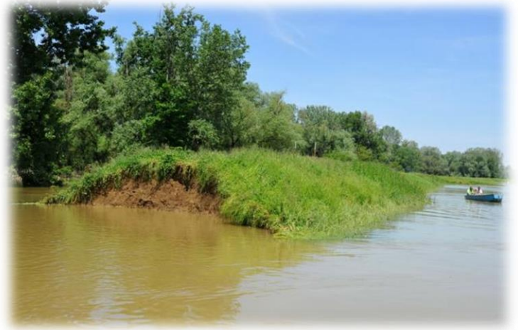
Slika 19) Mjesto proboja nasipa