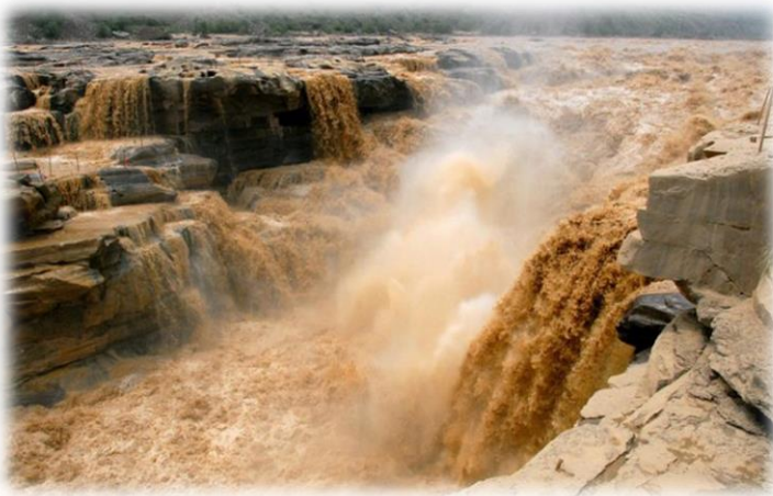
Slika 13) Rijeka Hoangho

PRAVO IME: Hoangho (Žuta rijeka) NADIMCI: Kineska tuga, Kineski ponos DUŽINA: 5464 km POVRŠINA PORJEČJA: 750 000 km 2 GLAVNI PRITOCI: Wei, Fen OBRANA OD POPLAVA: 1300 km nasipa REKORDI: druga najduža kineska rijeka; najbrže rastuća delta na svijetu