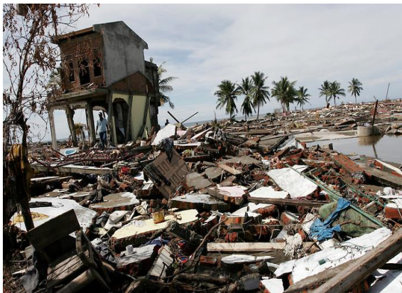
Slika 9) Posljedice Tsunamija 2004.g

Riječ je o najgorem tsunamiju svih vremena. Potres snage 9,1 Richtera (treći najjači u povijesti) kraj obale Sumatre izazvao je pomicanje morskog tla za nekoliko metara. Nevjerojatan podatak je da se cijeli planet u tom trenutku pomaknuo za jedan centimetar. Tsunami koji je uslijedio bio je prema nekim izvorima i do 30 metara visok i udario u otok Sumatru. Svima poznate scene strave ostavile su za sobom oko 230.000 mrtvih u 14 zemalja. Gotovo polovica je umrla nakon tsunamija zbog zagađenih izvora vode i hrane.