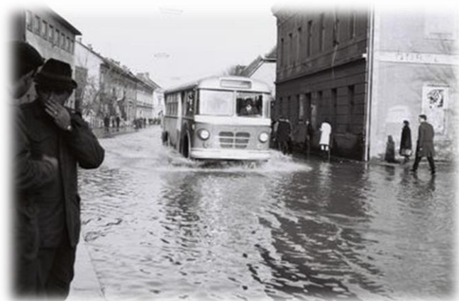
Slika 4) Poplavljena Banija 1966.godina

Velika poplava dogodila se i 1966. godine, tad je Karlovac već bio u sustavu obrane, a Kupa je stigla na 832 cm.