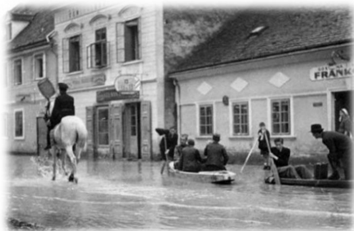
Slika 6) Poplava u Karlovcu 1939.godine Mačekova ulica

stanovnici bili prisiljeni otići iz svojih stanova, "bježalo" se na Švarču, u susjedne gradove i sela rodbini, a i u samom gradu organizirano je nekoliko prihvatilišta. Zatvorene su sve škole, s radom su prestale i brojne tvrtke, obrtnici i trgovine, a materijalna šteta bila je golema. U novije vrijeme, odnosno nakon širenja grada van Zvijezde, niti jedna poplava nije nanijela takvu štetu gradu, niti se dogodilo da praktično cijeli grad bude poplavljen, izuzevši naselja na uzvisini.