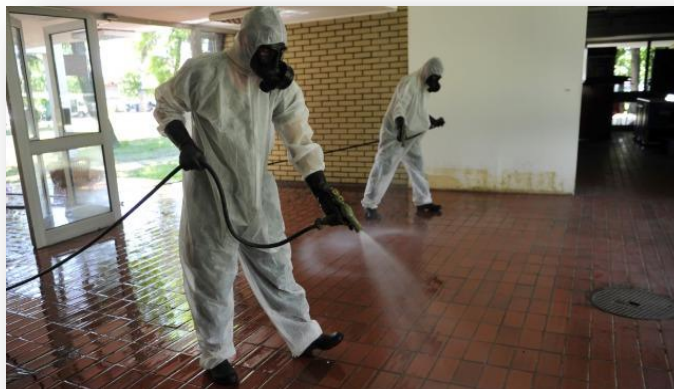
Slika 24) Dezinfekcija terena