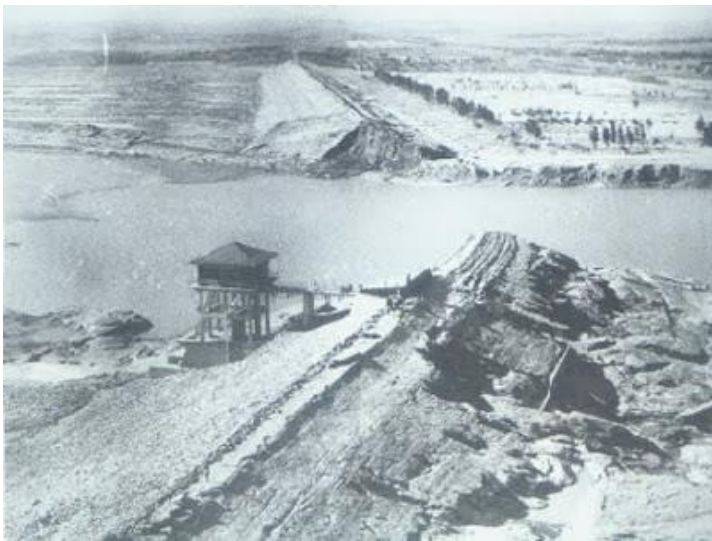
Slika 11) Brana Banqiao

Ove je godine Kinu pogodio tajfun Nina, četvrta najsmrtonosnija ciklona u zabilježenoj povijesti. Najveći broj ljudi poginuo je kad je popustila brana Banqiao. Dok neki tvrde da je popustila zbog nezabilježenih vremenskih uvjeta, drugi su uvjereni da je kriva loša konstrukcija. Nakon što je brana pukla, otvorio se pakao – tri do sedam metara visoki valovi su sa 50 km/h, u valu širokom čak 10 kilometara, opustošili su područje od preko 800 kilometara kvadratnih. Poginulo je između 90.000 i 230.000 ljudi.