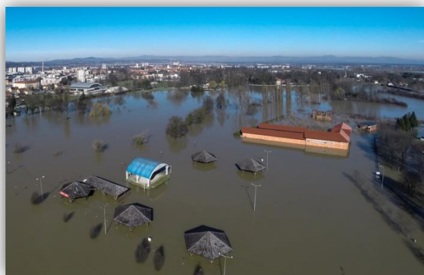
Slika 5) Poplava u Karlovcu 2014.g

U novije vrijeme veće poplave dogodile su se 2005., i 2010. godine – gradsko područje uglavnom je, izuzevši dio Drežnika, izbjeglo probleme, no u brojnim prigradskim naseljima i selima oko grada štete su bile ogromne. Ipak, niti ove dve poplave nisu bile ni blizu poplavi 2014.-te godine, u kojoj je Korana dosegla rekordnih 821cm, a Kupa se po prvi puta nakon 50 godina približila kritičnoj granici od 830cm.