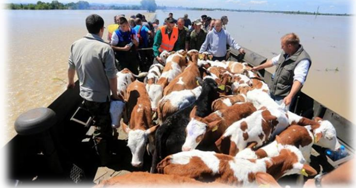
Slika 22) Evakuacija stoke u Gunji

Prilikom evakuacije mora se osigurati dovoljan broj ljudi, prenosivih i prijevoznih sredstava, hrane, vode i medikamenata te opreme za obuzdavanje životinja. Ponekad se životinje evakuiraju tek kada elementarna nepogoda prođe, jer su tada prohodni putovi za evakuaciju. Po pravilu, putovi za evakuaciju životinja ne smiju se križati s onima za evakuaciju ljudi, a moraju se planirati i alternativni putovi evakuacije ako planirani nisu pristupačni.