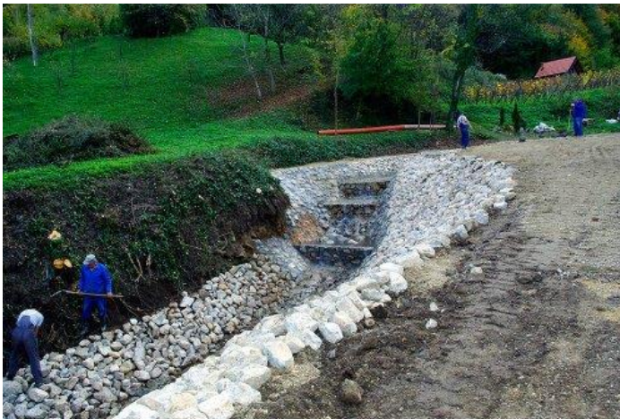
Slika 17) Izgradnja korita vodotoka

Promjena vodnog režima je samo posljedica regulacije korita i može negativno utjecati na poplave nizvodno od zahvata.