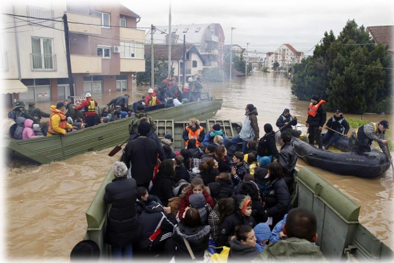
Slika 20) Evakuacija stanovništva u BiH

stanovništva, njihov boravak na određenim lokacijama i povratak u ranije mjesto boravka kada za to budu stvoreni uvjeti. Susjedne općine koje planiraju evakuaciju stanovništva unutar svoga područja osiguravaju usklađenosti mjera i postupaka u njihovom provođenju, dok se na nivou županije usklađuju i koordiniraju sve aktivnosti u slučajevima kada se stanovništvo evakuiira iz jedne općine na područje druge, udaljenije općine, grada ili županije. Provedbom evakuacije omogućuje se maksimalna zaštita stanovništva od opasnosti ili posljedica od poplava.