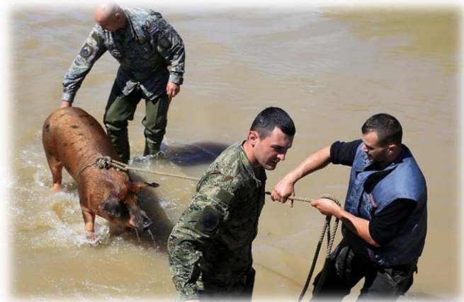
Slika 23) Spašavanje životinja u Gunji

Kako se ne mogu evakuirati sve životinje, odluku o evakuaciji određenih životinja donosi vlasnik ili odgovorna osoba i to na osnovi različitih kriterija, kao što su prodajna i rasplodna vrijednost, stadij gravidnosti, proizvodnost životinja ili na osnovi osobnih, uglavnom emotivnih procjena. Hoće li životinje biti smještene u skloništa ili će se ostaviti na otvorenom prostoru ovisi o vrsti elementarne nepogode, strukturi (čvrstoći) skloništa i njegovoj lokaciji.