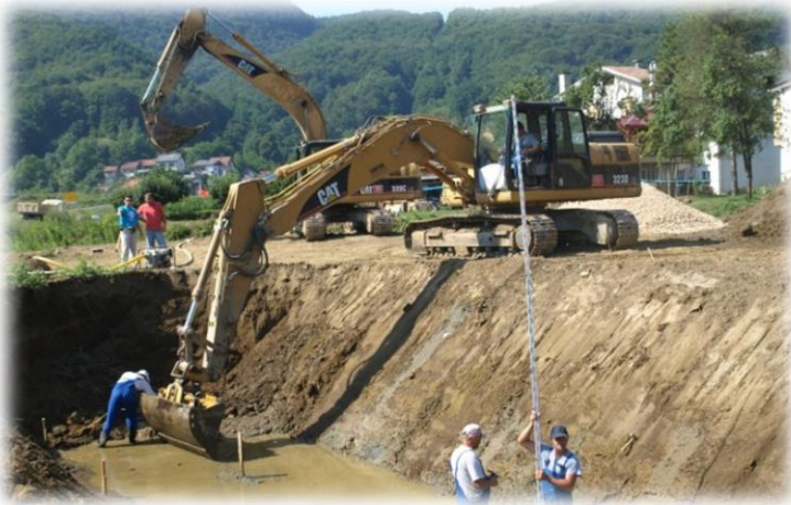
Slika 18) Građenje retencije