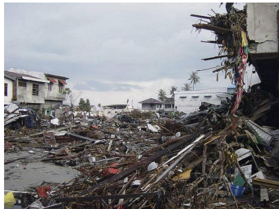
Slika 10) Posljedice Tsunamija 2004.g