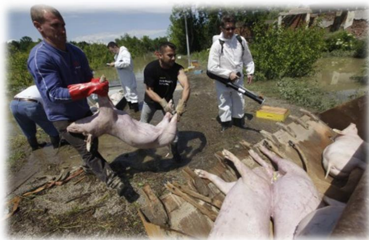
Slika 25) Prijevoz uginulih životinja

Ovaj dio zadatka postrojbe civilne zaštite obavljaju uz koordinaciju veterinarske službe. Leševi se do stočnog groblja prevoze, zakopavaju pomoću mehanizacije i čuvaju najmanje 24 sata. Treba se voditi računa da određeni prostori za stočna groblja budu izvan naselja, putova i što dalje od izvora vode. Uz zakopavanje, može se koristiti i spaljivanje leševa životinja - sigurniji način, ali i mnogo skuplji. Nakon završetka sahranjivanja životinja cijeli prostor sa svim alatima, sredstvima i opremom te odjećom pripadnika postrojbi civilne zaštite, kao i drugog osoblja potrebno je dezinficirati.