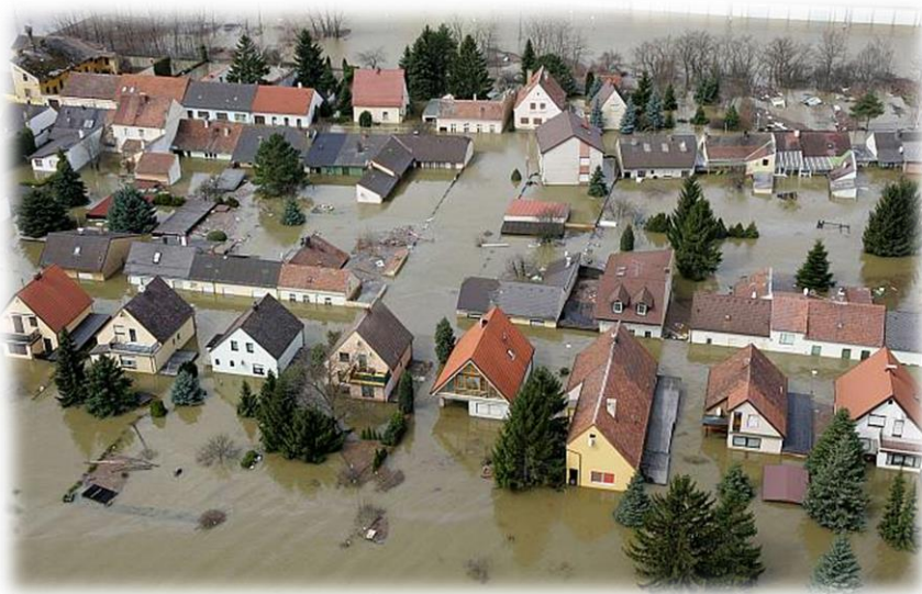
Slika 1) Poplava u Njemačkoj

Poplava (povodanj) je pojava neuobičajeno velike količine vode na određenom mjestu zbog djelovanja prirodnih sila (velika količina oborina) ili drugih uzroka kao što su propuštanje brana, ratna razaranja i sl.