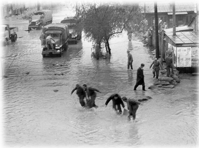
Slika 2) Poplava u Zagrebu 1964.g

Nakon katastrofalne poplave Save kod Zagreba 1964. godine pristupilo se izgradnji sustava obrane od poplava Srednjeg Posavlja, unutar kojeg se gradovi Zagreb, Karlovac i Sisak uz obrambene nasipe, brane od poplava i oteretnim kanalima. U oteretni kanal "Odra" upušta se dio velikih voda Save i na taj način se štiti područje grada Zagreba od velikih i poplavnih voda. Velike vode Kupe uzvodno od Karlovca rasterećuju se oteretnim kanalom "Kupa-Kupa". Sisak se od velikih voda rijeke Save brani preko ustave "Prevlaka" kojom se voda upušta u oteretni kanal "Lonja-Strug". Interesantno je spomenuti da je oteretni kanal "Odra" do sada bio u funkciji pet puta: dva puta u 1979., jedanput u 1980., 1990. i 1998. godini.)