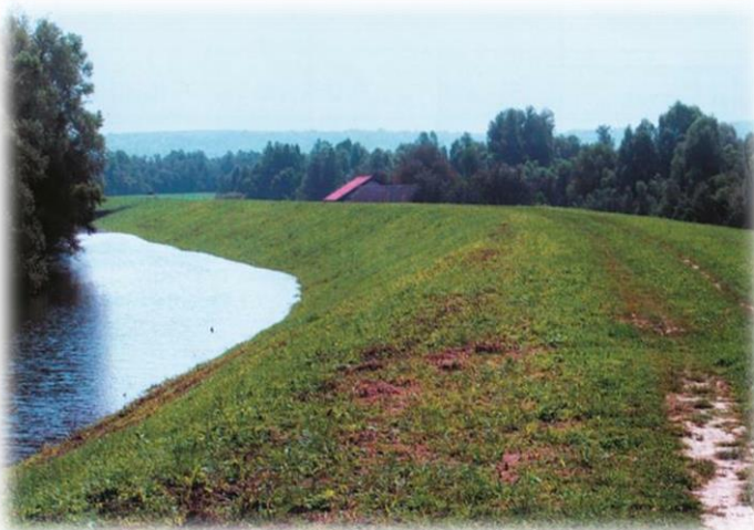
Slika 15) Nasip

Nasip predstavlja građevinu ili dio građevine koji je izgrađen od zemljanog materijala iznad prirodnoga terena. Nasip može biti brana, nasip za zaštitu od poplava, obalni nasip plovnoga, odvodnog ili drugih kanala, donji ustroj ceste ili željezničke pruge i sl.