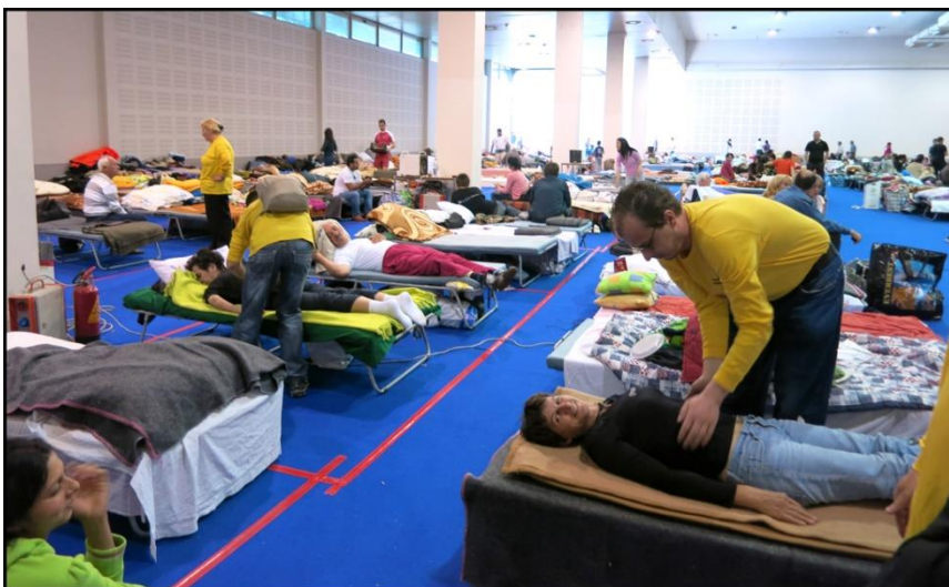
Slika 21) Stanovništvo u skloništu Crvenog križa