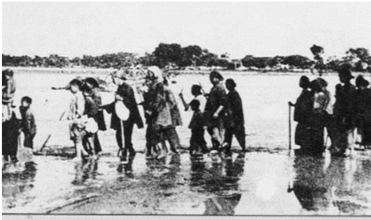
Slika 12) Nizozemska (Zla srijeda) 1530.g

Poplava se dogodila na dan kojim Nizozemci obilježavaju Sv. Felixa. Ovaj dan kasnije je nazvan Zla srijeda. Poginulo je oko 100.000 ljudi.