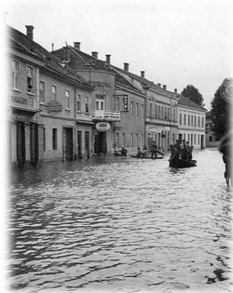
Slika 7) Poplava u Karlovcu 1939.

Kupa je tada dosegla nevjerojatnih 872 centimetra i poplavila doslovno cijeli grad. To je najveći vodostaj Kupe zabilježen u povijesti, a Karlovčani su se punih tjedan dana ulicama mogli kretati gotovo isključivo uz pomoć čamaca. Mnogobrojni su