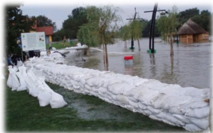
Slika 16) Zečji nasip

Obično je izduženog oblika u pogledu odozgo, a trapeznoga oblika u poprečnome presjeku. Nasip se izgrađuje nasipavanjem, ravnanjem i zbijanjem zemljanog materijala u horizontalnim slojevima po punoj širini, a debljina slojeva ovisi o vrsti materijala i namjeni nasipa. Nasip za prometnice gradi se tako da njegovo slijeganje tokom korištenja bude što manje, gornja ploha stabilna, a nosivost dovoljna za predviđeno opterećenje. Kod hidrotehničkih nasipa nastoji se ostvariti što manja vodopropusnost, stabilan pokos uz vodu, te otpornost na eroziju. Prve vrste ovih nasipa izgrađene su već 3000. pne. na području Egipta u dolini rijeke Nil. Također, i stanovnici Mezopotamije kao i stanovnici drevne Kine bili su upoznati s ovim sustavom zaštite. Nasipi za obranu od poplave razlikuju se prema svojoj užoj