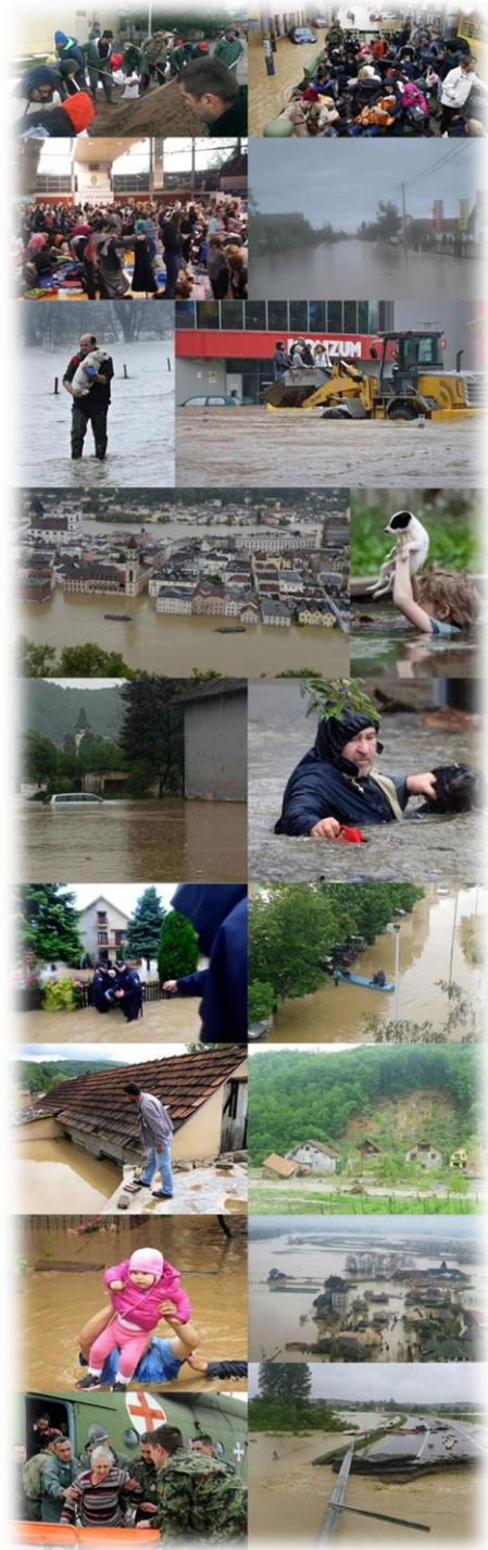
Slika 3) Poplave u Hrvatskoj, Srbiji i BiH

Unatoč strašnoj tragediji koja je pogodila znatan dio Balkana, stanovnici svih zemalja pokazali su izuzetnu solidarnost s unesrećenima, te su mnogi otputovali na krizne lokacije kako bi pomogli u spašavanju gradova, naselja i stanovnika.