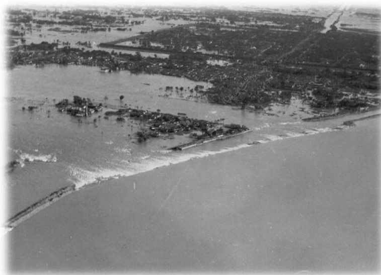
Slika 8) Izljevanje rijeka Yangtze i Huai 1930.g

Ove su godine u Kini poplavile rijeke Yangtze (Duga rijeka) i Huai. Kinu su od 1928. do 1930. pogodile strahovite suše. No, zimi 1930. započelo je abnormalno vrijeme. Nakon velikih snježnih oluja uslijedile su snažne proljetne kiše koje su podigle nivo rijeka. Kiša se pojačala na ljeto. Nakon što su rijeke poplavile, tadašnji glavni grad Nanjing pretrpio je stravičnu sudbinu. Osim ljudi koji su poginuli u poplavama, mnogi su umrli od kolere i tifusa. Zabilježeni su slučajevi kanibalizma, prodavane su žena i djeca. Treba napomenuti da se kineski izvori ne slažu sa zapadnjačkim oko broja poginulih – dok Kinezi navode njih "samo" 145.000, zapadnjaci navode mnogo veći broj – do čak četiri milijuna.