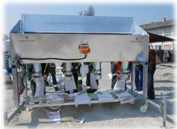
Slika 26) Punilica pijeska

Karlovačka Čistoća ju je kupila u Austriji, za 130.000 kuna, a u sat vremena, uz četiri čovjeka na punilici, jednog na šivanju vreća i trojicu koji ih dodaju i odnose, može napuniti 2.500 vreća s pijeskom. Usporedbe radi, na zečjem nasipu na Rakovcu, građenog za prošlogodišnjih poplava, radili su brojni Karlovčani i napunili oko 2.000 vreća.