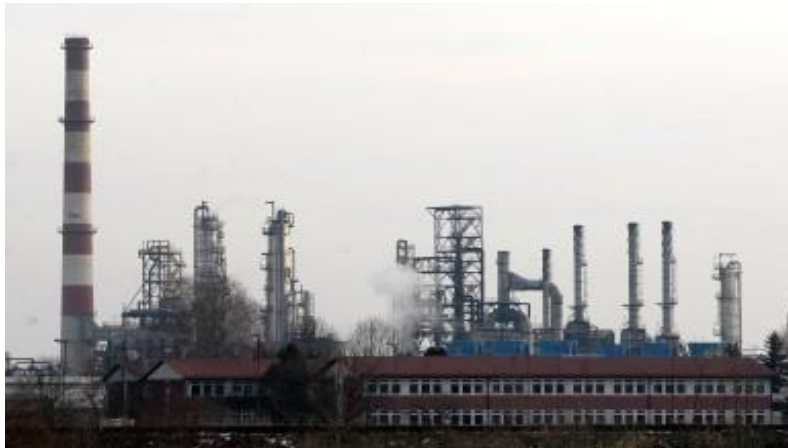
Sl. 1. Rafinerija nafte Sisak [3]

U užem smislu Rafinerija nafte Sisak je smještena u južnoj industrijskoj zoni grada Siska, neposredno uz ušće rijeke Kupe u Savu (slika 1). Sa zapadne strane Rafinerija nafte Sisak je omeđena prometnicom koja vodi kroz ulice Aleja narodnih heroja i Braće Bobetko, te željeznicom prugom Zagreb-Volinja koja je povezuje sa Željeznikom transportnim sustavom Hrvatskih željeznica.