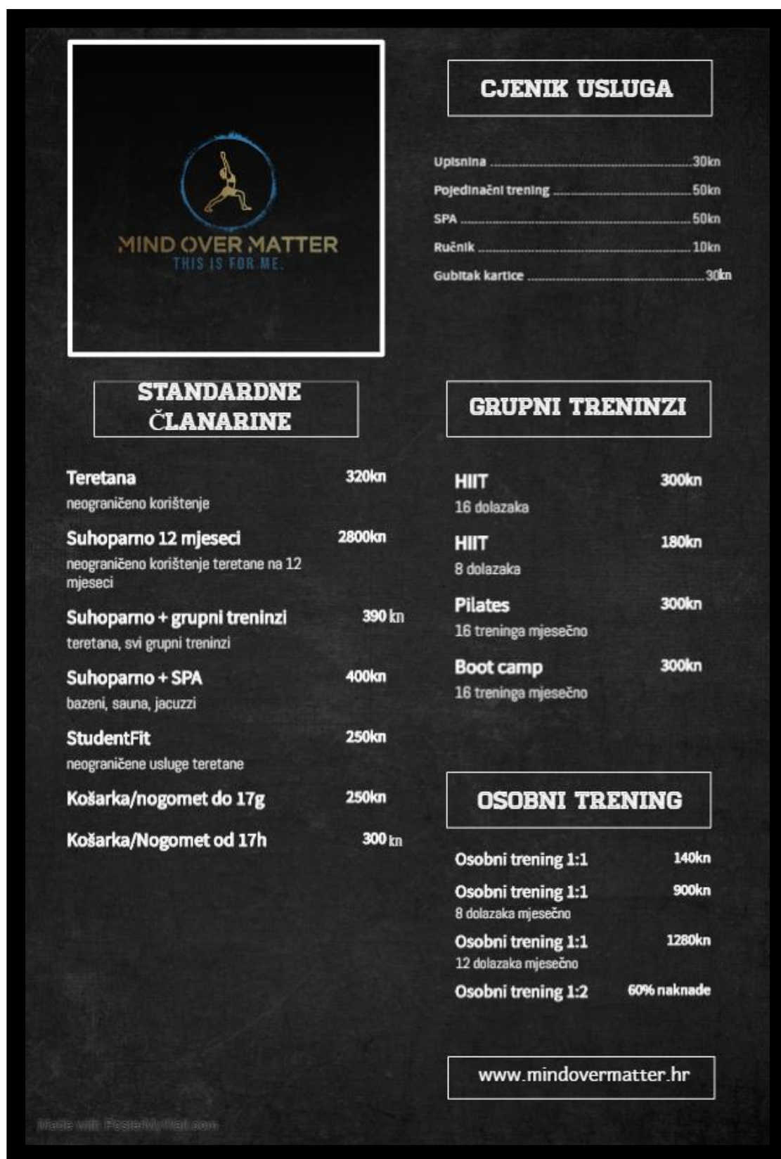
Slika 1. Cjenik usluga