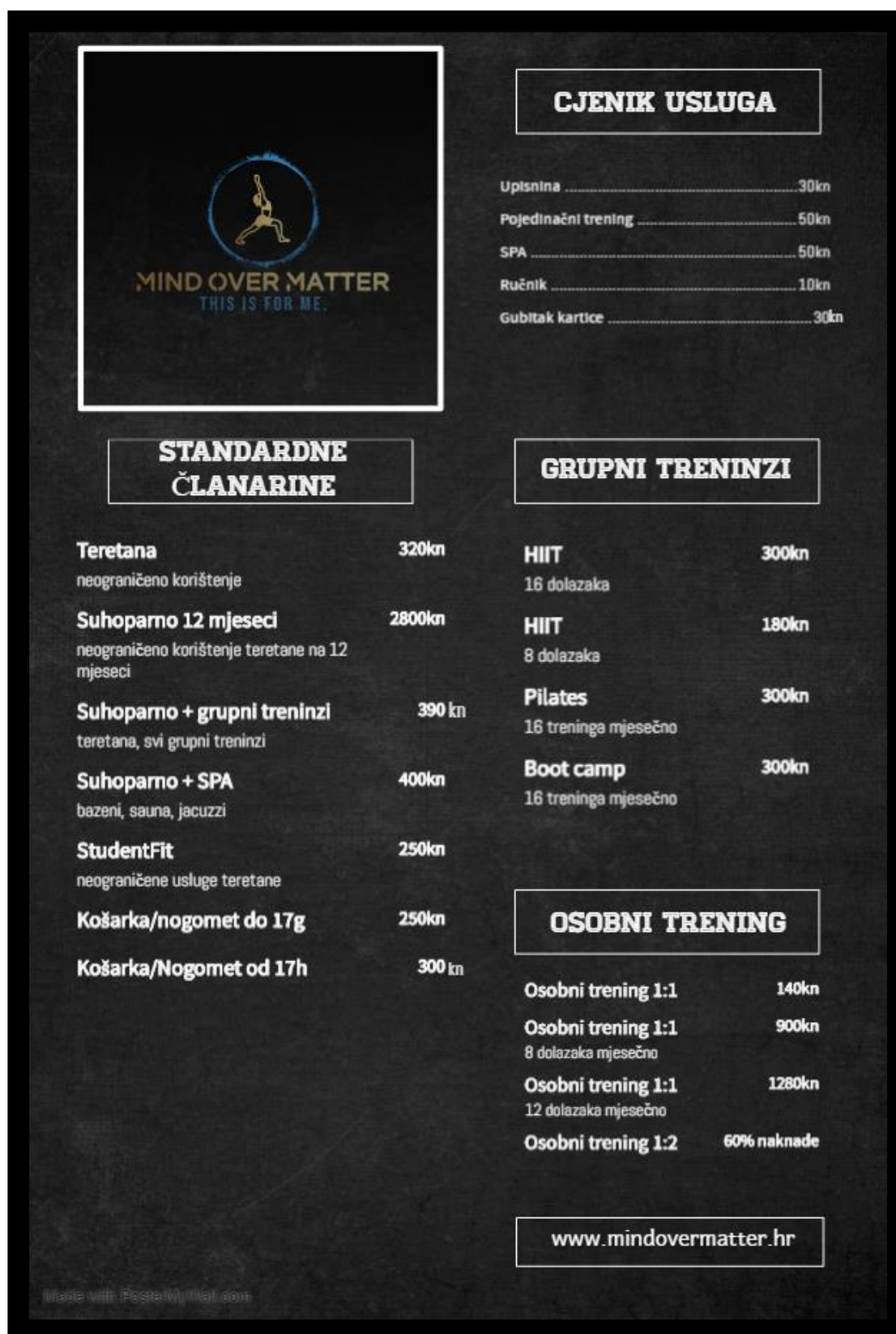
Slika 1. Cjenik usluga