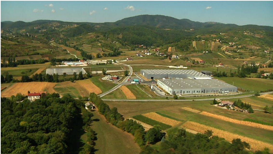
Slika 1. Punionica vode Jana [2].

Jana je hrvatski proizvođač pića, točnije izvorske vode pod vlasništvom tvrtke "Jamnica", koja je dio Fortenova grupe. U sastavu Jamnice plus d.o.o. su punionica prirodne mineralne vode Jamnice u Pisarovini, punionica prirodne izvorske vode Jane i bezalkoholnih pića u Svetoj Jani (slika 1.), punionica prirodne mineralne vode i bezalkoholnih pića Sarajevski Kiseljak u Bosni i Hercegovini, punionica mineralne vode Fonyódi u Mađarskoj te vlastite distribucijske kompanije u Sloveniji, Srbiji i SAD-u. Jamnica je danas najveći hrvatski proizvođač mineralnih i izvorskih voda te bezalkoholnih pića s tradicijom duljom od 180 godina. Jamnica je izrasla u jednu od najmodernijih europskih punionica mineralnih i izvorskih voda i bezalkoholnih pića, s ukupnom godišnjom proizvodnjom od 400 milijuna litara, što je čini i najvećim proizvođačem te vrste na jugoistoku Europe. 18. srpnja 2002. Jamnica započinje s komercijalnom proizvodnjom prirodne izvorske vode Jane [2].