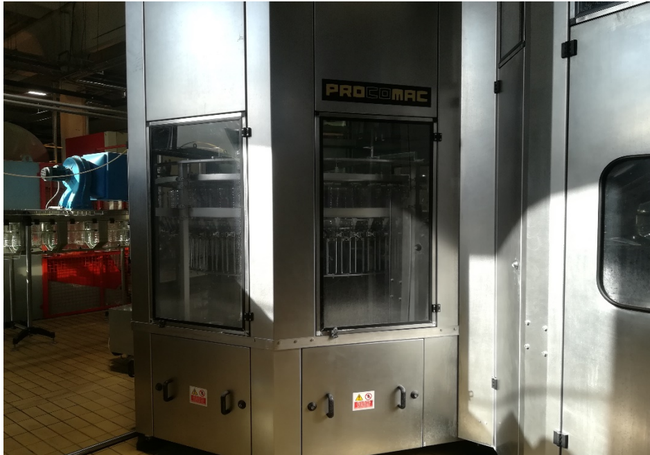
Slika 19. Prikaz stroja sa čvrstom zaštitnom napravom.