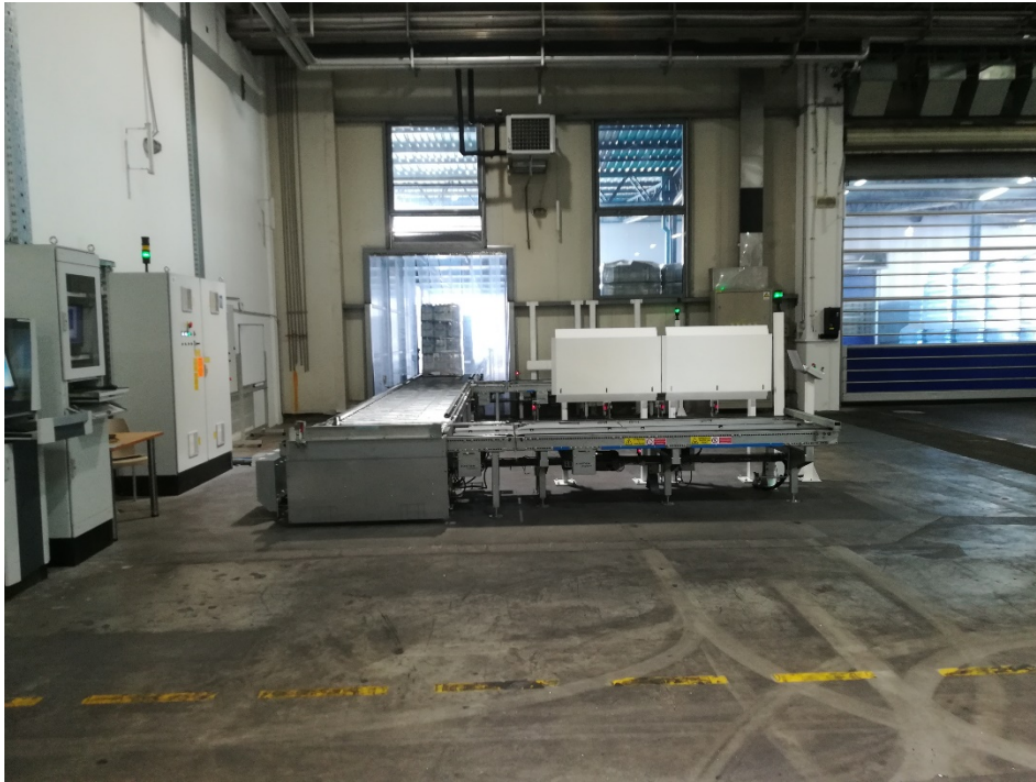
Slika 10. Transportni tunel iz proizvodnog pogona prema skladištu.

Nakon formiranja, paleta se omotava „stretch“ folijom te se nakon omotavanja označava i robot viličar ju odvozi do transportnog tunela (slika 10.).