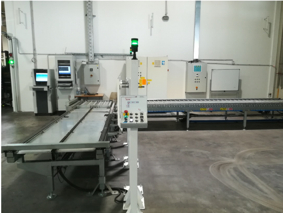
Slika 14. Prikaz postavljene instalacije, instalacijskih ormara i pultova.

Štetno djelovanje ovisi i o nizu drugih okolnosti kao što su frekvencija struje, put prolaza struje kroz tijelo te o individualnim svojstvima organizma čovjeka [8].