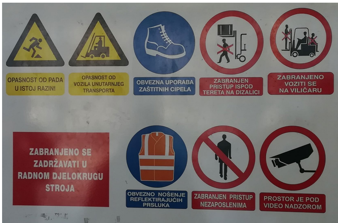
Slika 12. Znakovi u teretnom dijelu pogona.