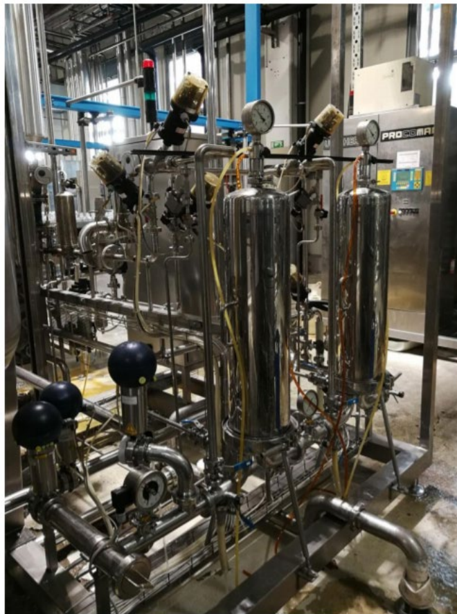
Slika 3. Filteri za pročišćavanje vode.

Uz pomoć pumpi voda se iz bušotina preko cjevovoda transportira do tvornice u kojoj se nalazi tank volumena 15 000 litara za prijam vode i daljnju distribuciju prema proizvodnim linijama. No prije dolaska vode u pet ambalažu ona prvo preko pumpa prolazi kroz filter koji se naziva puffer tank (slika 3.). Iz puffer tanka voda se transportira kroz mikro filter do bloka punjača.