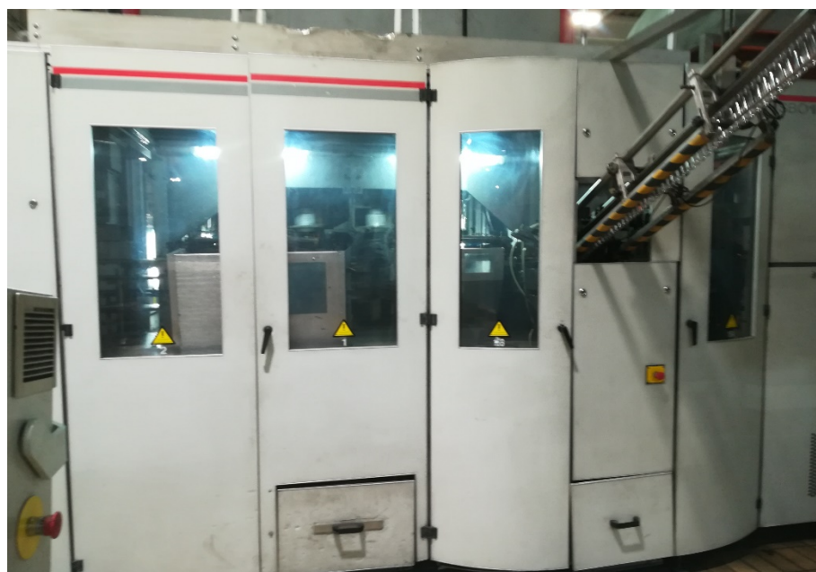
Slika 6. Puhaljka za predoblike sa transportnom trakom.

Ukoliko boce zadovoljavaju sve propisane uvjete nakon izlaska iz blok punjača, one se zatim transportiraju do etiketirke (slika 7.). Etiketirka je automatski stroj namijenjen za apliciranje etiketa na pet ambalažu.