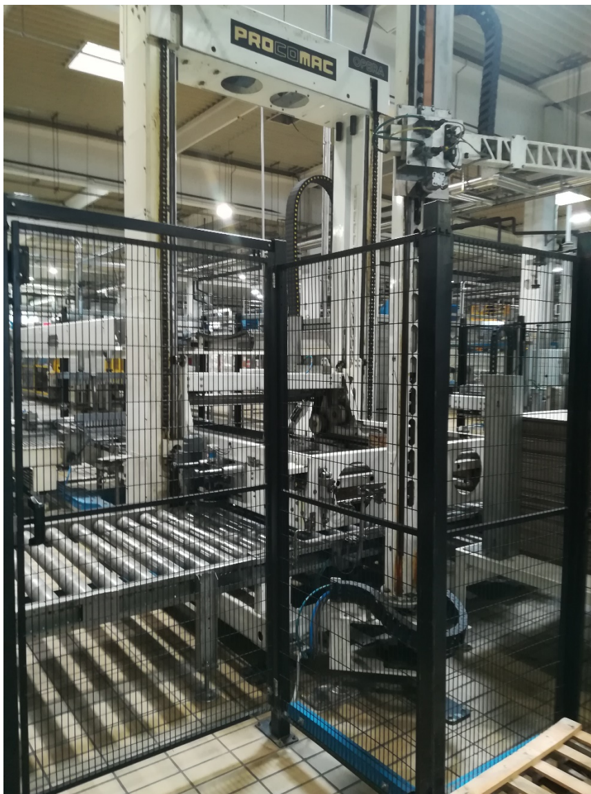
Slika 22. Zaštitna ograda oko paletizatora.

Prvo što primjećujemo da oko stroja i linije se nalazi zaštitna ograda koja služi za zadržava radnike dalje od radnog prostora stroja (slika 22.). Ograda koja ograđuje stroj spada u čvrste i/ili nepomične zaštitne naprave.