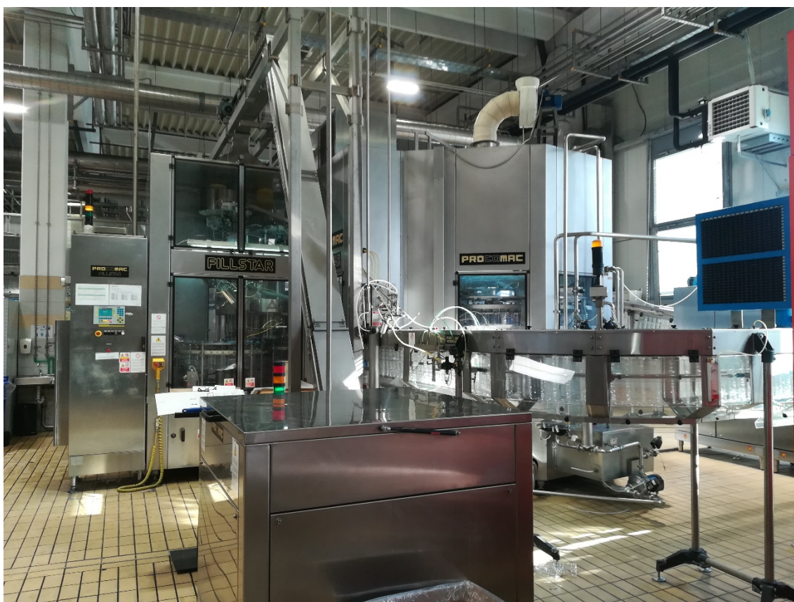
Slika 4. Blok punjača sa trakom za prijenos pet ambalaže.

Iz „puffer“ tanka voda se transportira kroz mikro filtre do bloka punjača. Blok punjača se sastoji od punjača i čepilice. Proces je takav da boce ulaze u punjač pomoću transportne trake od strane depaletizatora te ih zahvaća rotirajuća ulazna zvijezda. Prilikom prolaska boce se ispiru te se pune vodom i vanjskom zvijezdom se transportiraju do čepilice. Čepovi se stavljaju u spremnik čepova kojim se čepovi spuštaju do čepilice. Pet ambalaža prije dolaska u blok punjač (slika 4.) mora proći kroz puhaljku kako bi dobili željeni oblik boce.