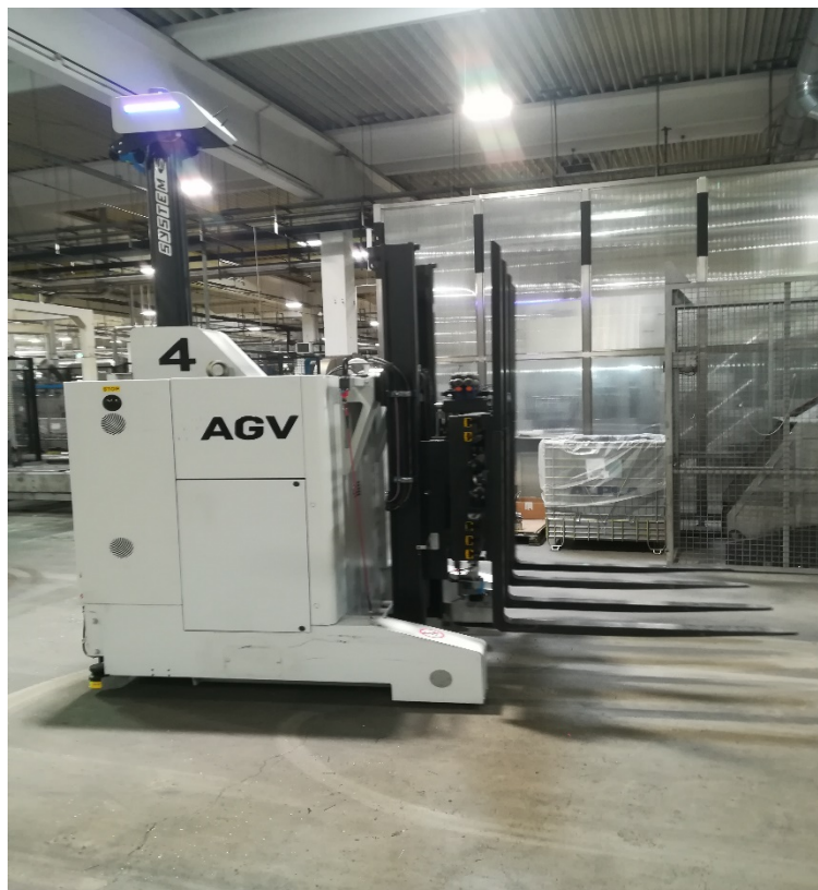
Slika 16. Robot viličar za pogonski dio firme.

U pogonskom dijelu su u uporabi roboti viličari koji predstavljaju manji trošak od klasičnog radnika, u obavljanju rutinskih radnji najčešće točniji od čovjeka, poboljšavaju kvalitetu proizvodnje te minimiziraju potrošnju različitih resursa i ne stvaraju otpad (slika 16.). Isto tako smanjuje se unos štetnih tvari iz vanjske okoline jer se zadržavaju uvijek u istom prostoru, manja je vjerojatnost za ozljeđivanjem radnika koji rade u krugu transportnih puteva te dolazi do smanjenja obujma posla koju su morali obavljati vozači viličara što jako utječe na psihofiziološke i statodinamičke napore [15].