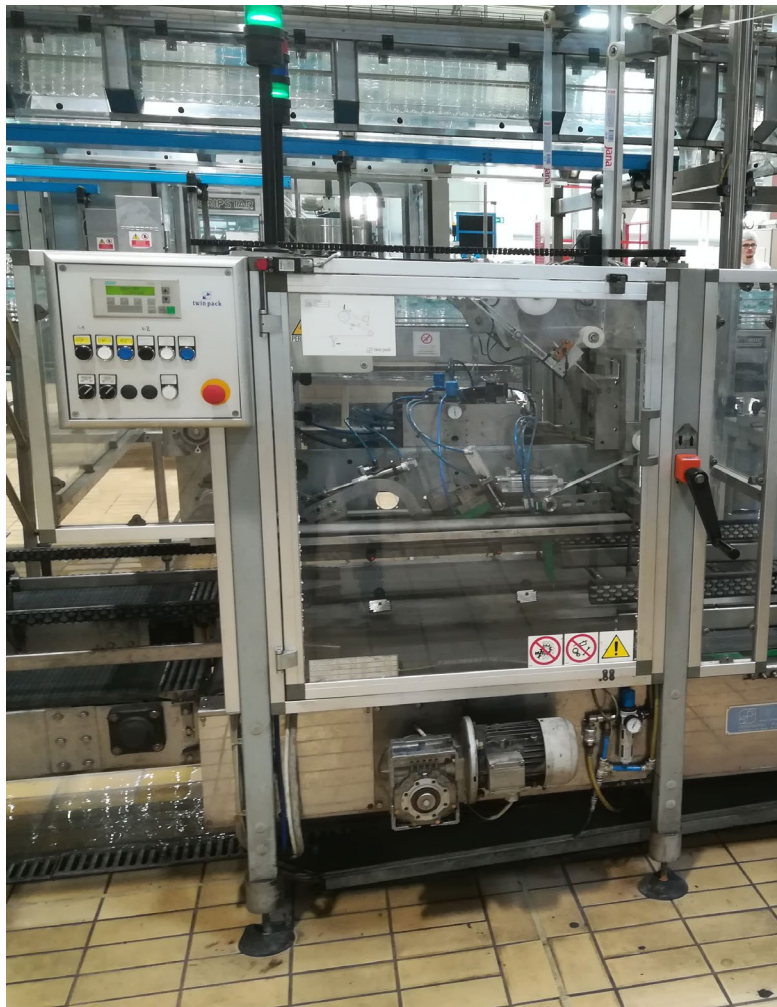
Slika 17. Prikaz blokirane zaštite sa mehaničkim i električnim mehanizmom.

Ovakve vrste zaštitnih naprava sprečavaju da stroj radi kada se aktivira blokada, tako da radnik više ne može doći u opasnost (slika 17.). Kada je zaštitna naprava otvorena, startni mehanizam je blokiran, kako bi se spriječio iznenadni start stroja. Blokade su mehaničkog ili elektroničkog tipa. Mogu se ugrađivati i dvoručni uređaji za pokretanje stroja. Ovi uređaji zahtijevaju da obje ruke budu na komandama koje su udaljene od opasnih mjesta na stroju [17].