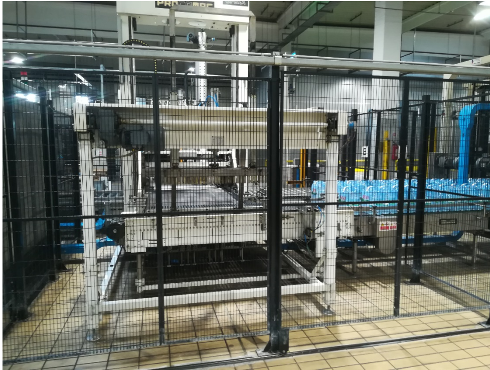
Slika 13. Zaštitna ograda između stroja i radnog prostora.