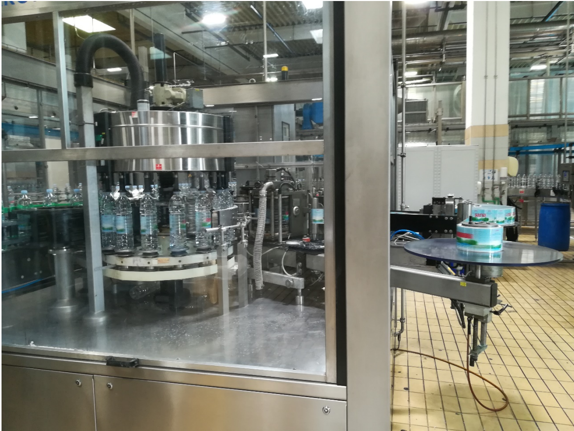
Slika 7. Stroj za ljepljenje etiketa.

Stroj koristi prethodno uvedene etikete iz role koje samostalno reže okretnim nožem i lijepi na boce pomoću ljepila koje se nalazi u spremniku unutar stroja. Nakon etiketiranja, proizvod se transportira do stroja za upakiravanje proizvoda (slika 8.).