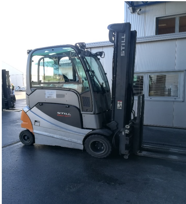
Slika 15. Viličar za skladišni prostor i utovar kamiona.