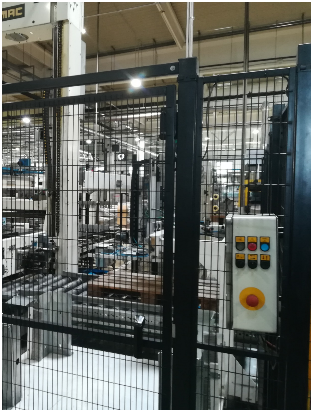
Slika 24. Prikaz tipkala za upravljanje strojem.