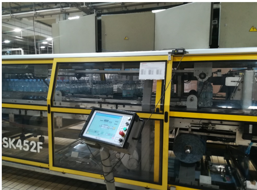
Slika 8. Upakivač.

Paletizator je stroj koji automatski prema zadanom programu slaže pakete na paletu ovisno o dimenziji paketa (slika 9.).