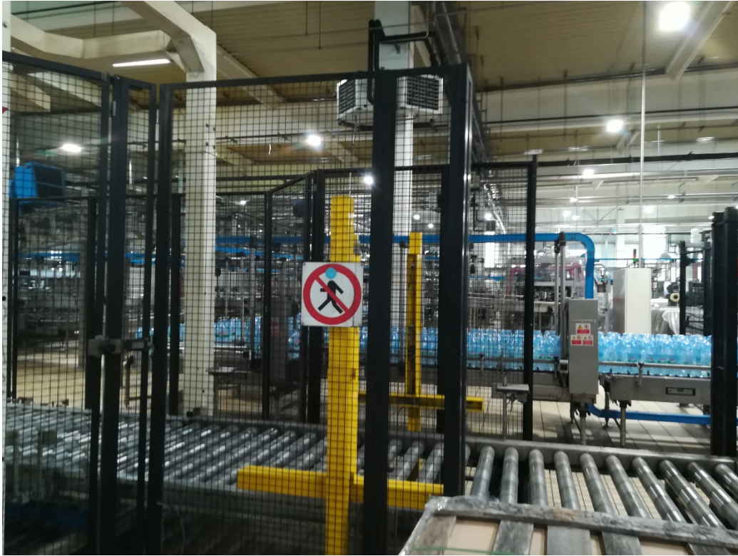
Slika 23. Slika znaka zabranjeno kretanje.

Iduća mjera zaštite su znakovi upozorenja kako bi se označilo da se iza ograde nalazi opasnost i da se treba zadržavati dalje od radnog prostora stroja jer može doći do ozljeda po osobi koja ih se ne pridržava (slika 23.).