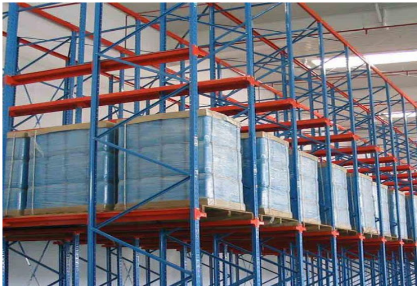
Slika 11. Regalno skladište.

Nakon izlaska formirane palete, viličarist je pomoću električnog viličara preuzima na izlazu i skladišti u regalno skladište (slika 11.).