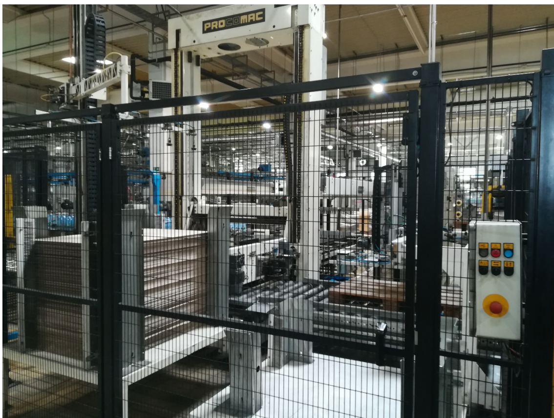
Slika 21. Paletizator u proizvodnom pogonu.

Svaki osnovni model paletizatora može biti opremljen raznim dodatnim opcijama koje omogućuju stroju da posjeduje specifičnu prirodu posla.