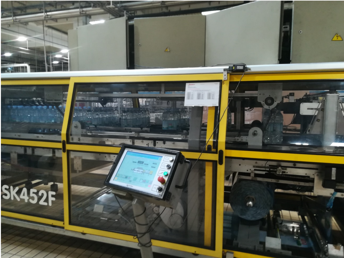
Slika 20. Centralni pult za upravljanje strojem.