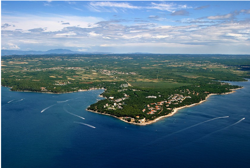
Slika 3. Poluotok Lanterna