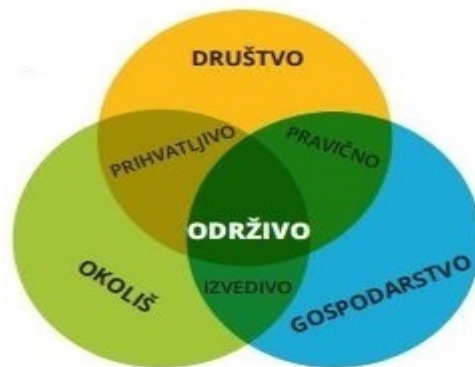
Slika 1. Značenje pojma održivog razvoja turizma