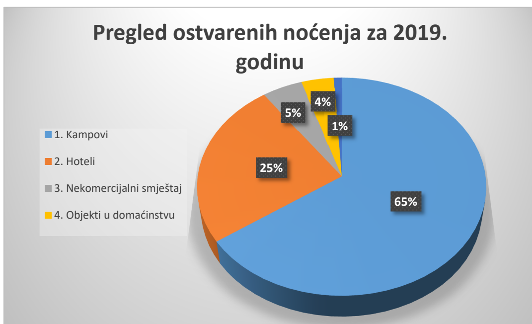
Grafikon 1. Pregled ostvarenih noćenja za 2019. godinu