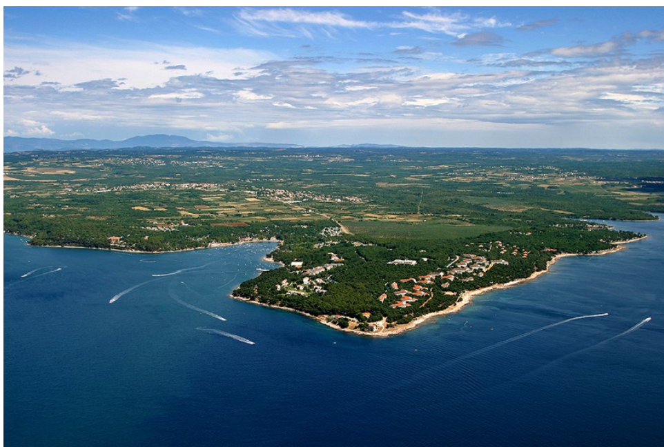
Slika 3. Poluotok Lanterna