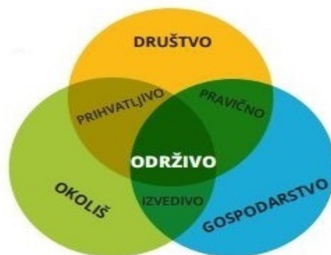
Slika 1. Značenje pojma održivog razvoja turizma