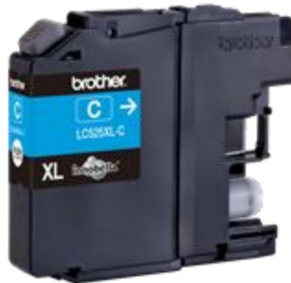
Slika 8 - Uložak tinte plave boje [17]

Slika 8. prikazuje uložak tinte plave boje proizvođača Brother.