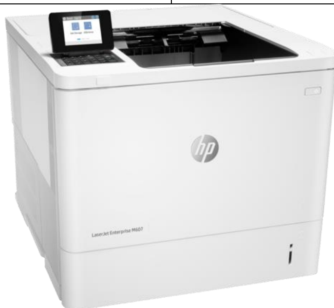
Slika 4 - Laserski pisac HP LaserJet Enterprise M607dn [9]