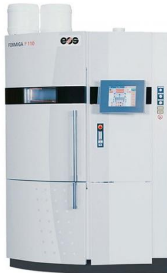
Slika 6 - Eos Formiga P 110 Velocis [13]