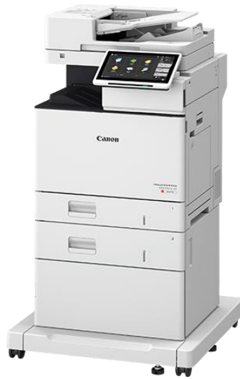
Slika 12 - Multifunkcionalni uređaj Canon - imageRUNNER ADVANCE DX C477[28]

Slika 12. prikazuje multifunkcionalni uređaj imageRUNNER ADVANCE DX C477 proizvođača Canon.