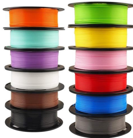
Slika 10 - Plastični filament 3D pisača [26]

Slika 10. prikazuje plastični filament 3D pisača, a slika 11. prikazuje prah koji se koristi u selektivnom laserskom srašćivanju.