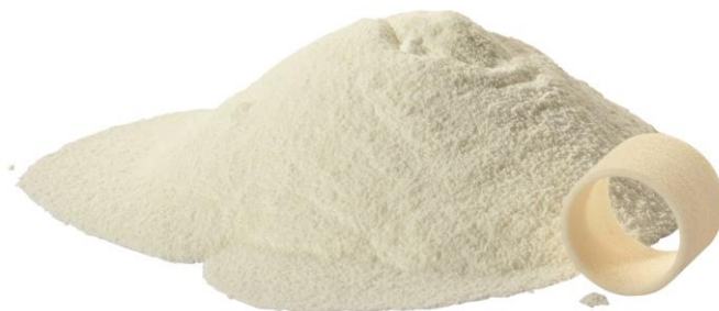
Slika 11 - Prah za selektivno lasersko srašćivanje [27]