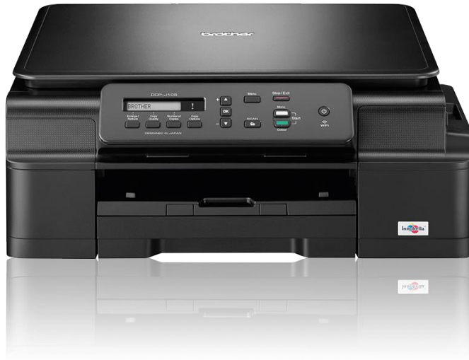
Slika 3 - Tintni pisač Brother DCP-J105 [7]

Slika 3. prikazuje tintni pisač Brother DCP-J105 .