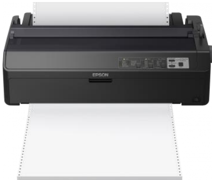
Slika 1 - Matrični pisač Epson LQ-2090II SERIES [5]