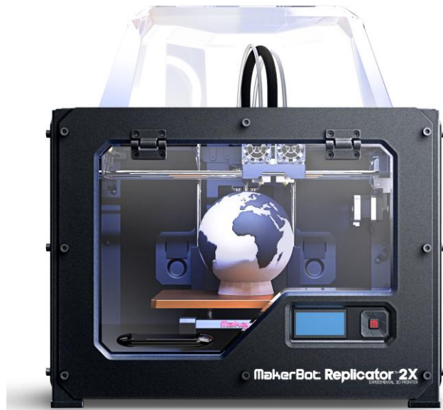
Slika 5 - 3D printer MarkerBot Replicator 2x [12]