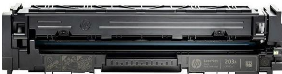
Slika 9 – HP toner laserskog pisača [23]

Slika 9. prikazuje HP toner laserskog pisača.