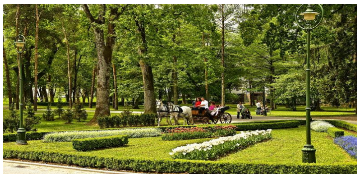
Slika 2. Vrbanićev perivoj