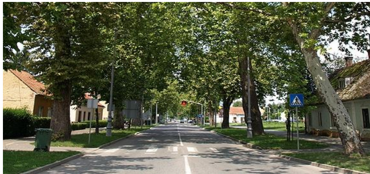
Slika 3. Marmontova aleja