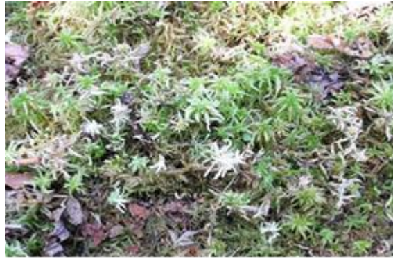
Slika 1. Cret Banski Moravci