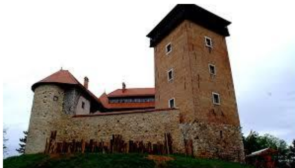
Slika 4. Stari grad Dubovac,

srednjovjekovne dubovačke općine potkraj 12. ili na početku 13. stoljeća. Danas izgleda kao renesansni kaštel sa gotičkim elementima. 14