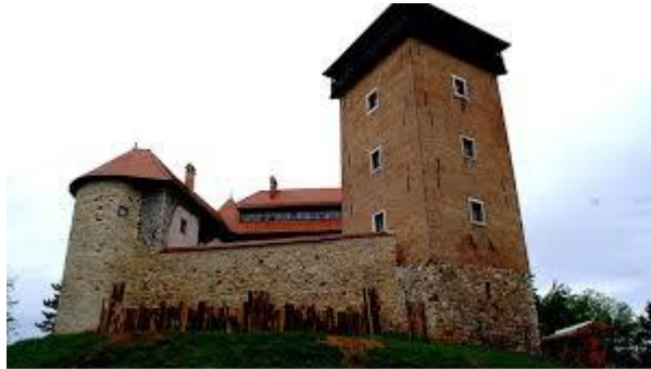
Slika 4. Stari grad Dubovac,

srednjovjekovne dubovačke općine potkraj 12. ili na početku 13. stoljeća. Danas izgleda kao renesansni kaštel sa gotičkim elementima. 14