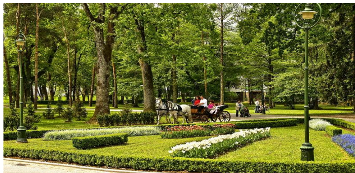
Slika 2. Vrbanićev perivoj