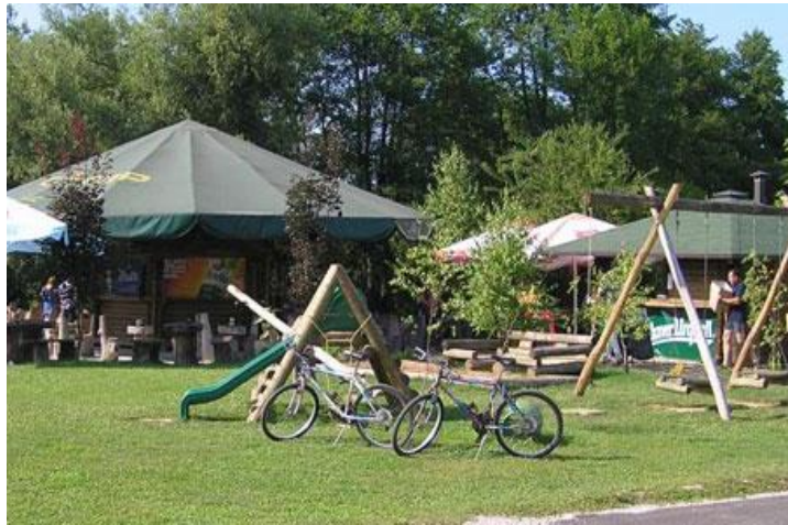
Slika 5. Kamp Slapić na rijeci Mrežnici