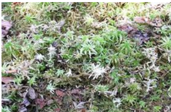
Slika 1. Cret Banski Moravci