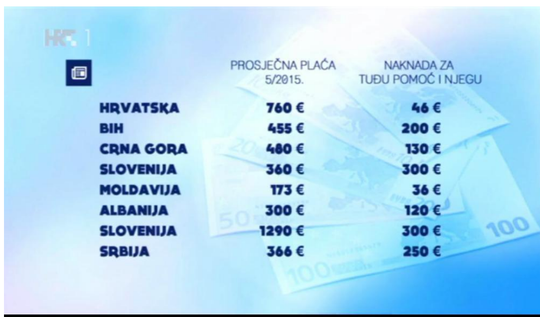
Slika 3: Prikaz inkluzivnog doplatka za slijepe osobe [3]

Jedan od velikih problema je inkluzivni doplatak. Već dvadeset godina Hrvatski Savez slijepih i temeljne udruge bore se za državnu potporu kojom bi slijepe osobe podmirile dodatne troškove prouzročene sljepoćom. RH isplaćuje najmanji inkluzivni doplatak za slijepe osobe u cijeloj Europi koji iznosi svega 46 eura (slika 3.), pa čak i susjedne zemlje kao što su BiH, Crna Gora, Srbija,...imaju veći inkluzivni doplatak za slijepe osobe [13] .