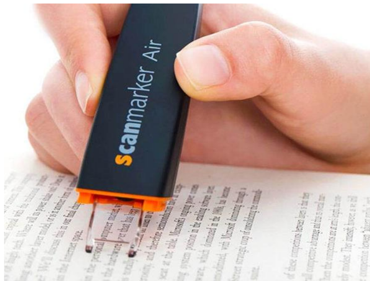
Slika 13: Olovka za čitanje ili scanmarker [13]

Digitalni marker u obliku olovke (slika13) funkcioniра na način da prevlačenjem vrha olovka preko bilo kojeg printanog teksta, uređaj odmah prebacuje tekst u bilo koji program na računalu. Ovaj uređaj je izdržljiv i lagan, ergonomski dizajniran. Njegova napredna tehnologija omogućuje brzo i izuzetno precizno prepoznavanje više jezika i istovremeno stvaranje teksta za uređivanje. Integrirana TTS (eng. text to speech ) (pretvaranje teksta u govor)- funkcija omogućuje korisniku da čuje tekst koji se čita naglas, što ga čini odličnim alatom za poboljšanje pamćenja, kao i razumijevanje skeniranog materijala [25].