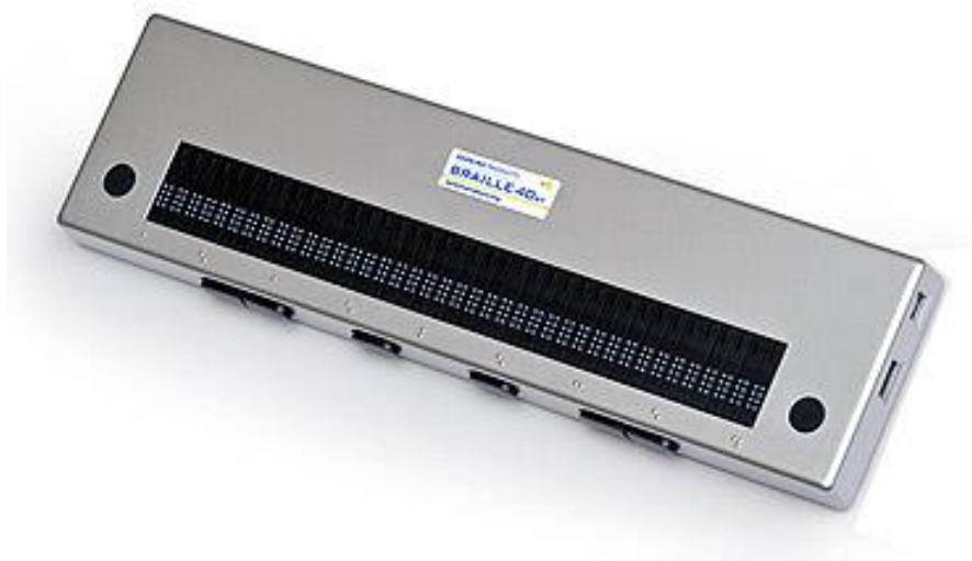
Slika 4: Brailleov redak s 40 slovnih mjesta [4]

Ovakvi uređaji korisni su iz više razloga