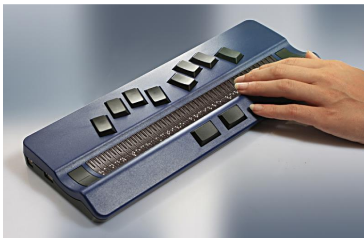
Slika 5: Brailleova elektronička bilježnica [5]

Također, moderne elektroničke bilježnice opremljene su integriranim 32-znakovnim ili 18-znakovnim brajevim retkom. Kao i brajev redak i elektroničke bilježnice koriste kompjutersku brajicu od 8 točkica. Uz pomoć Windows OS elektroničke bilježnice mogu direktno komunicirati s osobnim računalom. Tako se podaci mogu premještati s jednog uređaja na drugi, pohranjivati, obrađivati i koristiti. U nekim slučajevima povezivanjem elektroničke bilježnice i računala, bilježnica se može koristiti kao brajev redak ili sintetizator govora za tekst prikazan na ekranu računala [20]. Osim navedenih tipaka za unos brajice, ovisno o modelu i proizvođaču, neki od modela imaju i tipke za kretanje po menijima te tipke za manipulaciju brajevim retkom. Također na bilježnicama se nalaze priključci za strujno napajanje, priključak za slušalice i priključci za spajanje s osobnim računalom.