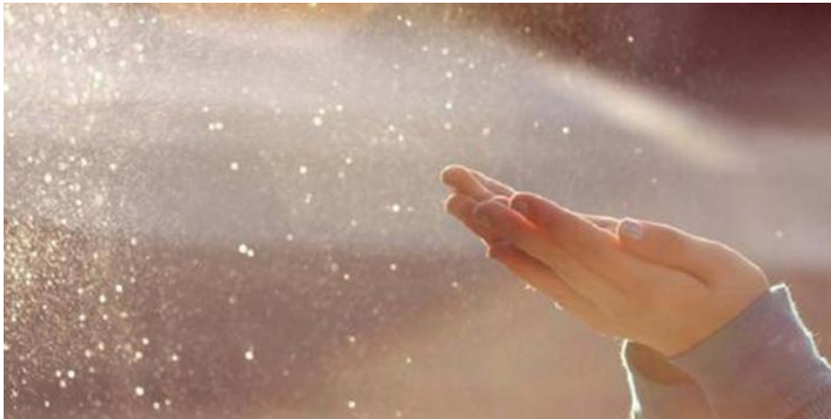
Slika 1. Prašina u zraku 1

Fine i ultramikroskopske prašine veličine su mikroba u zraku (veličina bakterija je 0,5-5 \mu\text{m} , a virusa 0,01-0,1 \mu\text{m} ). Uglavnom se mikrobi pridržavaju za čestice prašine koje su veće od 2 \mu\text{m} i za koloidne kapljice vode. Naime, čestice organskog porijekla većinom sadrže mikrobe, te raspadne produkte i toksine koje oni zatim stvaraju. Jednako kao kod vrlo štetnih plinova, najčešće jedinice za koncentraciju prašine koje se koriste u zraku su ppm i mg/m 3 . Maksimalna dopuštena koncentracija na radnom mjestu (MDK) prašine u zraku propisana je za čestice različitih tvari npr. za prašinu koja sadrži silicijev oksid, koji je posebno štetan za zdravlje. Osim o koncentraciji, štetnost prašine ovisi još o njenom sastavu i o njihovom broju. Fina i ultramikroskopska prašina štetnija je za zdravlje od grube prašine.