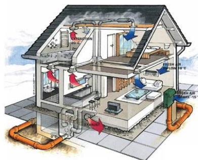
Slika 3. Ventilacija stambenog prostora 3

Zrak koji služi za djelomično ili za jedino grijanje same prostorije, ovisno o potrebi topline za grijanje, zagrijava se na temperaturu do 50°C, zaključujem dakle puno veću od temperature prostorije u kojoj boravimo. Uređaj za grijanje zraka i ventilaciju sastoji se od grijača zraka i ventilatora, a prema potrebi može imati i neke dodatne elemente. Grijanje zrakom podrazumijeva grijanje samo optočnog zraka (bez dodatka vanjskog zraka). Zagrijavanje zraka koji se jedino ili djelomično uzima iz atmosfere podrazumijevaju zračno grijanje i ventilaciju. Ono može biti direktno (na samom izvoru topline) i indirektno (pomoću radnog medija – vode ili pare). Zatim se zagrijavanje prema uzroku cirkulacije zraka dijeli na gravitacijsko i prinudno tj. pomoću ventilatora. Grijanje je individualno ili centralno ako je prema mjestu zagrijavanja zraka (zrak za grijanje više prostorija zagrijava se na jednom mjestu i razvodi kanalima). Uređaji za grijanje zrakom uključuju kalorifer i ventilokonvektor (za posredno grijanje pogona i ureda, respektivno), te termogen (s ognjištem na plin ili ulje) i središnju jedinicu za zračno grijanje. [11]