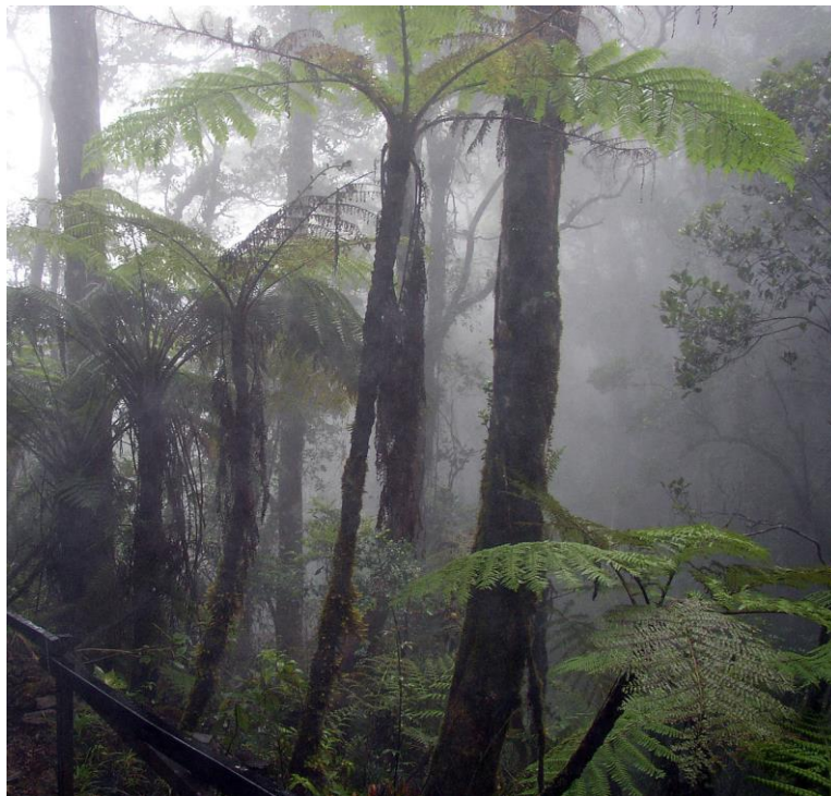
Slika 2. Vlažnost zraka 2

Za vlažni zrak kažemo da je to mješavina suhog zraka i vode (pare i kapljevine). Termodinamička svojstva suhog zraka uglavnom određuju dušik i kisik koji su sadržani u zraku, dok se preostali suhi plinovi u zraku većinom mogu zanemariti. Vlažni zrak promatra se kao mješavina od samo dvije komponente kao što sam ranije i navela – od suhog zraka i vode. Ako zamislimo da se iz nekog zatvorenog volumena pod tlakom ispunjenog vlažnim zrakom odstrani zrak, para koja je ostala raširila bi se po cijelom volumenu i poprimila (manji) tlak koji se nazivamo parcijalni tlak pare. Za ukupni tlak vlažnog zraka vrijedi p = p_z + p_p , pri čemu je p_z označen parcijalni tlak suhog zraka. [5]