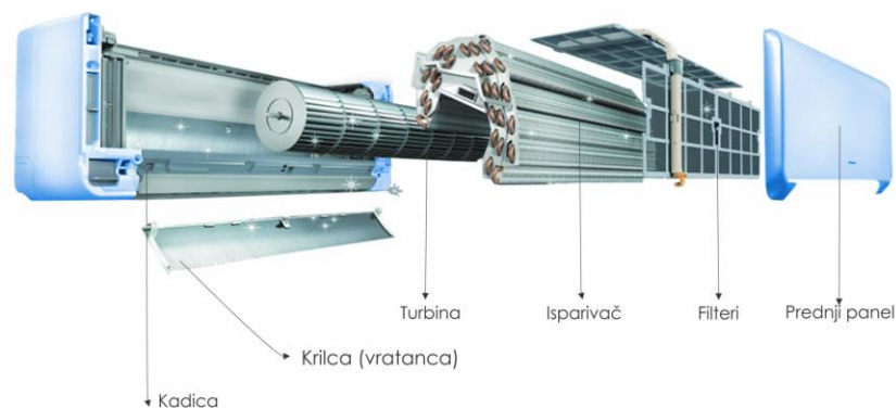
Slika 5. Dijelovi uređaja za klimatizaciju 5