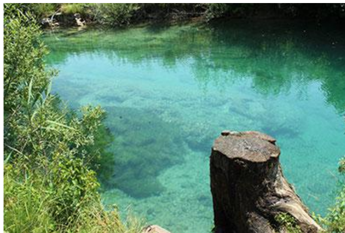
Slika 2 Rijeka Korana, Selo Korana

Na rijeci Korani nalazi se nekoliko većih kupališta: gradsko kupalište u Slunju, gradsko kupalište u Karlovcu (Foginovo), kupalište Korana u Selu Korana te kupalište u Bariloviću. Uz navedena kupališta postoje još i mnoga druga, malo skrivenija. Prosječna temperatura rijeke Korane koja je još u 19. stoljeću potvrdila svoju ljekovitost, u ljeti iznosi 24 °C. Najljepšu boju i najbistriji tok moguće je vidjeti u Selu Korana gdje su svaka ribica i svaki kamenčić vidljivi potpuno jasno, a kupalištima je moguće pronaći i dodatne sportske sadržaje kao što su boćanje, odbojka na pijesku ili vježbanje na spravama.