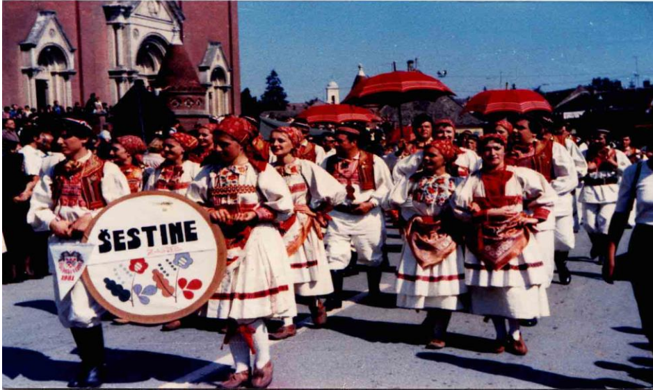
Slika 4: Šestinska narodna nošnja