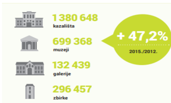
Slika 1: Prikaz posjećenosti kulturnim resursima 2015./2012.