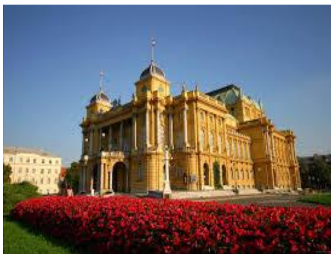
Slika 4: Hrvatsko narodno kazalište