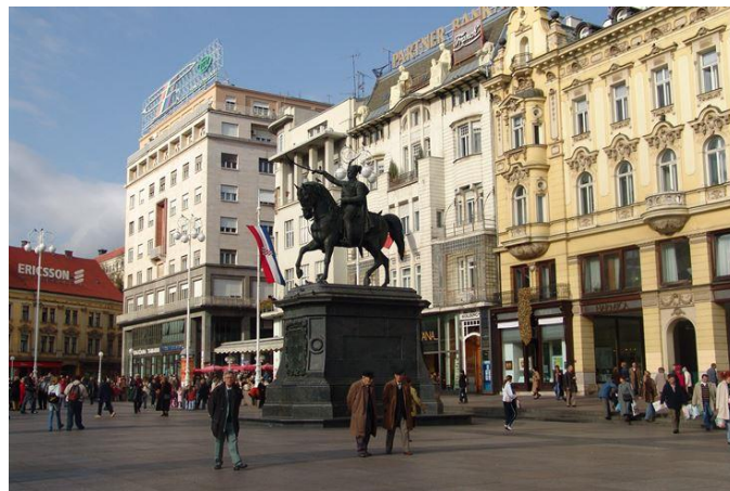
Slika 5: Trg bana Josipa Jelačića