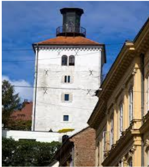
Slika 3: Kula Lotroščak