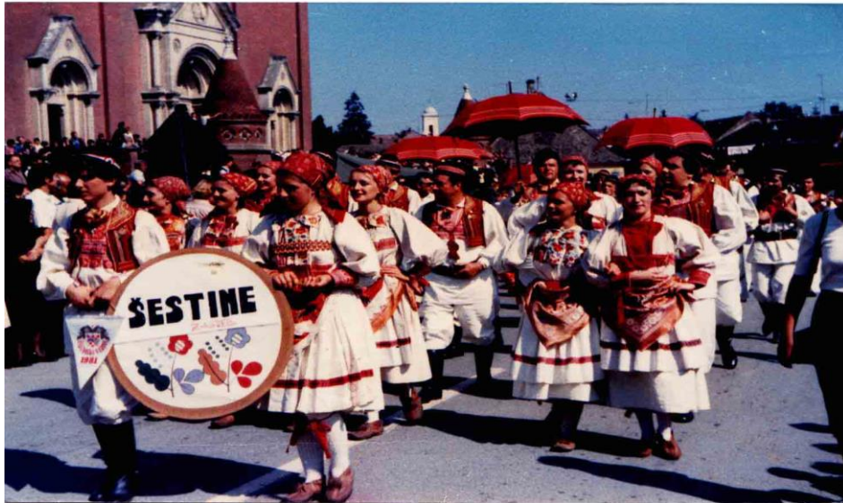
Slika 4: Šestinska narodna nošnja