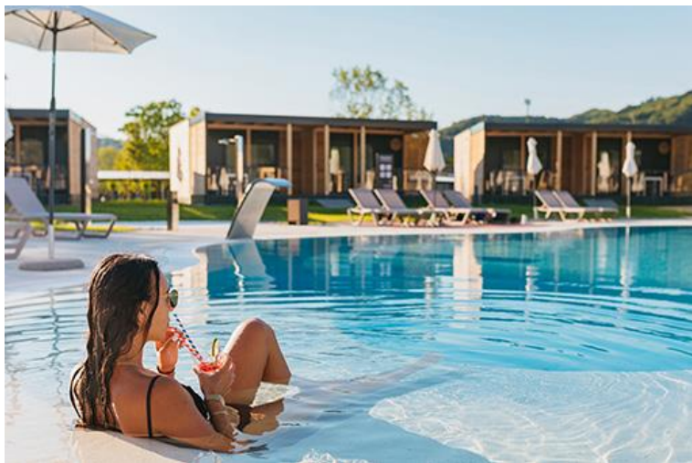
Slika 8. Glamping Village Terme Tuhelj