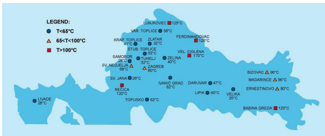
Geografska karta 2. Geotermalni potencijal Hrvatske

Hrvatska raspolaže sa velikim brojem termi i lječilišnih mjesta sa 103 izvora prirodne mineralne vode te se nalazi u samom vrhu UNESCO-ova popisa bogatstva vode u Europi ali i svijetu. U Hrvatskoj postoji duga tradicija korištenja geotermalne energije uglavnom u balneološke svrhe. Većina najpoznatijih hrvatskih termi i lječilišta nalazi se upravo u središnjoj Hrvatskoj, a neka od njih se po kvaliteti mineralne vode ubrajaju u prvih deset u Europi. Po kvaliteti termalne vode u Topuskom zauzimaju treće, a u Krapinskim Toplicama šesto mjesto u Europi.