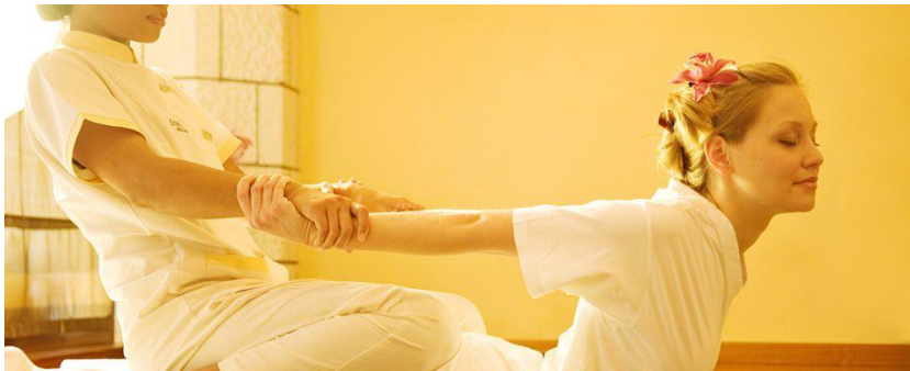
Slika 15. Tajlandska masaža