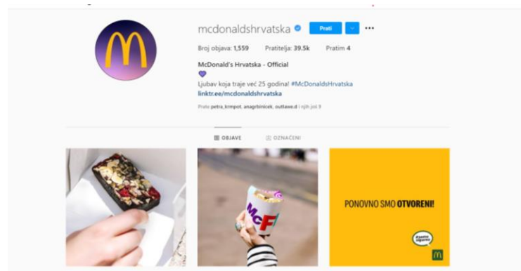
Slika 8. McDonald's društvene mreže - Instagram