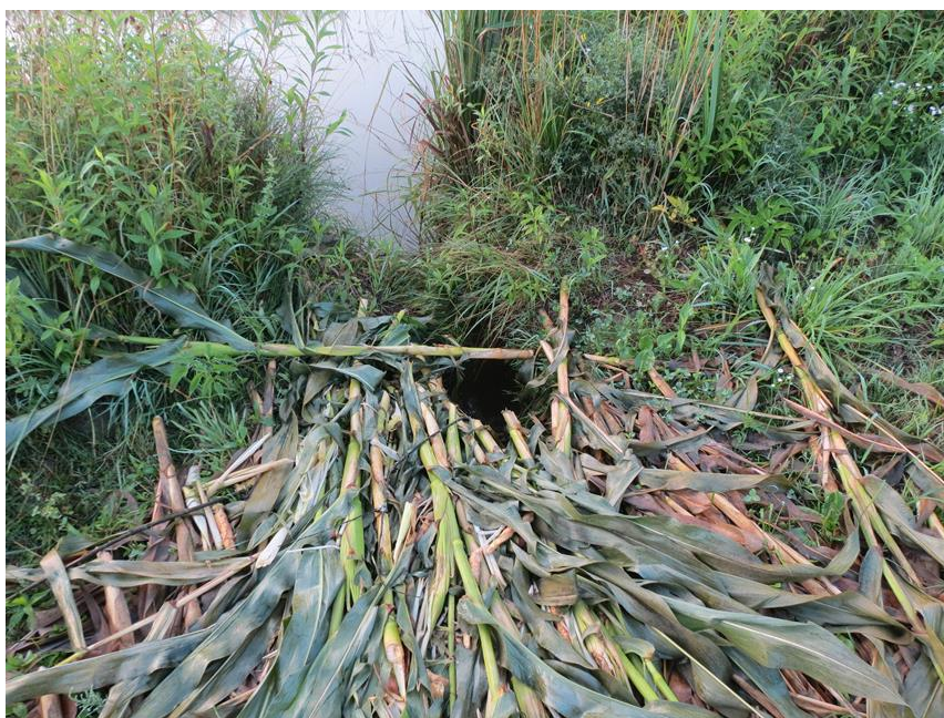
Slika 17 Odvlačenje stabljika kukuruza do ulaznog jarka uz vodotok