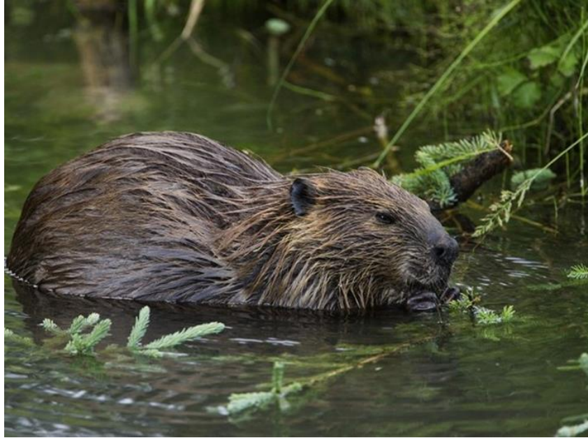
Slika 3 Euroazijski dabar u vodi

Dabar može plivati brzinom od 4-10km/h, a pod vodom može izdržati između 15-20 minuta. Cijelo tijelo mu je prekriveno dlakom, dok mu je rep ljuskav. Dlaka mu je tamnosmeđe-sivkasta. Duže dlake na vanjskom dijelu tijela naziva se osje, dok se ispod nje nalazi vrlo sitne dlake koje se nazivaju malje. Dabar ima vrlo specifične sjekutiće (glodnjake), veliki su i rastu mu cijelog života. S prednje strane su presvučeni narančastom caklinom, a s unutarnje strane se nalazi bijeli dentin. Zubi mu služe za hranjenje, čišćenje krzna, obaranje stabala, nošenje grana i prenošenje mladih. Ima ukupno 20 zubi ( 2004.). Zubna formula je 1-0-1-3/1-0-1-3 (PIECHOCKI, 1989.).