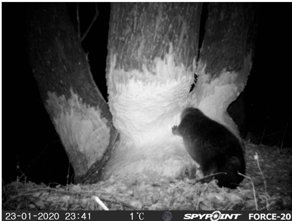
Slika 8 Dabar nagriza stabla vrbe