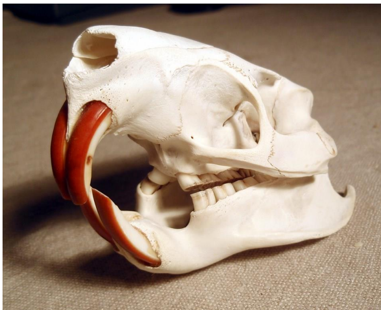
Slika 4 Lubanja dabra s dobro izraženim sjekutićima