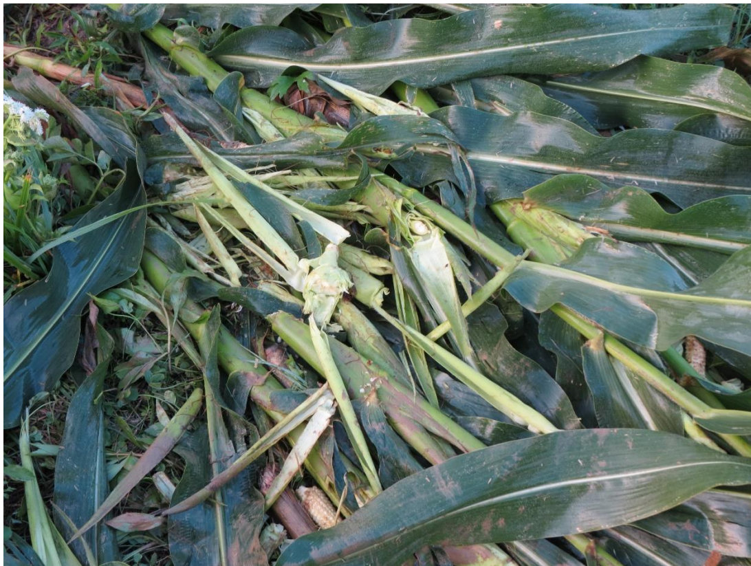
Slika 16 Šteta na usjevu kukuruza nakon hranjena dabrova

procijenjena brojnost od 3 familije sa prosjekom od 5 jedinki po familiji što daje brojnost od minimalno 15 jedinki na vodotoku. Gustoća populacije na vodotoku je procijenjena na gotovo 6 i pol jedinki na 1 kilometar vodotoka.