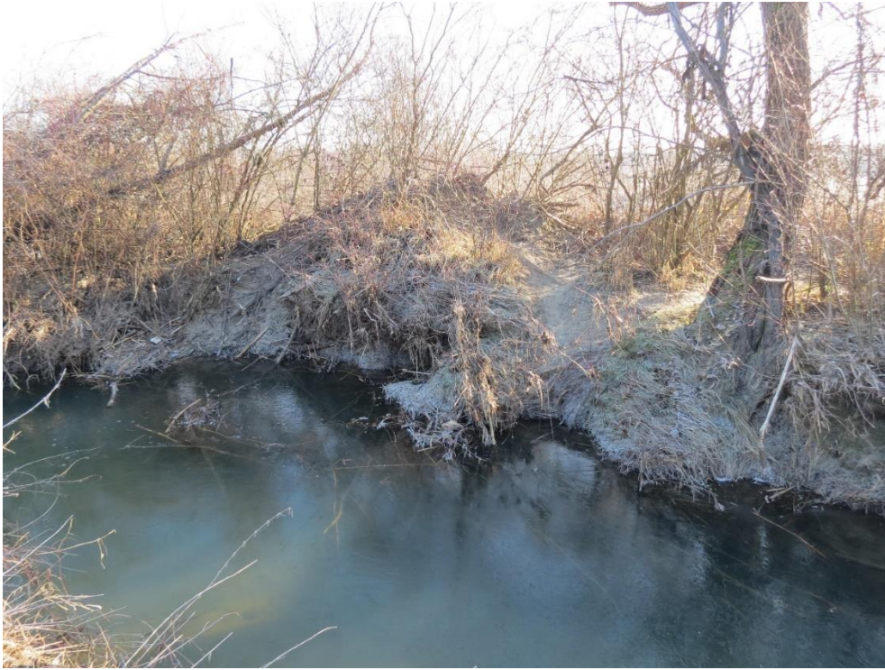
Slika 18 Dabrova nadzemna nastamba uz vodotok