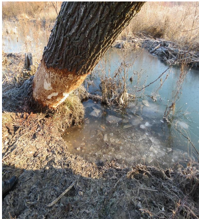
Slika 6 Tragovi glodanja kore s drveta

Ukoliko na nekom području dabar obitava, najsigurniji znak prisutnosti jesu dabrove nastambe koje mogu biti iznad zemlje (humci) i ispod zemlje (jame).