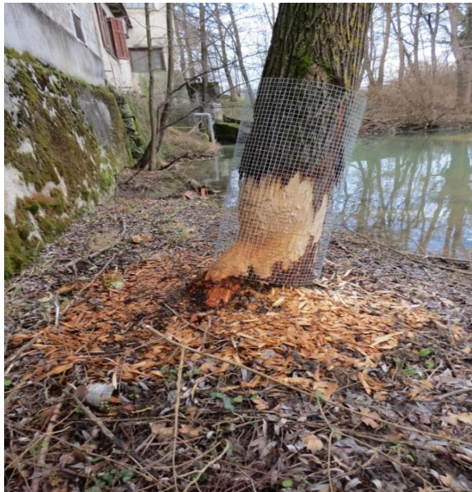
Slika 11 Pojedinačno ograđivanje stabala žičanom ogradom u svrhu sprečavanja nastanka šteta od dabra

Evidentirano je da izlazi na poljoprivredne površine pod kukuruzom ( Zea mays ) i ječmom ( Hordeum vulgare ). U centru mjesta Volavje dabar je nagrizaو stabla johe ( Alnus glutinosa ) neposredno uz napuštenu zgradu starog mlina te su ljudi poduzeli mjere sprečavanja nastanka šteta od dabra (slika) pojedinačnim ograđivanjem stabala žicom. Pozitivan utjecaj dabra se očituje pregradnjom vodotoka branama na tom dijelu vodotoka jer se znatno usporio protok vode i stvorilo dobro stanište za neke druge divlje vrste poput divljih pataka ( Anas platyrhynchos ) i vidre ( Lutra lutra ). Patkama sporiji protok vode pogoduje prilikom gniježđenja i hranjenja, a vidri prilikom lova jer je u mirnijoj vodi bolja preglednost i manji je napor potreban da bi uhvatila ribu. Ispod brana, gdje se voda prelijeva iz gornjeg dijela brane dalje u vodotok, se stvara puno kisika u vodi i to pogoduje ribama jer je tu mnoštvo algi kojima se neke vrste hrane. Na branama se voda postupno filtrira kroz granje i lišće i nakupine sedimenta odnosno mulja te se na tom dijelu razvija mnogo bakterijskih vrsta koje razgrađuju lišće, koru i ostatke drvenaste vegetacije koju dabar nanese u vodotok i stvaraju sediment na dnu vodotoka u kojem žive određene vrste beskralježnjaka kojima se hrane neke od vrsta riba koje obitavaju u vodotoku. Procijenjenu brojnosti familija na tom vodotoku nije moguće utvrditi jer se ne zna točan broj nastambi da bi se znala točna brojnost familija dabrova koji obitavaju na vodotoku.