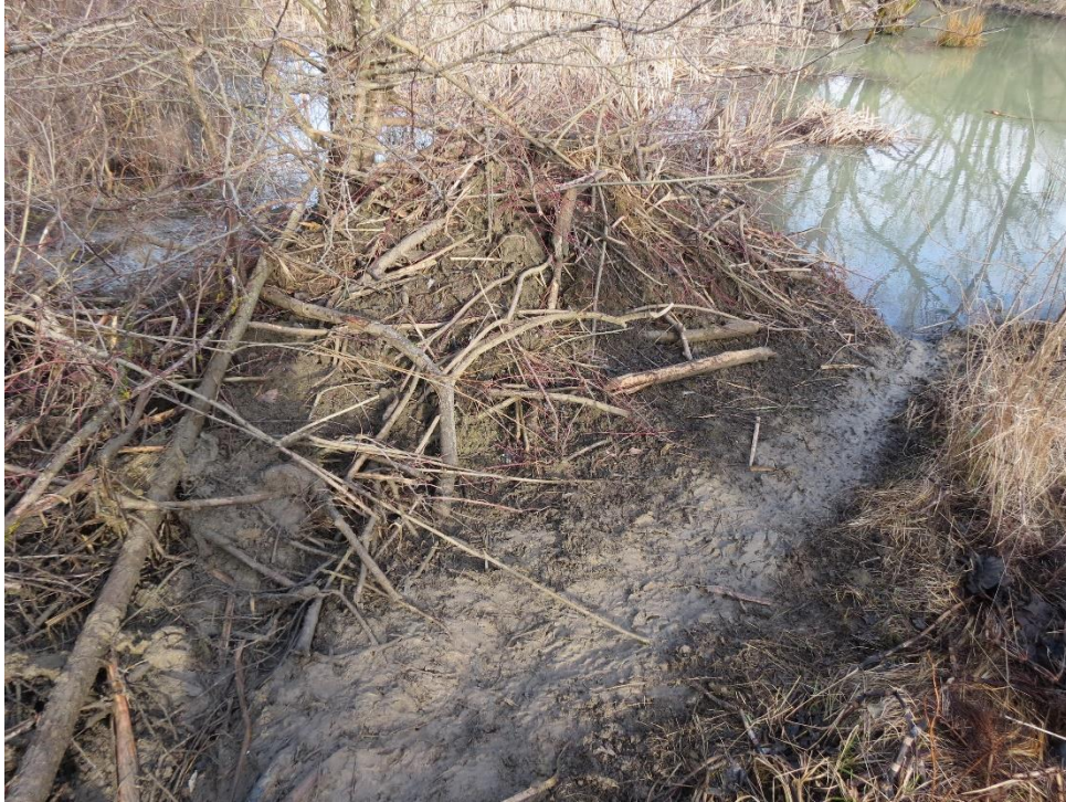
Slika 7 Izlazni jarak na obali vodotoka