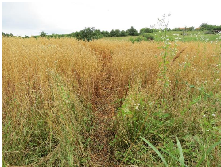
Slika 12 Šteta nastala hranjenjem dabra na zobi