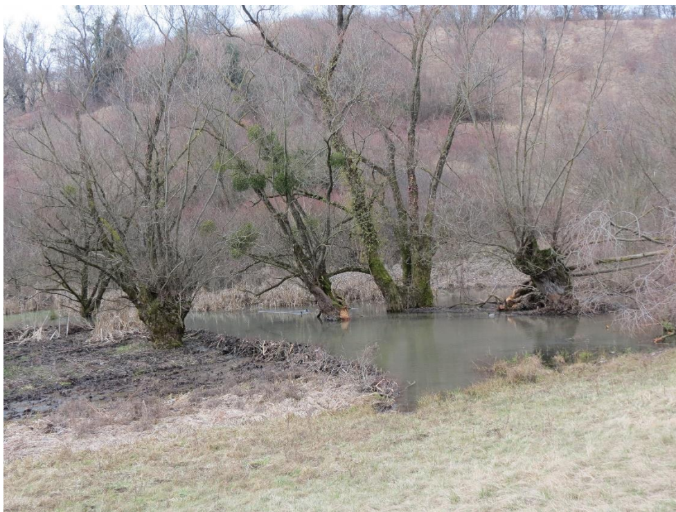
Slika 5 Stanište dabra