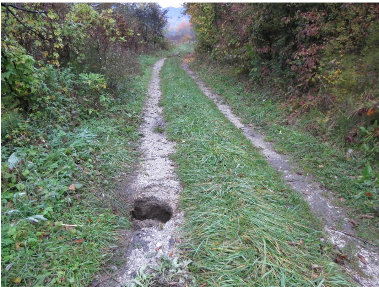
Slika 15 Rupa na kolotečini nastala dabrovim potkopavanjem ispod poljskog puta

Treći vodotok na kojem je provedeno istraživanje je „Reka“. Vodotok je smješten u južnom središnjem dijelu lovišta. Duljina vodotoka na kojoj je proveden projekt je 2,33 km od mjesta Draga Svetojanska do Bukovca nedaleko tvornice „Jana“ gdje cesta prelazi preko vodotoka. Prosječna širina vodotoka na tom dijelu iznosi 1,5 m, a prosječna dubina je 20-ak cm. Dubina vode između brana koje je izgradio dabar doseže visinu do 1 m. Dubina vode proporcionalna je količini padalina te varira kroz godinu. Područje oko vodotoka bogato je drvenastom vegetacijom od kojih su najčešće vrste: Uz vodotok raste drvenasta vegetacija od kojih su najčešće vrste: vrba ( Salix L. ), topola ( Populus tremula ), crna joha ( Alnus glutinosa ), bijela joha ( Alnus incana ), svibovina ( Cornus sanguinea ), trnina ( Prunus spinosa ), jabuka ( Malus domestica ), šljiva ( Prunus domestica ), divlja kruška ( Pyrus Pyraeaster ) grab ( Carpinus betulus ), hrast ( Quercus robur )... Obala vodotoka je gotovo cijelom dužinom zarasla u šikaru te je u jednom dijelu jedva prohodna. To predstavlja dobar zaklon za mnogobrojne vrste divljači i kvalitetnu ishranu za brst i ogriz kojim se često hrane srne. Tokom obilaska vodotoka