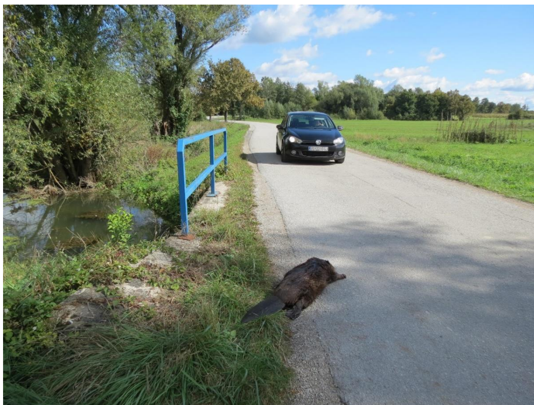
Slika 9 Dabar stradao u prometu

klimatskim čimbenicima, parazitima, bolestima i predatorima, kao i prirodnim čimbenicima. Mladunčad dabrova često strada u razdoblju proljeća za vrijeme poplava. Kao najučestaliji čimbenik stradavanja dabrova očituje se promet zbog gustoće naseljenosti i gustoće prometnica na području dabrove rasprostranjenosti.