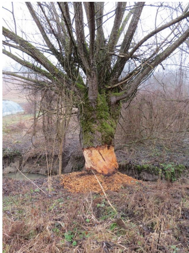
Slika 14 Nagrižena vrba promjera 109 cm

3 m. Prosječna dubina vodotoka je svega 20 cm iznimno na branama gdje dosiže visinu i preko 1,5 metar. I na tom vodotoku dubina vode varira tijekom godine zbog različitosti u količini padalina. Stanište tog područja obiluje drvenastom vegetacijom od kojih su najčešće vrste: vrbe ( Salix , L.), topola ( Populus tremula ), crna joha ( Alnus glutinosa ), bijela joha ( Alnus incana ), klen ( Acer campestre ), divlja trešnja ( Prunus avium ), kruška ( Pyrus sp. ), jabuka ( Malus domestica ), šljiva ( Prunus domestica ). Na tom potezu dosta zemljišta je zapušteno i uz šumsku vegetaciju razvilo se dosta šikara koje pružaju dobar zaklon divljim vrstama i obilje hrane za vrste koje vole brst i ogriz poput srneće divljači. Prilikom obilaska vodotoka zabilježene su 4 velike nadzemne nastambe i još nekoliko podzemnih koje nije moguće prebrojiti. Na vodotoku je izgrađeno 40-ak brana različitih veličina od svega 1 m pa sve do 52 m dužine. Debljina stabala koje nagriža se kreće između 5 i 30 cm, ali je zabilježeno i nagrižanje vrbe ( Salix , L.), prsnog promjera 109 cm.