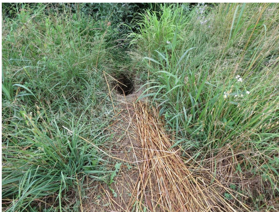
Slika 13 Odvlačenje stabljika do rupe uz vodotok

Sljedeći vodotok na kojem je provedeno istraživanje jest vodotok Malunjčica. Vodotok je smješten uz istočnu granicu lovišta između mjesta Prodindol i Volavje, a prolazi kroz mjesta Malunje i Hrastje Plešivičko gdje se odvaja od granice i prolazi prema jugu sredinom lovišta. Obiđena dužina vodotoka bila je 8,5 km od Prodindola, sve do Volavja gdje ju poljski put presijeca. Prosječna širina vodotoka iznosi 1,5 m, osim na branama gdje širina vodotoka prelazi