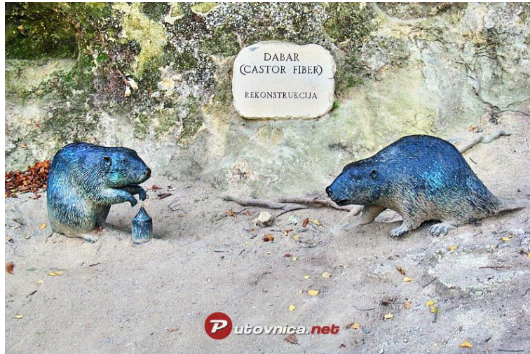
Slika 1 Statue dabra na arheološkom lokalitetu Hušnjakovo nedaleko Krapine

Najstariji kostur dabra na području Republike Hrvatske pronađen je na arheološkom lokalitetu Hušnjakovo nedaleko Krapine. Smatra se da je kostur iz razdoblja pleistocena, što znači da je dabar obitavao na prostoru Hrvatske između 2,5 milijuna i 11 500 godina, pa sve do danas (GRUBEŠIĆ, 2008.).