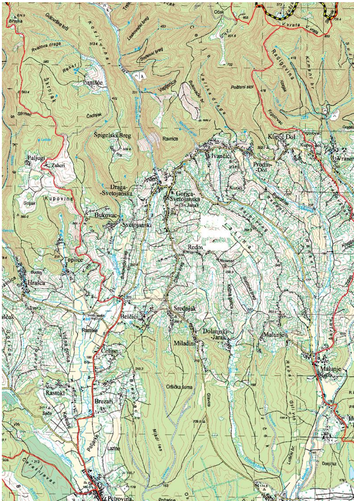
Slika 10 Karta lovišta I/118 "Sveta Jana"