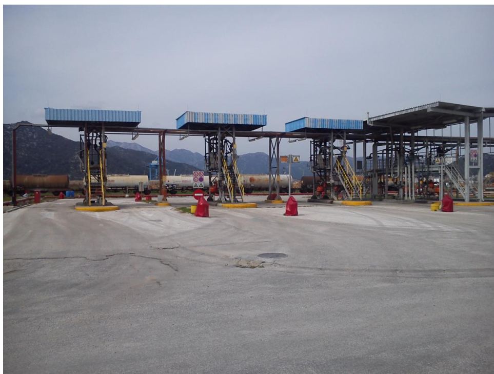
Slika 8. Punilište autocisterni

Lokacija autopunilišta nalazi se u blizini glavnog ulaza u terminal čime je maksimalno ograničen put kretanja autocisterni područjem postrojenja. Autopunilište je natkriveno čeličnom konstrukcijom koja nosi limeni pokrov. Punilište se sastoji od tri otoka za gornje punjenje cisterni te jednog otoka za gornje i donje punjenje. Punjenje cisterni omogućeno je sa obje strane otoka tako da je moguće istovremeno punjenje 7 autocisterni.