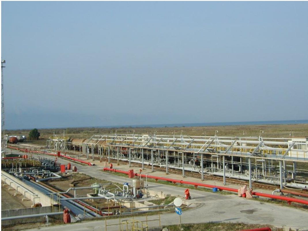
Slika 9. Pretakalište vagoncisterni

Pretakalište vagoncisterni locirano je uzduž sjeverne strane prostora sa spremnicima prema ogradi postrojenja. Punilište vagon cisterni nalazi se na dva kolosijeka sa osam utakačkih ruku kapaciteta 960 m 3 /sat. Površine pretakališta su betonirane.