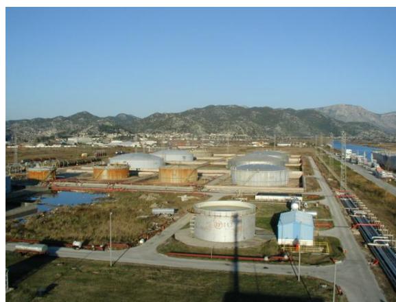
Slika 6. Spremnici izbliza – NTF d.o.o. Ploče, Skladište za tekuće terete u Luci Ploče.