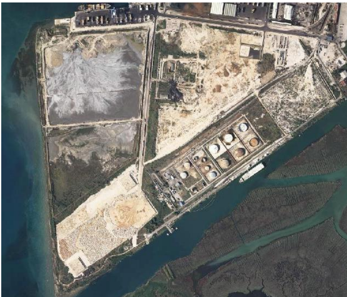
Slika 2. Mikrolokacija Skladišta za tekuće terete u Luci ploče u vlasništvu tvrtke NTF d.o.o..

Skladište za tekuće terete nalazi se u jugozapadnom dijelu industrijske zone grada i prostire se u smjeru sjeveroistok-jugozapad. Područje terminala zauzima površinu od 158 400m 2 (660 x 240 m). Skladišni prostor pruža se paralelno s desnom obalom kanala jezero Vlačka – Jadransko more. Na jugozapadnoj strani je cestovni prilaz Terminalu iz kontroliranog područja Luke, a željeznički kolosijek koji vodi do vagon pretakališta ulazi u područje Terminala sa sjeveroistočne strane i slijepo završava. Istočno od ograde Terminala nalazi se brodsko pretakalište.