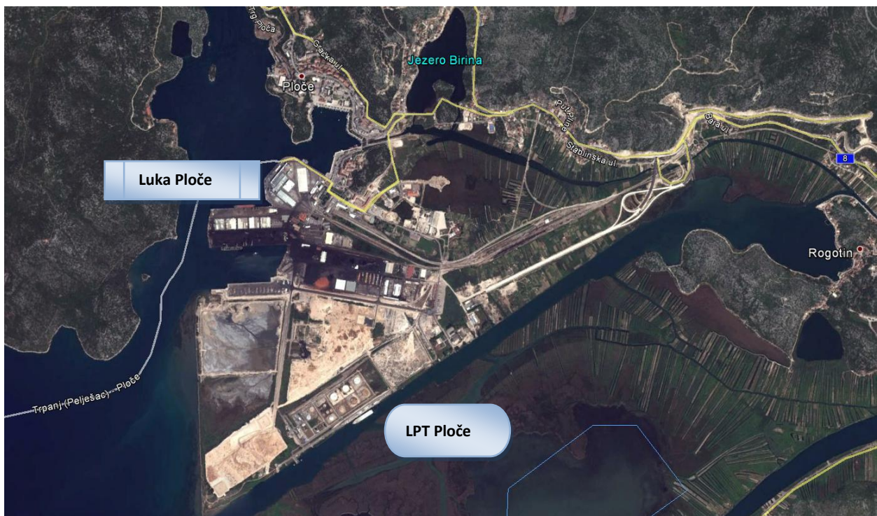
Slika 4. Tvrtke i javni objekti u okruženju lokacije postrojenja.

U neposrednoj blizini postrojenja tvrtke Naftni terminali Federacije d.o.o. Ploče, Skladište tekućih tereta u Luci Ploče nalaze se susjedna postrojenja koja mogu predstavljati opasnost od velikih nesreća te domino efekta za cijelo područje grada Ploče. U samom susjedstvu nalazi se Luka Ploče te tvrtka Luka Ploče-Trgovina d.o.o. koja se bavi manipulacijom naftnih derivata i jestivim uljem preko terminala tekućih tereta.