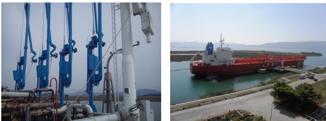
Slika 7. Pretakalište brodova i zglobni utakači.