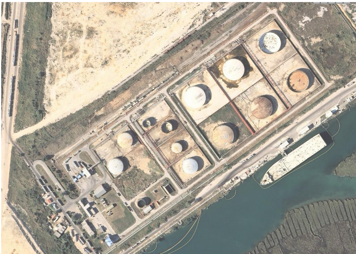
Slika 5. Spremnici – NTF d.o.o. Ploče, Skladište za tekuće terete u Luci Ploče.