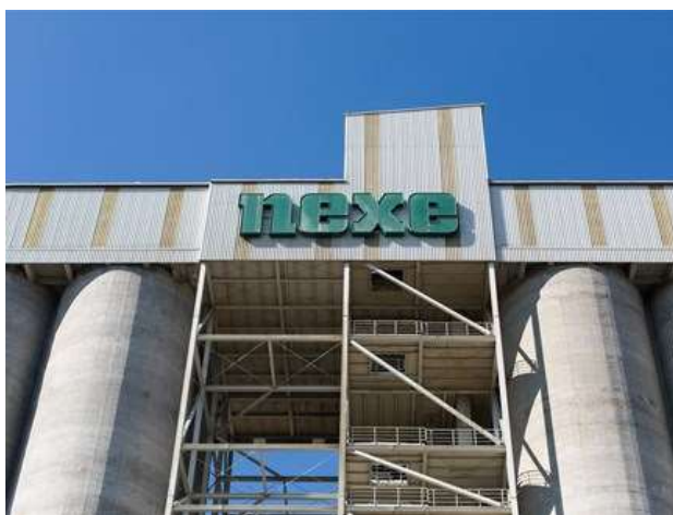
Slika 4. Nexe grupa – regionalni proizvođač građevinskog materijala

Nexe d.d. sa sjedištem u Našicama, vodeći je proizvođač i prijevoznik svježeg betona u Hrvatskoj (slika 4). Društvo ima 440 zaposlenih i posluje na sedam lokacija unutar zemlje. Dio je grupacije Nexe grupacija d.d. poslovni je subjekt sa 16 tvrtki koje posluju u Hrvatskoj, Srbiji i Bosni i Hercegovini.