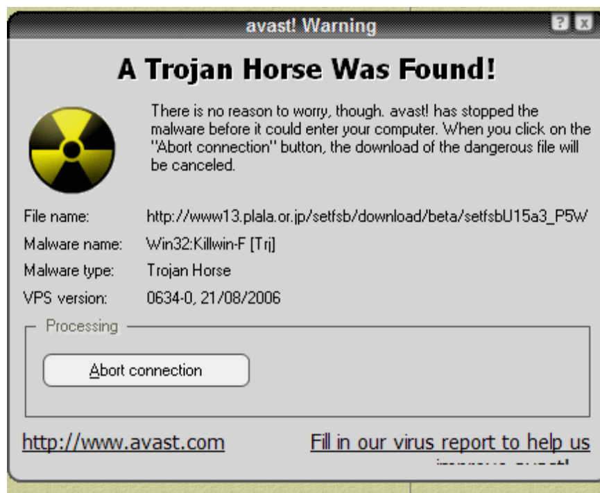
Slika 2. Upozorenje o pronalasku trojanskog konja na računalu [9]

Na slici 2. je prikazana poruka koja se može pojaviti u slučaju pronalaska trojanskog konja na računalu preko antivirusnog programa. Antivirusni programi mogu predstavljati vrlo važan alat u pronalasku i eliminaciji potencijalno sumnjivih programa.