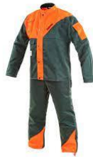
Slika 28. Radno odijelo [18]