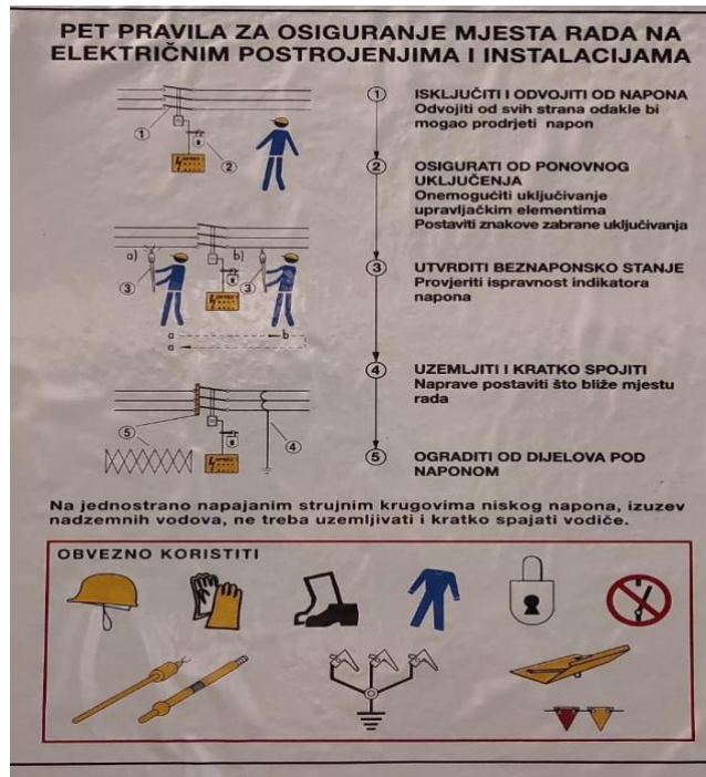
Slika 7. Pet pravila za osiguranje mjesta rada na električnim postrojenjima i instalacijama [9]

Nakon što su radovi završeni postrojenje se smije staviti natrag u pogon tek nakon podnošenja obavijesti o završetku radova.