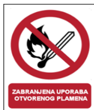
Slika 37. Zabranjena uporaba otvorenog plamena [24]

Primjeri znakova zabrane u ispravljačkoj stanici: