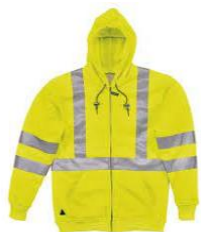
Slika 34. Upozoravajuća jakna za kišu uočljiva s velike udaljenosti [19]