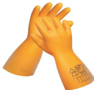
Slika 14. Elektro izolacijske gumene rukavice [16]