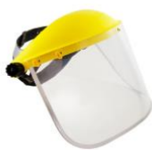
Slika 25. Štitnik za oči i lice [14]