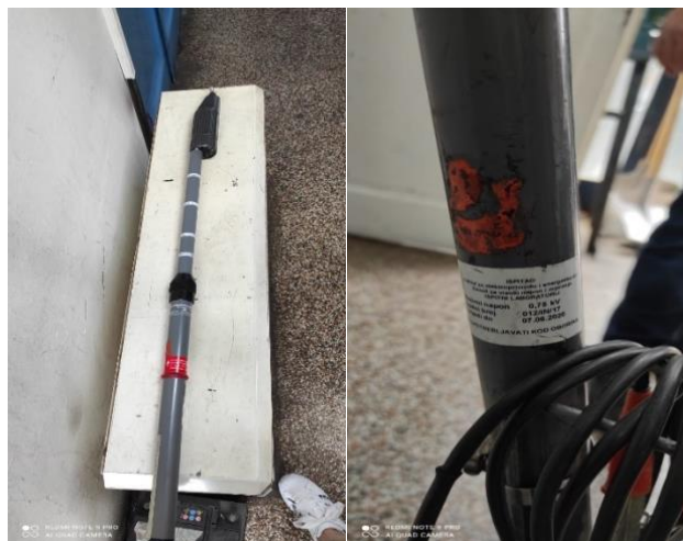
Slika 23. i 24. Detektor napona 6 – 690 V [9]