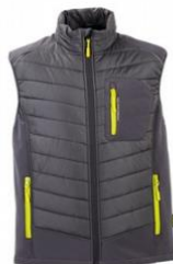
Slika 16. Radni prsluk za zaštitu od hladnoće [18]