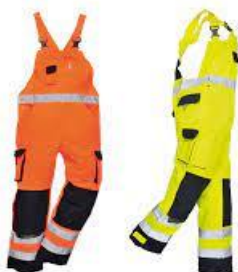
Slika 35. Upozoravajuće hlače s naramenicama uočljive s velike udaljenosti [19]