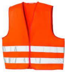
Slika 18. Upozoravajući prsluk uočljiv s velike udaljenosti [19]