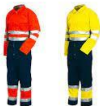
Slika 33. Upozoravajući kombinezon za zaštitu od hladnoće uočljiv s velike udaljenosti [19]