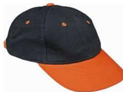
Slika 13. Radna kapa [15]