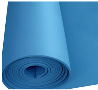
Slika 19. Elektro izolacijska prostirka [20]