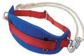
Slika 36. Sigurnosni pojas s užetom [23]