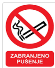
Slika 38. Zabranjeno pušenje [24]

Primjeri znakova opasnosti u ispravljačkoj stanici: