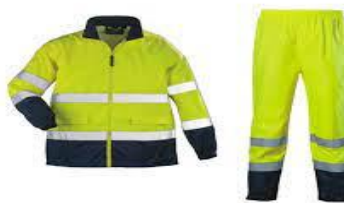
Slika 31. Upozoravajuće odijelo uočljivo s velike udaljenosti [19]