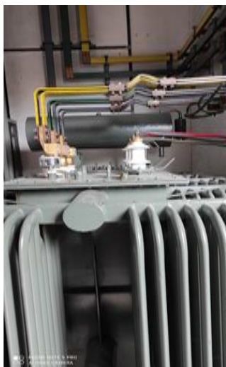
Slika 1. Transformator [9]

Ispravljač je električni sklop koji služi za pretvaranje izmjenične struje u istosmjernu. (slika 2.)