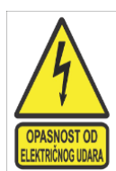
Slika 39. Opasnost od električnog udara [24]

Primjeri znakova opasnosti u ispravljačkoj stanici: