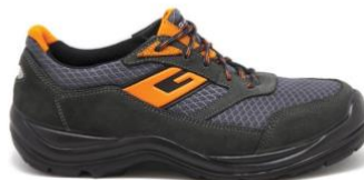
Slika 15. Električarske radne cipele [17]