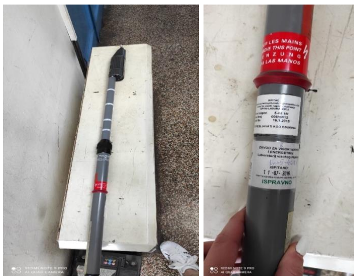
Slika 21. i 22. Detektor napona 20 kV [9]