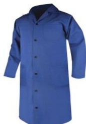
Slika 17. Radni ogrtač (kuta) [18]