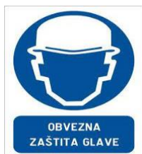
Slika 43. Obvezna zaštita glave [14]

Primjeri znakova obaveze u ispravljačkoj stanici