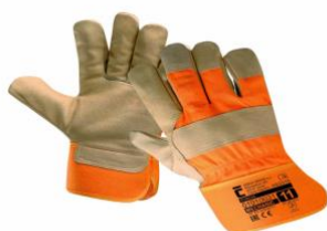
Slika 26. Zaštitne rukavice od mehaničkih opasnosti – kratke [22]