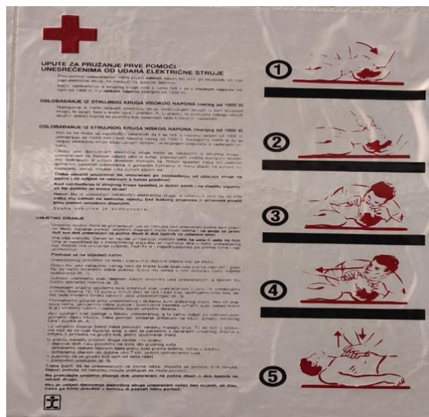
Slika 5. Upute prve pomoći [9]