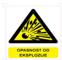
Slika 40. Opasnost od eksplozije [24]

Primjeri znakova informacija u ispravljačkoj stanici