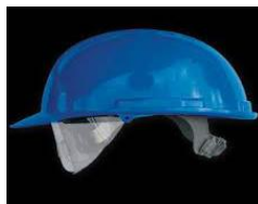
Slika 12. Industrijska zaštitna kaciga za električare [14]