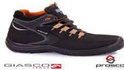
Slika 30. Zaštitne cipele električarske – visoke [17]