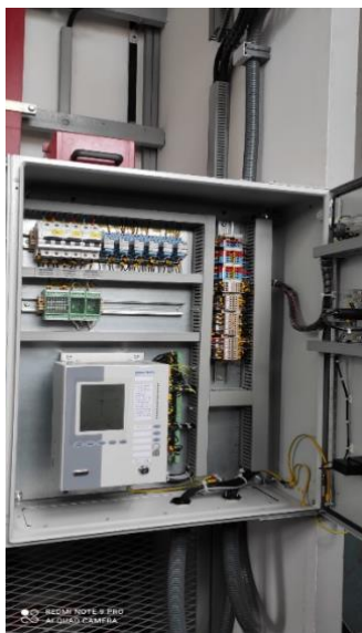
Slika 3. Razvodna kutija s prekidačima [9]

Rastavljač je mehanički rasklopni aparat koji služi za vidljivo odvajanje dijela postrojenja koji nije pod naponom od dijela postrojenja koji je pod naponom.