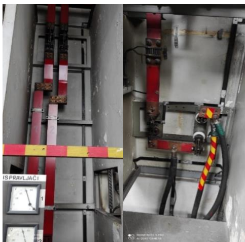
Slika 2. Ispravljač [9]

Ispravljač je električni sklop koji služi za pretvaranje izmjenične struje u istosmjernu. (slika 2.)