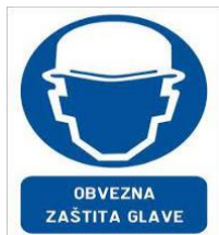
Slika 43. Obavezna zaštita glave [14]

Primjeri znakova obaveze u ispravljačkoj stanici