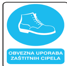
Slika 44. Obavezna uporaba zaštitnih cipela [24]