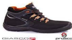
Slika 30. Zaštitne cipele električarske – visoke [17]