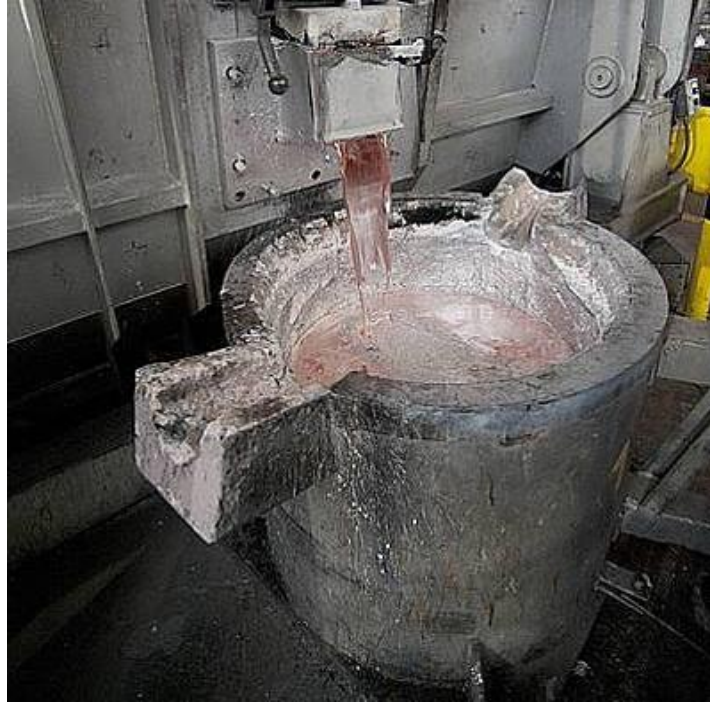
Sl.2. Lijevanje tekućeg metala u kalup [8]