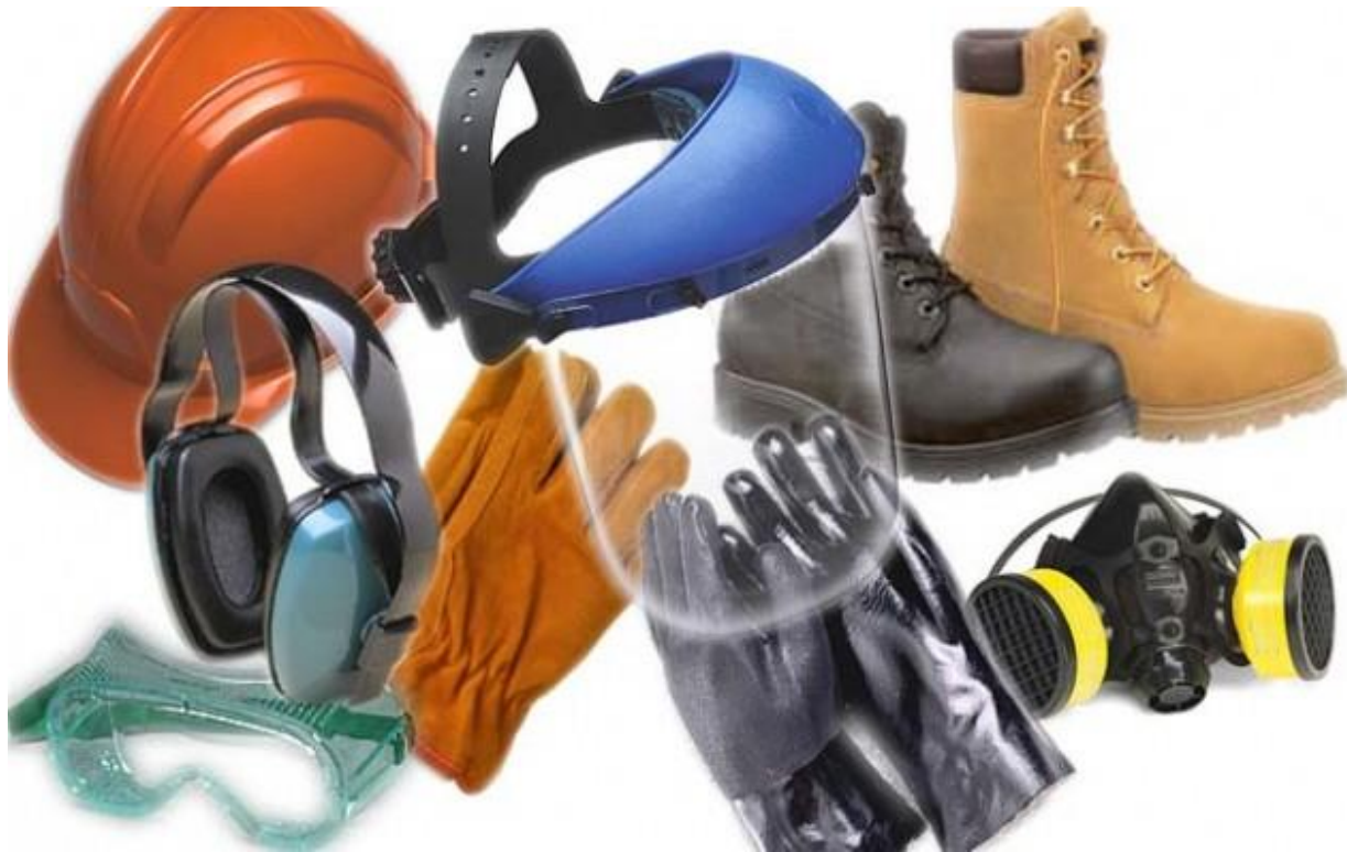
Sl.7. Osobna zaštitna oprema [9]

Iz priloženog se može vidjeti da je za svako radno mjesto i vrstu djelatnosti u LTH metalni lijev, pripisana nužna zaštitna oprema zbog mogućih rizika ozlijeda.