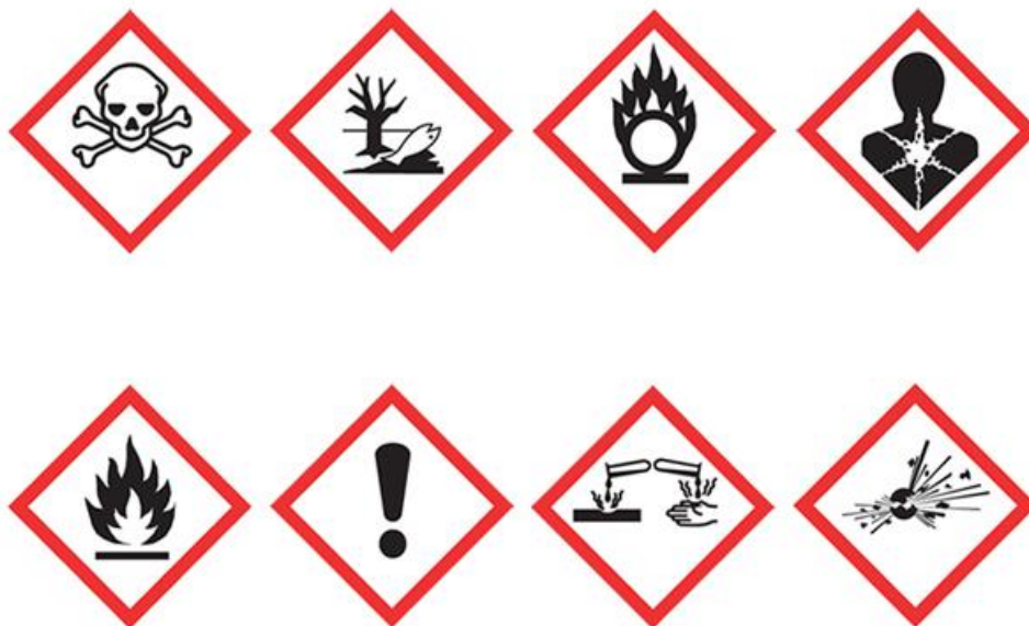
Sl.8. Znakovi opasnosti

U tvrtci LTH metalni lijev u Benkovcu postoje izvori fizikalnih i kemijskih štetnosti. Radnici koji rukuju s opasnim tvarima posebno su školovani te stručno osposobljeni za rad na takav način. Također osigurana im je sva pomoćna i zaštitna sredstva koja služi za rad sa kemikalijama, te su ih dužni nositi. Opasne tvari kojima se služe tj koriste za odrađivanje takvih vrsta poslova, posebno se skladište po naputcima proizvođača samih kemikalija i štetnih tvari. Moguće opasnosti te štetnosti od samih kemikalija mogu se manifestirati kroz razna kožna oboljenja što se tiče radnika koji rukuju s tom vrstom sredstva rada. Zbog svojih izrazito agresivnih svojstava djeluju i korozivno na radnu okolinu, zbog toga i samo rukovanje njima mora biti izrazito pažljivo. Kemijske opasnosti kao takve nisu jedina opasnost ili štetnost po radnika ili njegovu okolinu. Postoje izvori povećane buke u postrojenju, zbog rada silnih strojeva dolazi do zagađivanja zraka te povećanja temperature radne okoline zbog samih. U postrojenju su se pobrinuli da sve mane uklone ili smanje na najmanju moguću te prihvatljivu razinu. Napomena je da ne dolazi do nikakvih štetnosti po okolinu, kako za radno okruženje tako i van granica samog postrojenja.