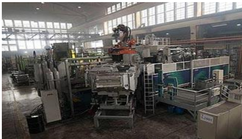
Sl.5. Pogon u Benkovac [8]