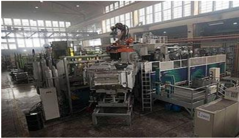
Sl.5. Pogon u Benkovac [8]