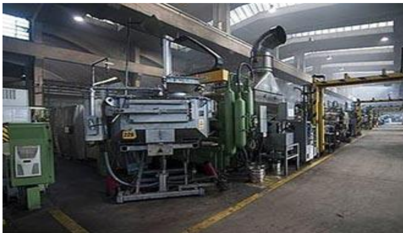
Sl.6. Pogon u Benkovcu [8]