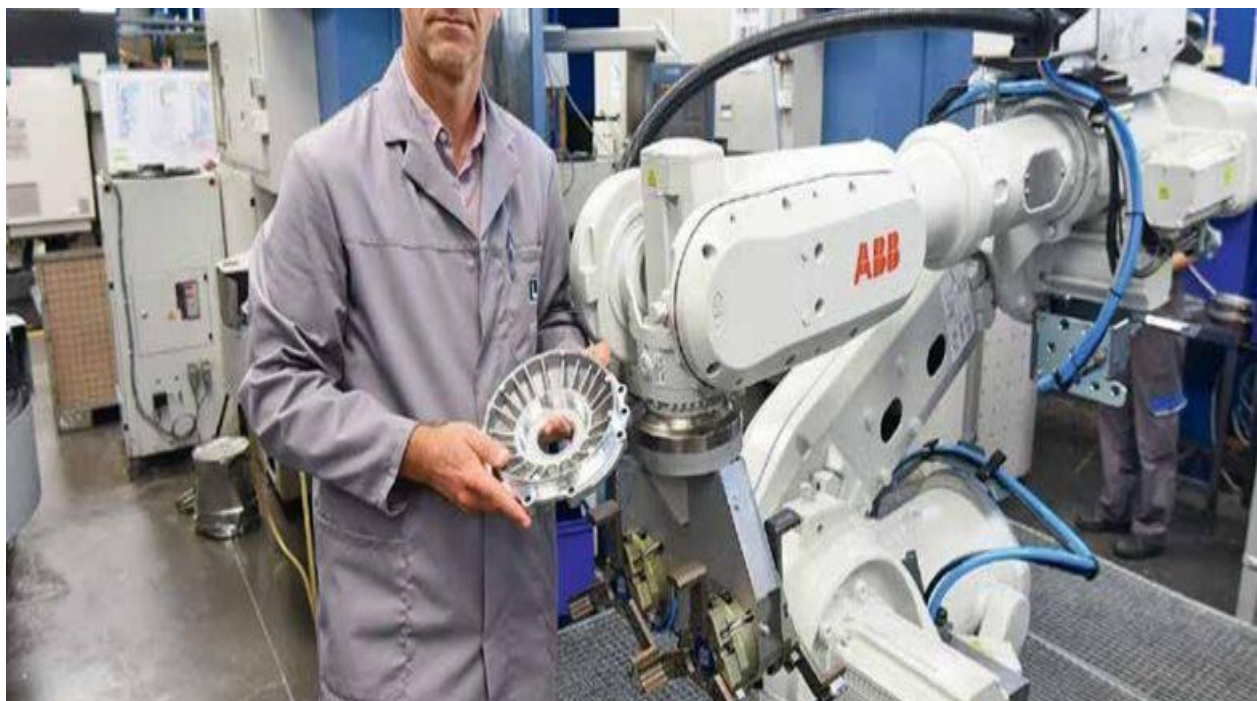
Sl.3. Primjer strojne obrade [7]