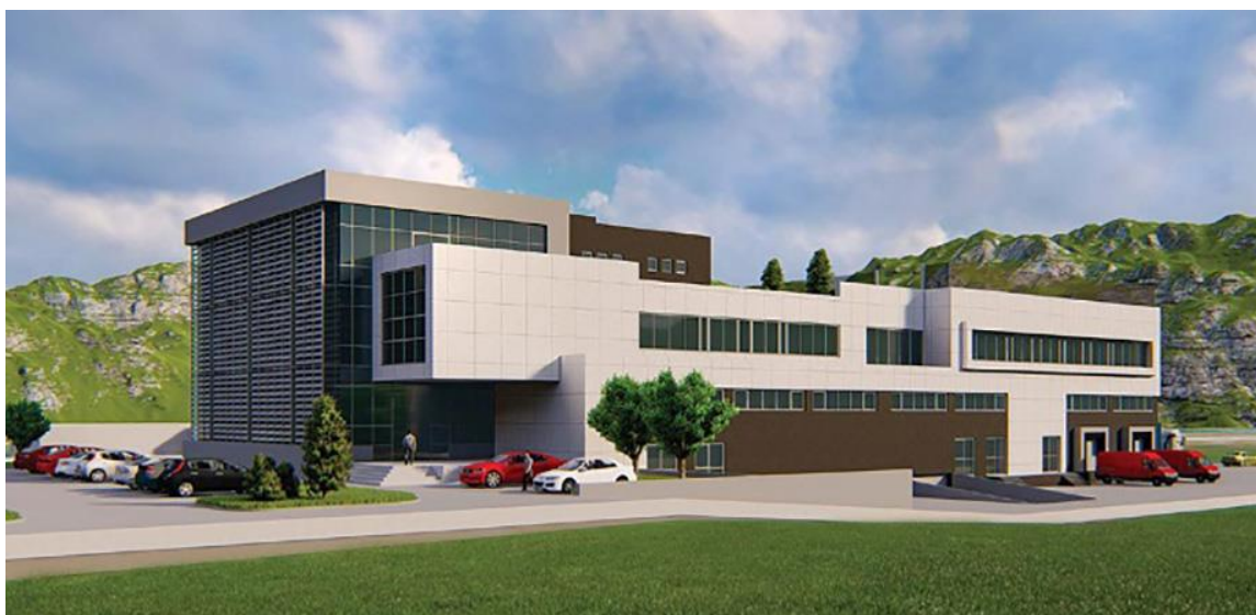
Slika 1. Suvremeni logistički centar [1]

Na Slici 1. prikazan je suvremeni logistički centar , dok je na Slici 2. prikazana unutrašnjost logističkog centra.