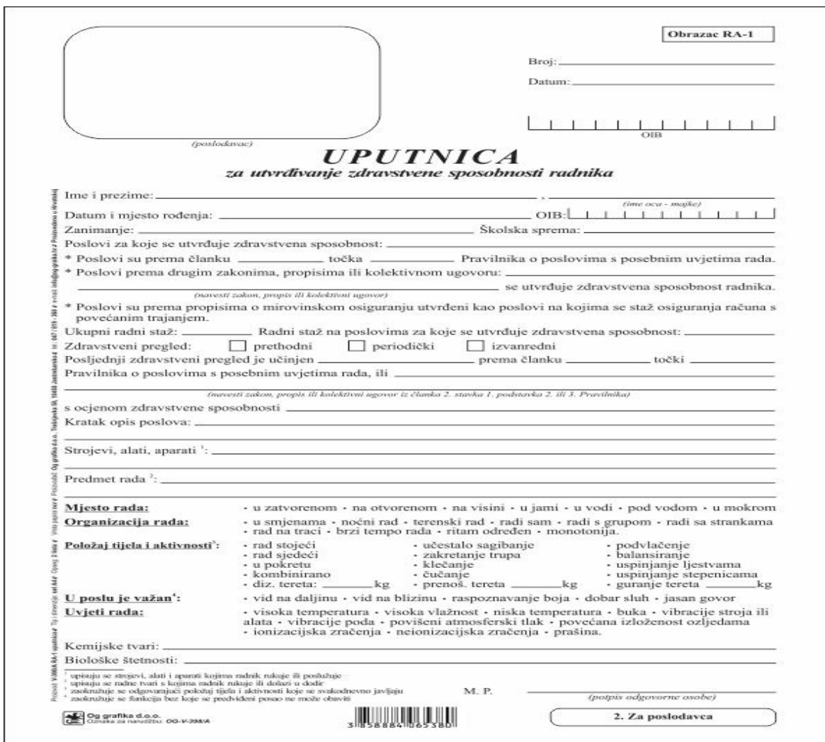
Slika 2.: Uputnica za utvrđivanje zdravstvene sposobnosti radnika