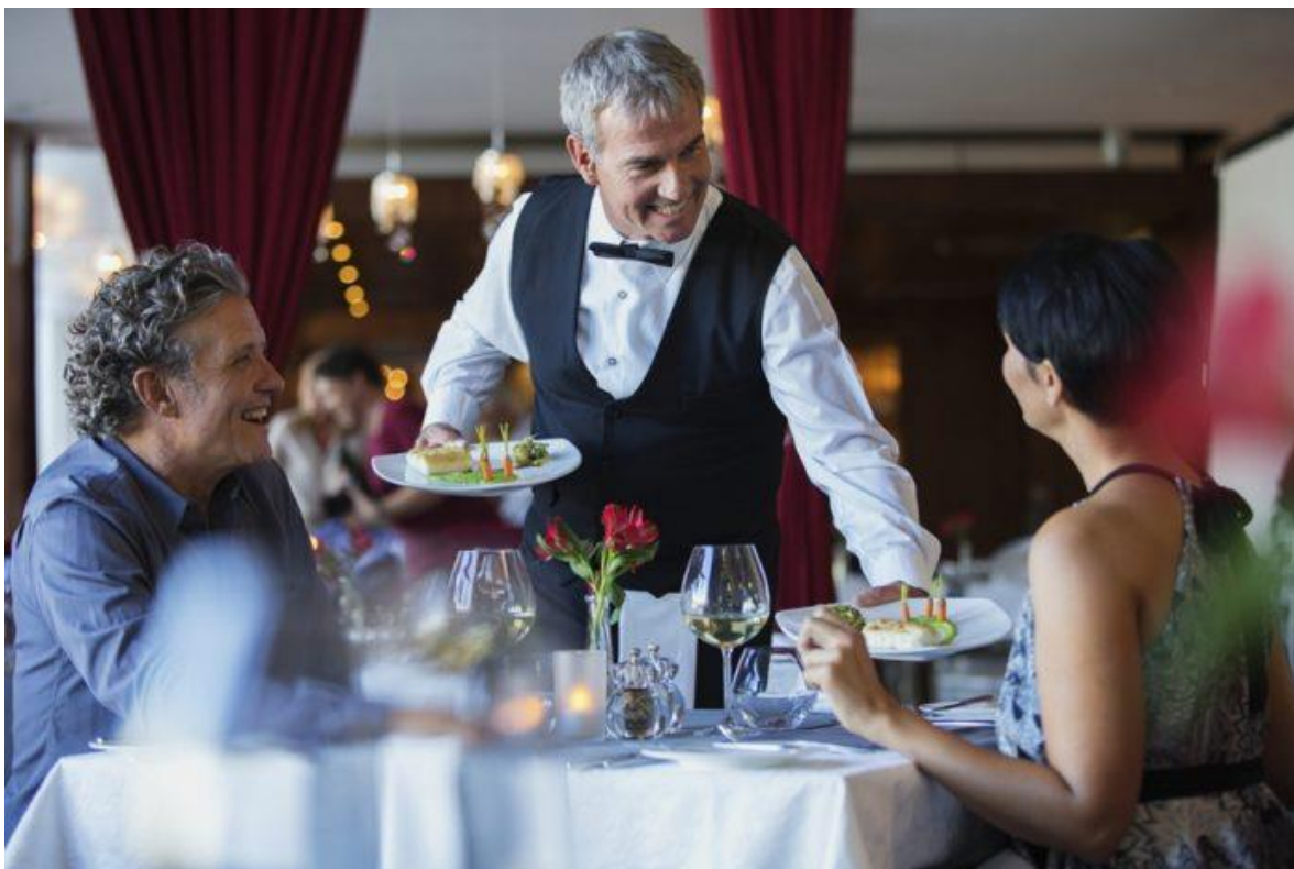
Slika 6.: Konobarenje kao primjer zaposlenika koji dominantno hodaju tijekom radnog vremena