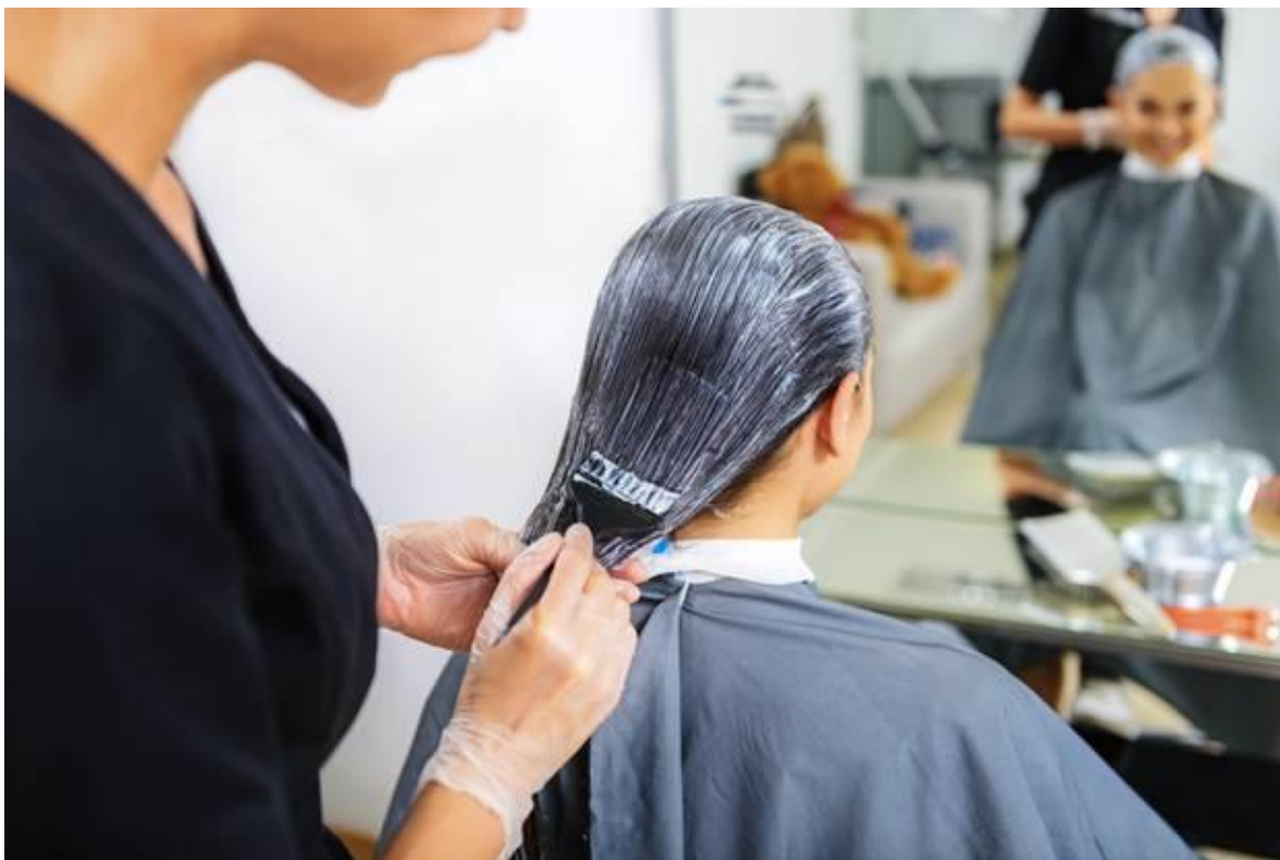
Slika 7.: Frizeri kao primjer zaposlenika koji dominantno stoje tijekom radnog vremena