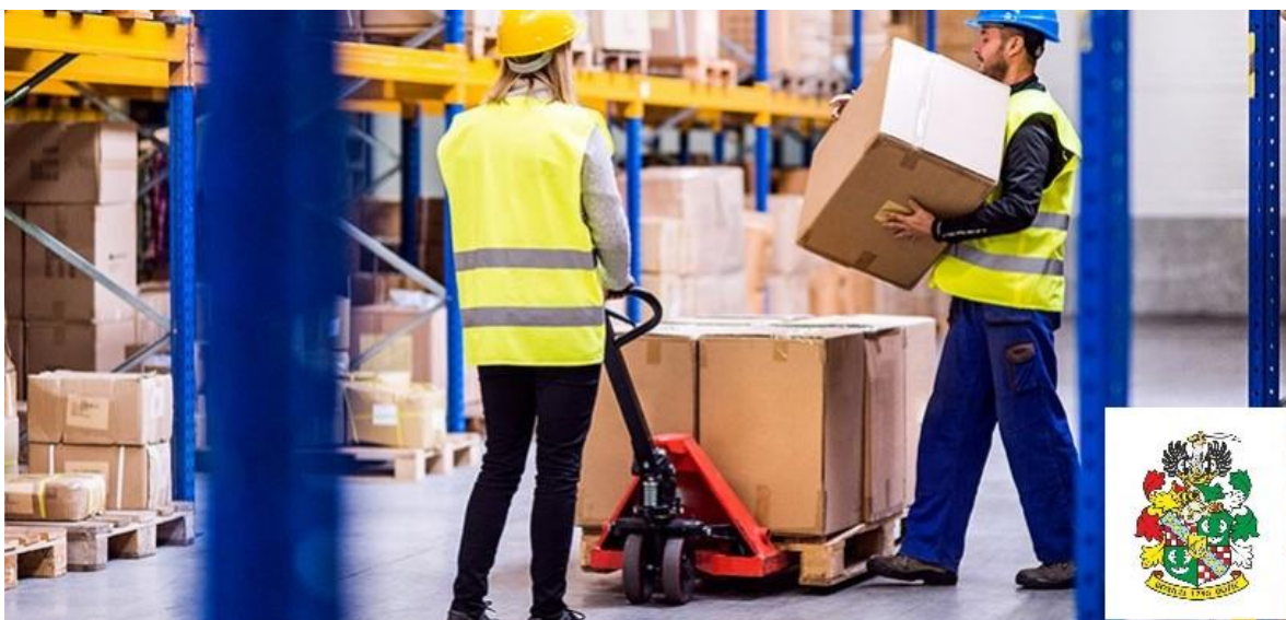
Slika 9.: Skladišni radnici kao primjer zaposlenika koje obilježava dominantno prenošenje tereta tijekom radnog vremena