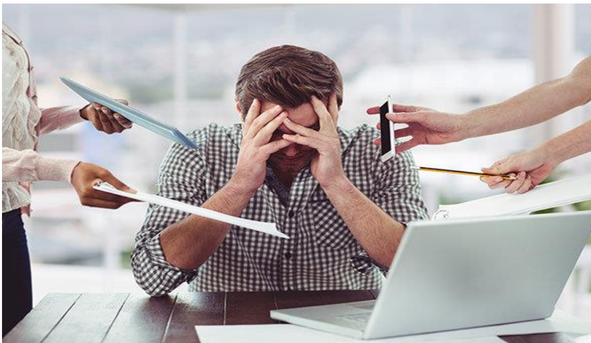
Slika 3.: Stres

situacije (Folkman i sur., 1986). Posljedice stresa očituju se na psihičkom, socijalnom i tjelesnom planu. Naime, neprimjereno suočavanje sa stresnom situacijom može rezultirati narušavanjem psihološke dobrobiti, koja se odnosi na dugoročno zadovoljstvo samim sobom i svojim životom, socijalne dobrobiti, koja se odnosi na ispunjavanje socijalnih uloga, te tjelesne dobrobiti koja obuhvaća tjelesno funkcioniranje, zdravlje i dugovječnost. Folkman i sur. (1986) su istaknuli važnost svih triju aspekata dobrobiti, no u skladu s ciljem istraživanja u ovom radu naglasit ćemo karakteristike povezanosti stresa doživljenog na radnom mjestu i tjelesne dobrobiti pojedinca. Utvrđeno je da ispitanici s niskom razinom tjelesne aktivnosti u slobodno vrijeme iskazuju veću razinu napetosti na poslu (Wemme i Rosvall, 2005). Znanstveni dokazi, također, potvrđuju pretpostavku prema kojoj je tjelesna aktivnost u negativnoj korelaciji sa stupnjem percipiranog stresa (Schnohr i sur, 2005).