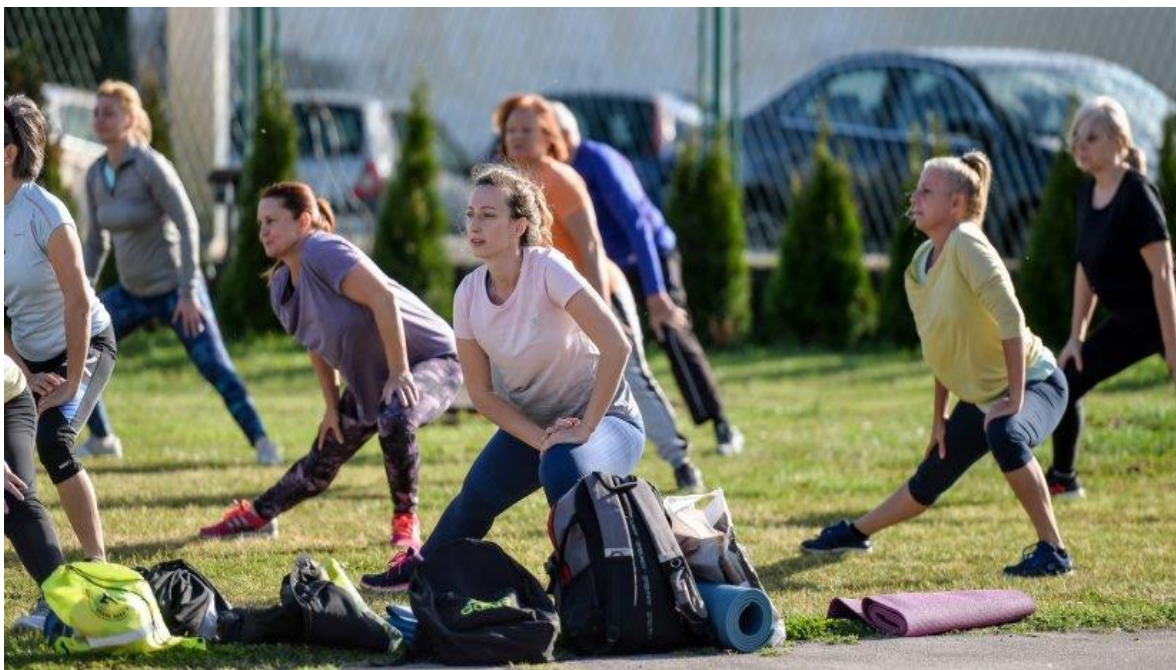
Slika 10.: Sportsko-rekreacijski program “Zdrav pokret”

vježbanja te opsega opterećenja pri vježbanju. Inicijalno stanje organizma se utvrđuje različitim dijagnostičkim postupcima, koji obuhvaćaju baterije testova za utvrđivanje antropometrijskih karakteristika te funkcionalnih i motoričkih sposobnosti. U kasnijim fazama vježbanja testovi za utvrđivanje aktualnog stanja se koriste u svrhu kontrole učinaka programa vježbanja. Izbor baterije testova ovisi o materijalnim mogućnostima i stručnim kadrovima (Andrijašević, 1996). Rezultati dobiveni putem inicijalnog testiranja omogućuju programiranje za individualni ili grupni rad u kojemu se grupe oblikuju na temelju sličnih sposobnosti i ciljeva programa. Konačno, prilikom planiranja i programiranja kinezioloških programa u vidu treba imati i eventualne kontraindikacije za sudjelovanje u programima vježbanja. Smatra se da je vježbanje kontraindicirano kod zaraznih bolesti, upalnih procesa, zloćudnih (malignih) tumora, velikih gubitaka krvi (teških anemija), otrovanog organizma (sepse), šoka, kroničnih srčanih bolesti i sl.