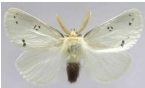
Slika 4.: Leptir Euproctis chrysorrhoea L. [4]

Zlatokraj u odraslom obliku je veliki leptir bijelih krila. Mužjaci se od ženki razlikuju po tamnoj pjegi na prednjim krilima, a ime su dobili po žuto-smeđim dlačicama koje se nalaze na kraju trbuha (slika 4.). Napadnuta stabla mogu odumrijeti nakon uzastopnih golobrsta.