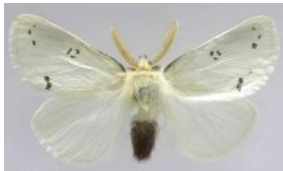
Slika 4.: Leptir Euproctis chrysorrhoea L. [4]

Zlatokraj u odraslom obliku je veliki leptir bijelih krila. Mužjaci se od ženki razlikuju po tamnoj pjegi na prednjim krilima, a ime su dobili po žuto-smeđim dlačicama koje se nalaze na kraju trbuha (slika 4.). Napadnuta stabla mogu odumrijeti nakon uzastopnih golobrsta.