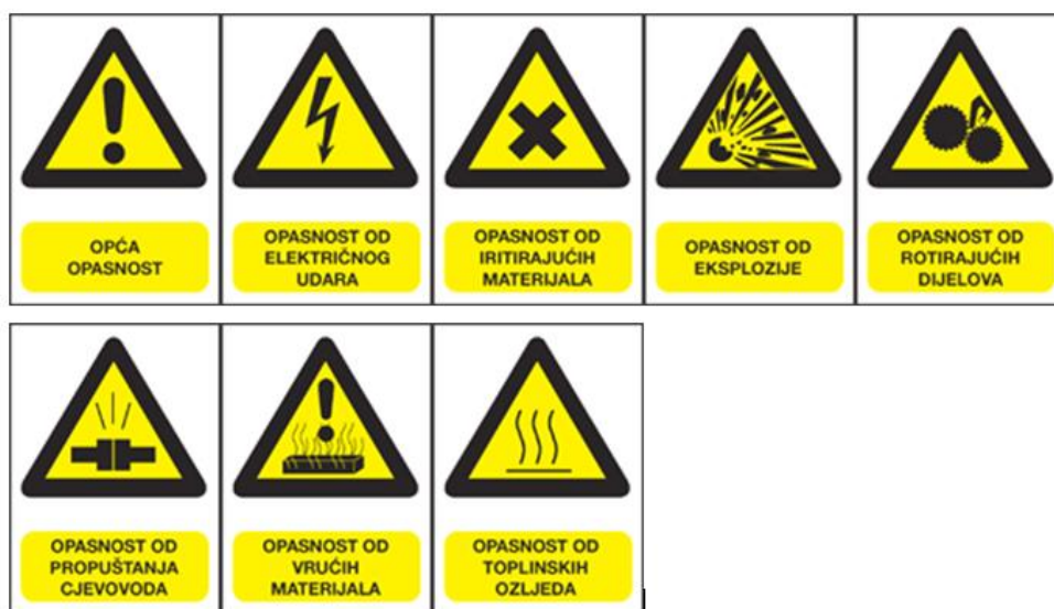
Slika 7. Znakovi opasnosti [7]

U Mikro pivovari su postavljeni znakovi kako bi se spriječio mogući nastanak ozljede. Ti znakovi moraju biti pravovremeno i pravilno postavljeni na mjesta opasnosti kako bi bili uočljivi.