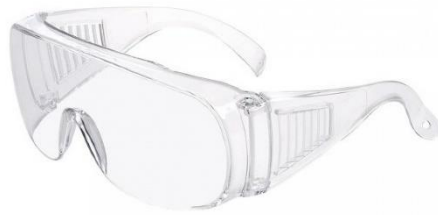
Slika 6. Zaštitne naočale [6]