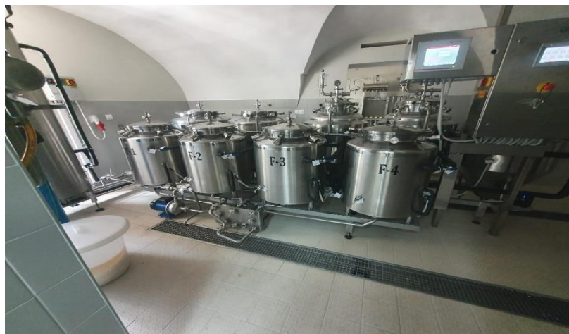
Slika 1. Tankovi za fermentaciju Mikro pivovare Veleučilišta u Karlovcu [1]

Fermentacija je proces stvaranja piva kada se ujedine sav naporan rad, planiranje, recepti, sastojci i procedure u jedno. Ona započinje dodavanjem kvasca u sladovinu nakon čega kvasac počinje raditi što zna, a to je da razmnožavajući razgrađuje šećer na alkohol i CO 2 , uz stvaranje spojeva poput sumpora, estera, diacetila i slično. Fermentacija se dijeli na dvije faze, a to su glavno i naknadno vrenje.