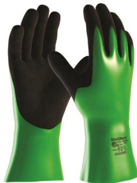
Slika 5. Zaštitne rukavice [5]