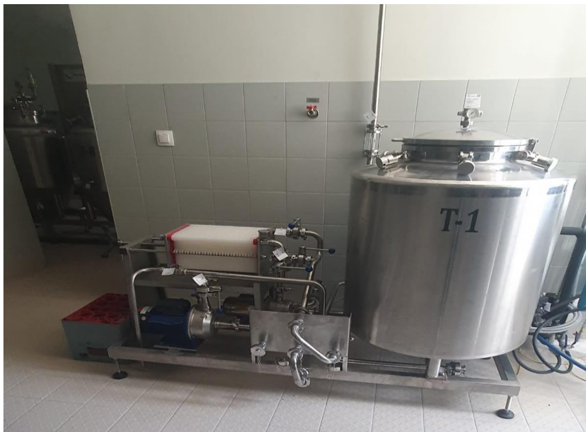
Slika 2. Pločasti filter Mikro pivovare Veleučilišta u Karlovcu [2]

Filtracija je tehnološka operacija pri kojoj dolazi do razdvajanja krutih čestica od fluida, prolaskom fluida kroz filtracijski medij na kome se zadržavaju krute čestice. U Mikro pivovari Veleučilišta u Karlovcu pivo će se filtrirati na pločastom filteru sa odgovarajućom kvalitetom (granulacijom) ploča. Filtrirano pivo puni se u tlačni tank iz kojeg se pod tlakom CO 2 pivo prebacuje na poluautomatski punjač boca. [4]