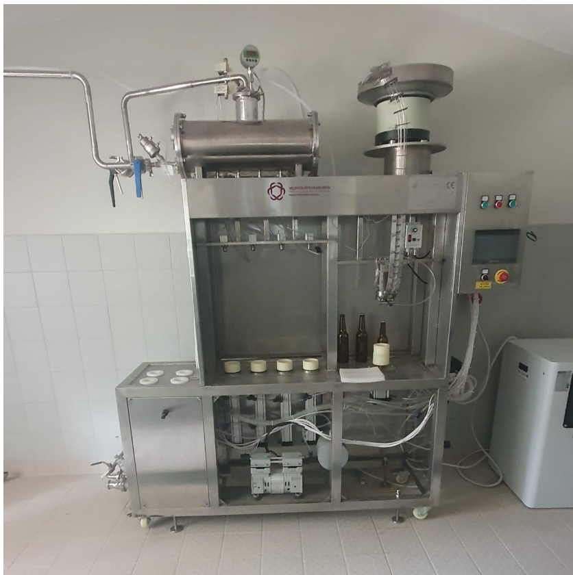
Slika 3. Poluautomatski punjač boca Mikro pivovare Veleučilišta u Karlovcu [3]

Polu-automatski punjač boca koji se nalazi u Mikro pivovari Veleučilišta u Karlovcu je kompaktna jedinica koja se sastoji od tri jedinice: ispiranje boca, punjač, te krunska čepilica boca. Boce se ručno ispiru i postavljaju na odgovarajuće nosače punjača koji ima dvije glave te se vrši najprije punjenje boce sa CO 2 , zatim se boca napuni pomoću automatske glave, te se ručno stavlja na nosač krunske čepilice. Dodavanje krunskih čepova je ručno.