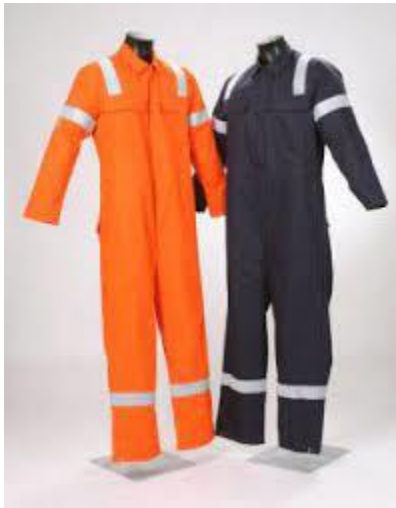
Slika 4. Zaštitno odijelo [4]

Sam tehnološki proces proizvodnje pive zahtjeva zaštitna sredstva kako bi se osiguralo osobu od neželjenih ozljeda koje se mogu dogoditi kod rukovanja s strojevima i uređajima. U Mikro pivovari u Karlovcu nisu potrebna zaštitna sredstva prilikom rada jer se radi o vrlo zaštićenoj i izoliranoj opremi. No, operater koji rukuje uređajima tokom proizvodnje npr. uzimajući uzorke mora biti opremljen osobnim zaštitnim sredstvima kao što su radno odijelo, zaštitne rukavice, te zaštitne naočale. Ukoliko se operater odluči na ručno pranje opreme bilo koje opreme Mikro pivovare mora se pridržavati pravila zaštite na radu kako bi se izbjegle neželjene posljedice.