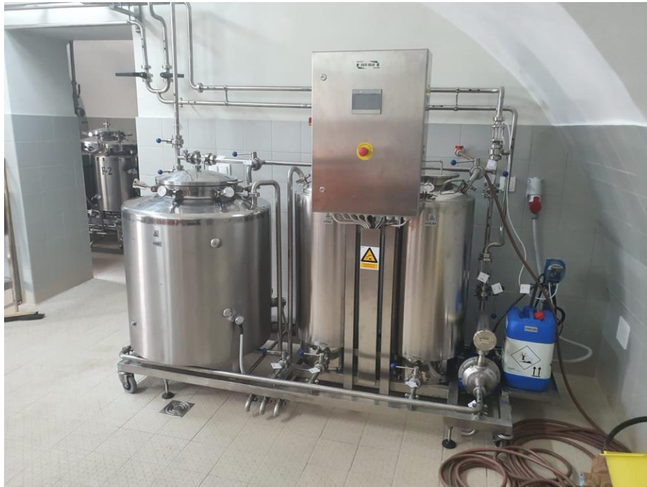
Slika 8. CIP stanica [8]

naslage iz cjevovoda koje nastaju tijekom procesa proizvodnje. Bez ovog uređaja nijedna linija za proizvodnju napitaka ne može se koristiti zbog rizika od onečišćenja bakterija.