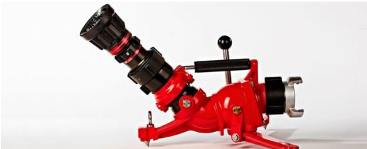
Slika 9. Vatrogasni prijenosni monitor [9]

Kada se mobilni monitor planira kao pričuva, onda je njegova stalna lokacija smještaja u okviru vatrogasnog interventnog skladišta 2 . Kod planiranja mobilnog monitora kao glavnog sustava za gašenje pjenom, monitor se planski postavlja na teren oko štice prostora, i uz monitor se postavljaju bačve s pjenilom, tlačne cijevi za priključenje na hidrantsku mrežu ili vatrogasna vozila. Karakteristike mobilnog monitora (kapacitet protoka, radni tlak i domet mlaza) u pravilu su približne kao i kod fiksnog monitora. Rukovanje mobilnim monitorom uglavnom je ručno i njegov rad može nadzirati jedan vatrogasac.