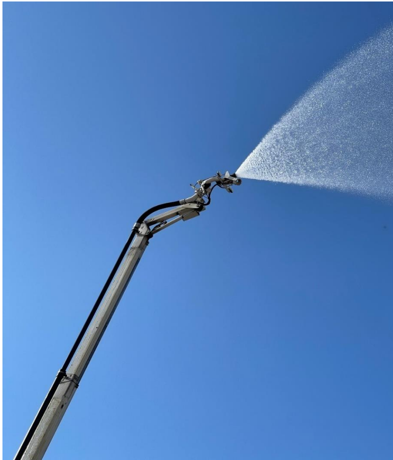
Slika 13. Top-monitor na hidrauličkoj ruci [13]