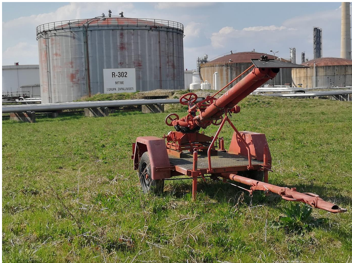
Slika 3. Rezervoar s ravnim krovom i mobilni bacač vode / pjene [3]

Kod zaštite zapaljive tekućine pohranjene u vertikalnom atmosferskom spremniku izlazi za ispuštanje pjene moraju biti pričvršćeni za sam spremnik. Tamo gdje su potrebna dva ili više izlaza za ispuštanje, ti se izlazi moraju jednoliko međusobno razmaknuti po periferiji spremnika i svi moraju biti tako dimenzionirani, da pjenu ispuštaju s približno jednakom protočnom količinom. Fiksni izlazi za ispuštanje moraju biti sigurno pričvršćeni pri vrhu plašta i tako locirani ili spojeni, da se isključi mogućnost da se sadržaj spremnika prelije u linije pjene. Izlazi moraju biti tako sigurno pričvršćeni, da niti kod odvajanja krova ne bude vjerojatno da će izloženi ozbiljnom oštećenju.