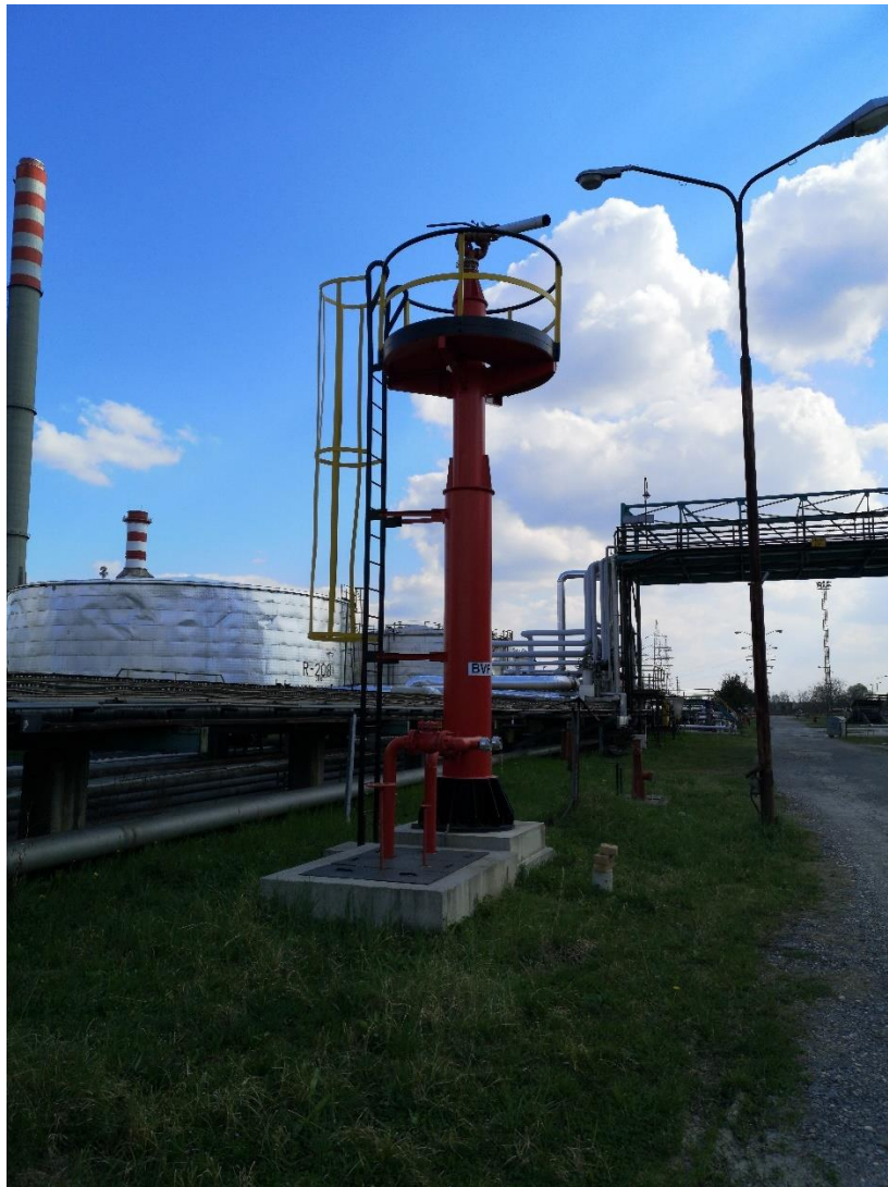
Slika 8. Fiksni top monitor [8]

Fiksni monitor se uglavnom postavlja na povišene podeste platforme čija visina od tla može biti najčešće do 10 m. Otopina pjenila i vode u fiksni monitor može biti dovedena pomoću fiksnog cjevovoda iz stacionarnih izvora i spremnika, ili pomoću vatrogasnih vozila koja se tlačnim cijevima izravno povezuju sa priključcima fiksnog monitora.