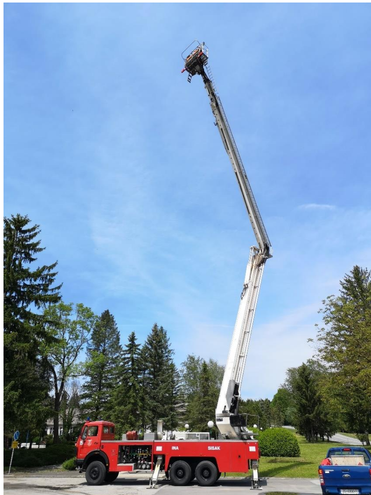
Slika 7. Hidraulična zglobna platforma (SS – 300) [7]