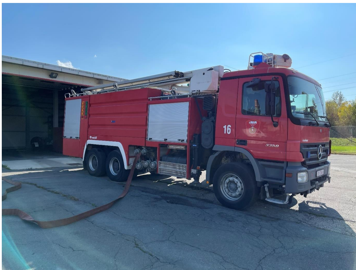
Slika 5. MB 3350/45/6x4 ACTROS Specijalno vatrogasno vozilo br.16 [5]

Ovo specijalno vatrogasno vozilo je razvijeno u firmi Rosenbauer, kao plod svjetskih trendova i višegodišnjeg iskustva u projektiranju, izradbi i uporabi sličnih vozila diljem svijeta. Vozilo je specifično zbog mogućnosti gašenja požara odozgo na spremnicima lakozapaljivih tekućina i na ostalim dijelovima postrojenja u Rafineriji nafte Sisak.