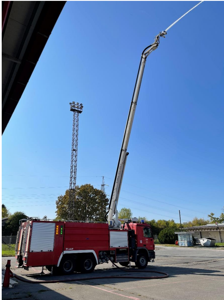
Slika 6. Podignuta hidraulična ruka s monitor bacačem [6]

Nakon završetka intervencije vrši se dreniranje i ispiranje sustava od pjene. Pravilnim postupcima održavanja, adekvatnim i pravilnim korištenjem prema uputama proizvođača, zagarantiran je pouzdan i dug vijek trajanja ovog vozila.