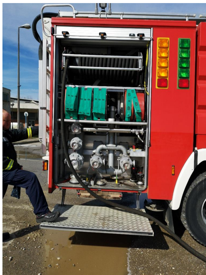
Slika 12. Vitlo za brzu navalu [12]