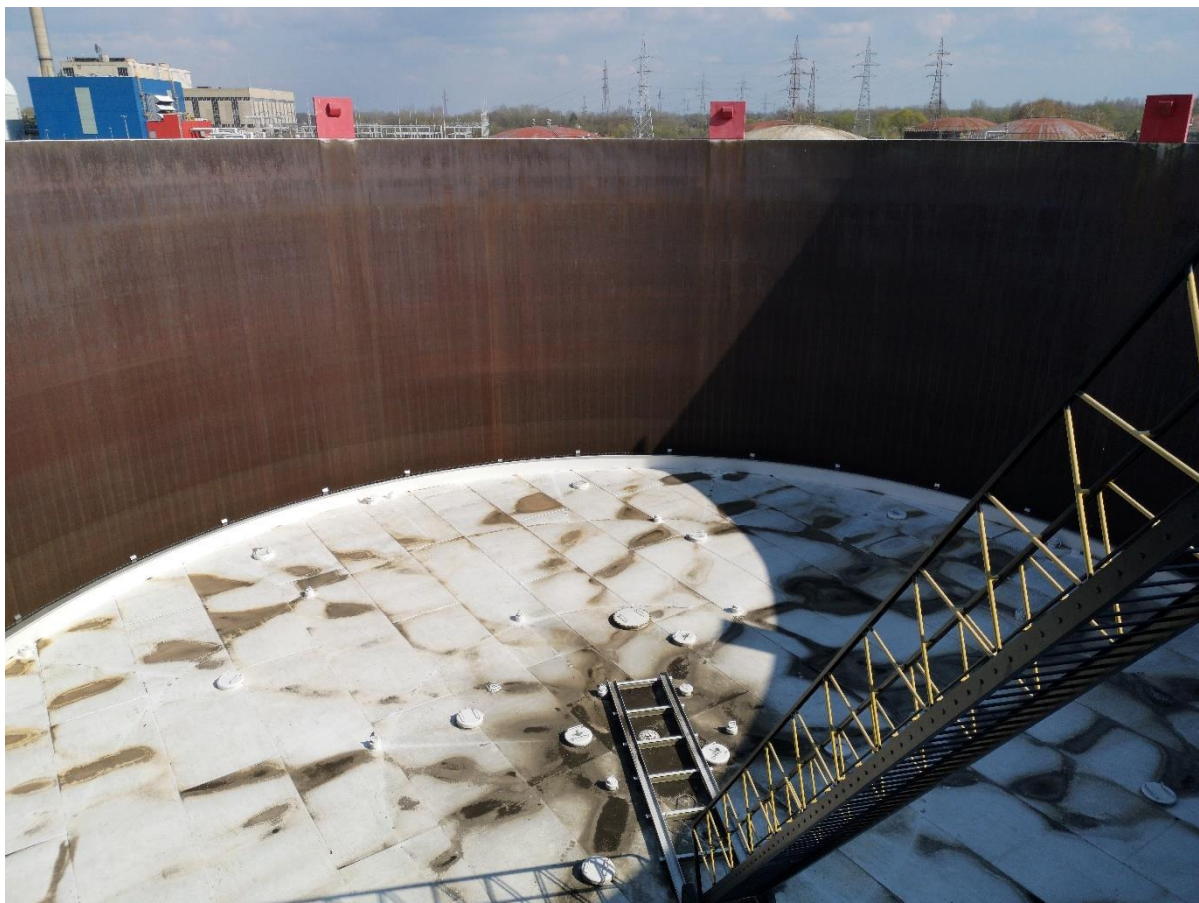
Slika 4. Plivajući krov spremnika s pristupnom ogradom [4]