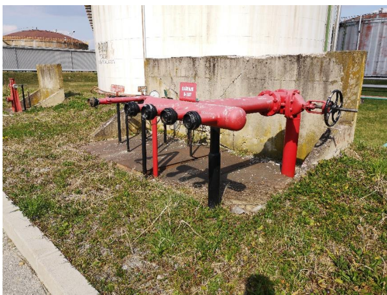
Slika 1. Polustabilni sustav za gašenje pjenom (polustabilni priključak) [1]