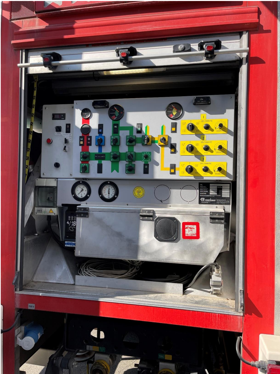
Slika 11. Radno sučelje pumpe [11]