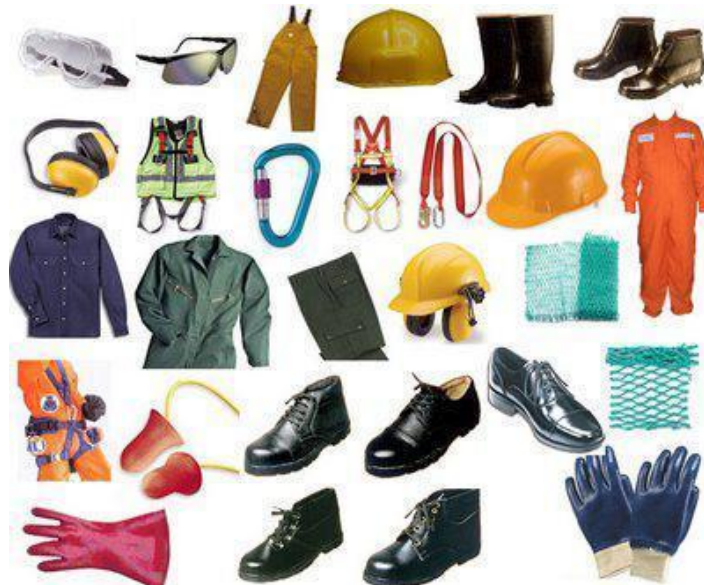
Slika 6. Primjeri Osobne zaštitne opreme [6]

Ako se prilikom ozljeđivanja dokaže da je zbog nekorištenja osobnih zaštitnih sredstava u prekršaju bio radnik-rukovatelj, ništavan je bilo kakav zahtjev za odštetu od radnika prema poslodavcu ili odgovornoj osobi u poduzeću. [26]