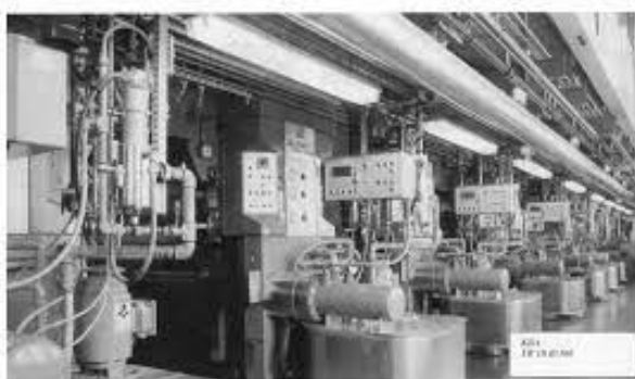
Slika 2. Bakrotisna rotacija KBA [2]

Danas se uz manje korištenje rotacionih knjigotiskarskih strojeva u sve većoj mjeri (prvi iza ofseta) koriste strojevi za fleksotisak. On je danas najrasprostranjeniji predstavnik visokog tiska u svijetu, s tendencijom porasta. Bakrotisak spada, kao i knjigotisak i ofset, u glavne tehnike tiska, a pojavljuje se krajem 15. st. Neki smatraju da ga je otkrio firentinski zlatar Finiguerra Masso. Sigurno je da ga je u Nürnbergu koristio slikar Albrecht Dürer početkom 16. st. U to doba, zbog loše riješene tehnologije izrade tiskovne forme i otrovnosti bojila, nema masovne primjene. Masovna primjena počinje u dvadesetim godinama 20. st., rješanjem postojećih problema. Bakrotisak spada u tehnike dubokog tiska, što znači da su tiskovni elementi udubljeni, a slobodne površine u osnovnoj ravnini. Bojilo niskog viskoziteta nanosi se na cijelu tiskovnu formu, a zatim se rakelom uklanja sa svih slobodnih površina. Direktnim pritiskom forme na tiskovnu podlogu dobivaju se otisci. Danas je bakrotisak u produkciji zastupljen s preko 90% s tiskarskim rotacijama. Iza svjetlotiska bakrotisak ostvaruje najkvalitetnije otiske. Posebno je pogodan za tisak kolora i reprodukcija s nježnim prijelazima boja. Naravno, viša kvaliteta se postiže ako se tiska na stroju na arke. [10] [11]