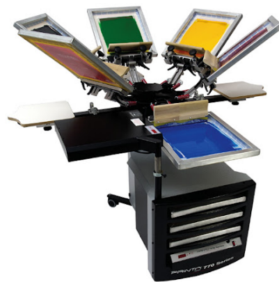
Slika 4. Sitotiskarski stroj [4]

oglašavanje (koji su bili smješteni) u trgovinama. Ručni proces sitotiska ostaje velika poslovna tajna sve do 1950-ih godina. Najveću promociju sitotisku rade umjetnici koji tako otiskuju svoje radove, takav način otiskivanja se zove serigrafija. Američki poduzetnik, umjetnik i izumitelj Michael Vasilantone počeo je koristiti, razvijati i prodavati preklopni višebojni stroj za otiskivanje boje na odjeću u 1960. godini. Sitotisak na odjeću trenutačno čini više od polovice (aktivnosti) otiskivanja putem sita u SAD-u. Stroj se sastoji od tiskovne forme koja je građena tako da mrežica sita koja je pričvršćena na okvir ima zatvorene očiće gdje su slobodne površine, a otvorene gdje su tiskovni elementi. Zatim se pomoću rakela bojilo protiskuje kroz otvorene očiće na tiskovnu podlogu. Sitotisak je sporija tehnika tiska. Ima mogućnosti otiskivanja na sve materijale od stakla, papira do tkanina, plastike itd. Tiska se na ravne, cilindrične ili drugačije tiskovne podloge. [11] [12] [13]