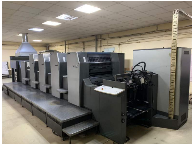
Slika 3. Ofsetni stroj Heidelberg [3]

elektronika, a postupno se uvode računala. Tada dolazi do djelomične digitalizacije tehnološkog procesa i računalom vođenog tiska. Danas se grade u tehnici ofseta od malih jednobojnih do desetbojnih velikih strojeva za tisak na arke, te od malih do mamut rotacija s blizu 200 tiskovnih jedinica. Brzina tiska na arke je do 18.000 araka na sat, rotacija do 70.000 okretaja, a pritom nerijetko svaka tiskovna jedinica otisne po 8 otisaka u jednom okretaju. Pod pritiskom fleksotiska i digitalnih tehnika, udio ofsetnog tiska u svijetu opao je na 40–45% (s daljom laganom tendencijom pada). Dio mokrog ofsetnog tiska se postupno transformira u bezvodni ofsetni tisak. [11] [12] [13]