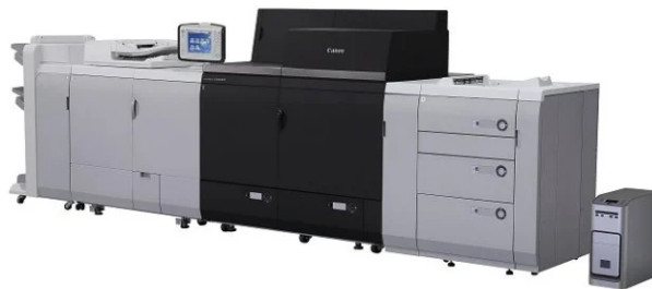
Slika 5. Canon digitalni tiskarski stroj [5]

Digitalni strojevi danas tiskaju uspješno i u koloru, a osim strojeva za tisak na arke proizvode se i rotacije. Također za postizanje vrlo visoke kvalitete otisaka i lakšeg održavanja grade se i ofsetni strojevi. Inkjet tehnika je vrlo rasprostranjena. Susrećemo ju od malih pisača do strojeva koji tiskaju i do 20 metara duge gigantografije (npr. plakati uz prometnice). Najčešće tehnologije inkjet tiska jesu: termički inkjet (Bubble Jet), piezo inkjet, a nerijetko se susreće elektrostatski inkjet. Inkjet tehnika tiska je u stvari pravi bezkontaktni tisak. [11] [12] [13]