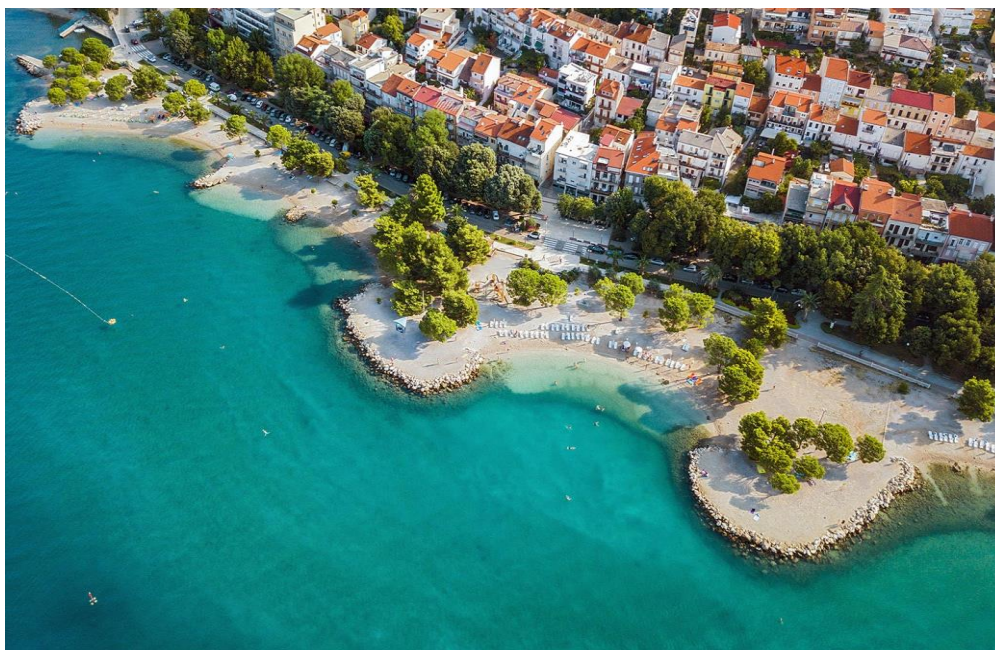
Slika 3 Gradsko kupalište Crikvenica