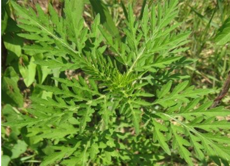
Slika 2. Ambrozija ( Ambrosia artemisiifolia )(plantea.hr)