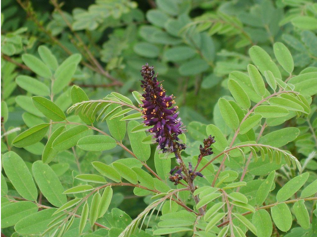
Slika 3. Čivitnjača ( Amorpha fruticosa )

Alohtona ili strana vrsta je vrsta koja prirodno ne obitava u određenom eko sustavu, nego je u njega dospijela namjernim ili nenamjernim unošenjem. Ukoliko širenje alohtone vrste negativno utječe na bioraznolikost, zdravlje ljudi ili pričinjava ekonomsku štetu na područje gdje je unesena , onda tu vrstu smatramo invazivnom. Širenje alohtonih vrsta je posljedica ubrzanog rada trgovine, transporta i putovanja. Danas je to jedan od glavnih problema u očuvanju bioraznolikosti. Zbog velikog širenja na određenim područjima ,danas je veliki problem njihovo uklanjanje i vraćanje autohtonih vrsta na određeno područje . Za održavanje autohtonih vrsta vrlo je bitno na vrijeme uočiti problem sa invazivnim vrstama , te na vrijeme krenuti sa njihovim uklanjanjem ( mehaničko,kemijski ili kombinirano uklanjanje) . Uglavnom su unesene iz Sjeverne ili Južne Amerike ili Azije. Zbog svoje prilagodljivosti vrlo brzo se udomaće , te čak i formiraju nove biljne zajednice s autohtonom florom. Neki podaci su da se u nacionalnim parkovi alohtona flora doseže čak 30 do 50 % od sveukupnog broja vrsta. Alohtona flora nije uvijek štetna, čak su neke vrste i usjevi za konzumaciju ljudi, ali baš invanzivne vrste su štetne za bioraznolikost i okoliš, te za ljudsko zdravlje.