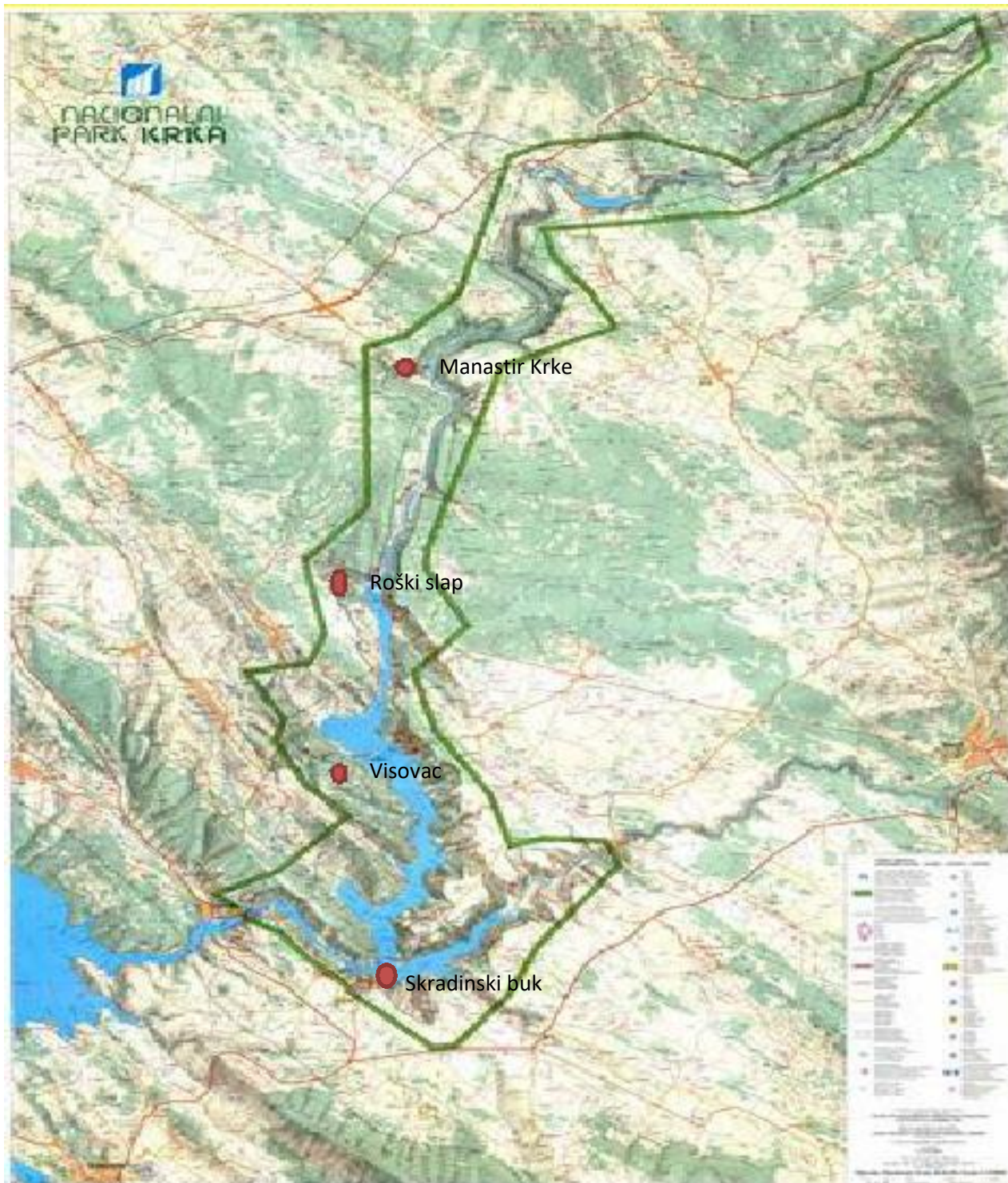
Slika 13 Karta NP Krka , te obilježena crvenim krugovima mjesto istraživanja pajasena( Alianthus altissima )(narodne-novine.nn.hr)