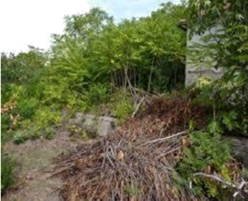
Slika 21 Uklanjanje pajasena mehanički