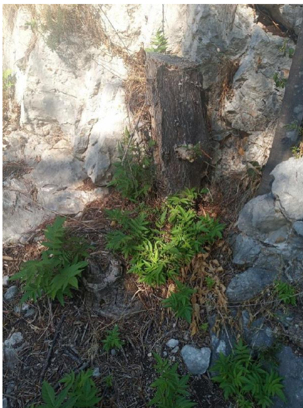
Slika 19 Velika izbojna snaga na lokaciji Skradinski buk(Nađ M.)