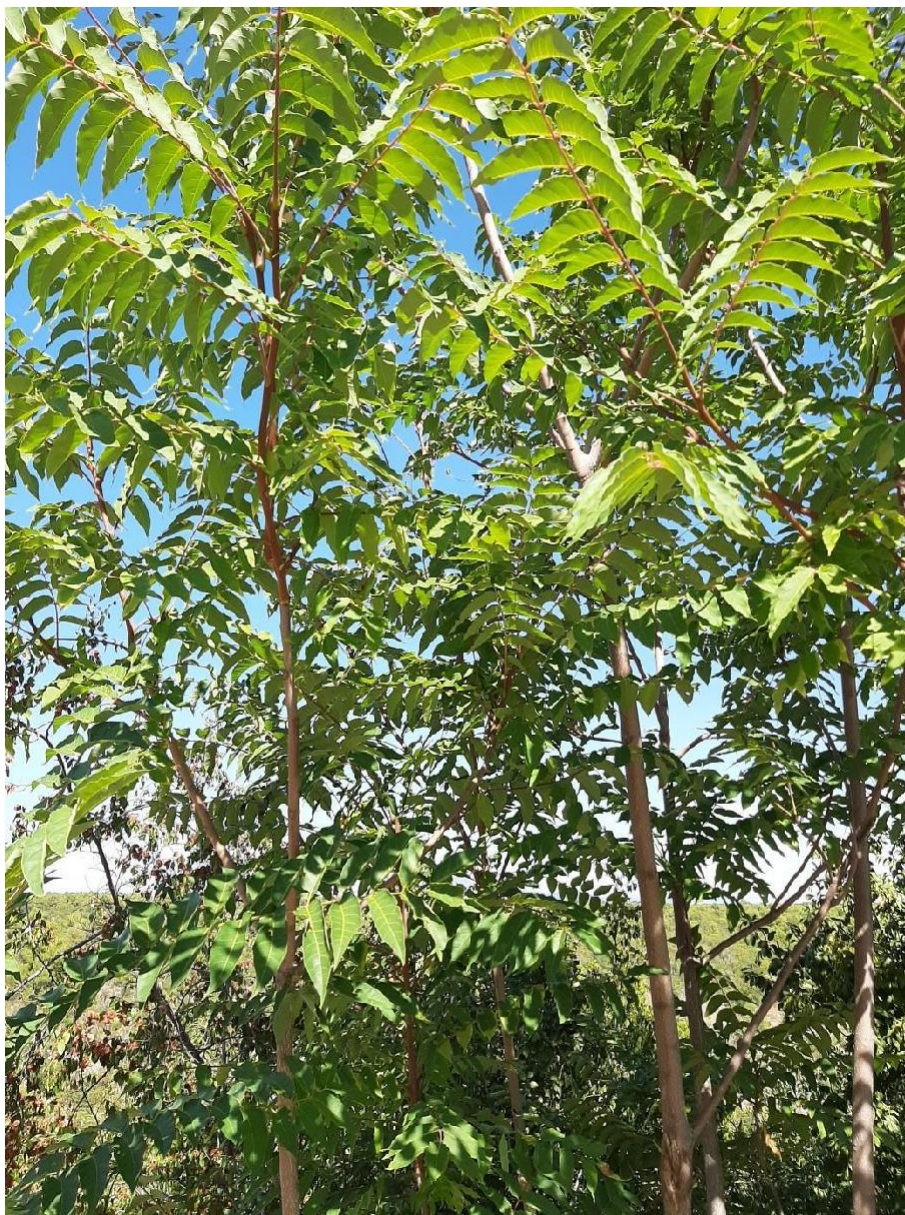
Slika 5. Pajasen ( Ailanthus altissima )(Nađ M.)

Pajasen ( Ailanthus altissima (Mill.) Swingle) je listopadno drvo iz porodice pajasena ( Simaroubaceae ). Drvo koje naraste do 30 m, s promjerom debla do 1,5 m. Kora debla i grana je glatka, siva, bjelkasto išarana. Mladi izbojci su debeli i krhki, s glatkom, žućkastosivom korom i krupnom smeđom srčikom.