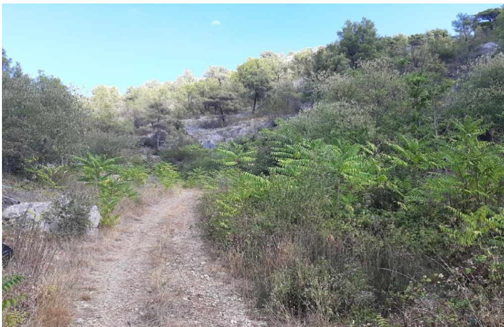
Slika 14 Pajasen na lokaciji Skradinski buk(Nađ M.)