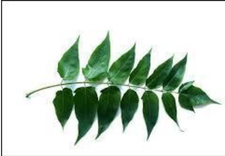
Slika 6. List pajasena

Listovi su veliki (50 - 90 cm), neparno perasti, sastavljeni od 13 - 25 (41) lancetastojajastih, na vrhu dugozašiljenih liski. Liske su na kratkim peteljčkama, duge 5-12 cm i 2-4 cm široke, zaobljenih baza na kojima se bočno nalaze 2 - 4 tupa zupca. Svaki zubac s donje strane nosi crnkasta žlijezdu koja izlučuje slatki sok. Počinje cvjetati i plodonositi od pete godine života.