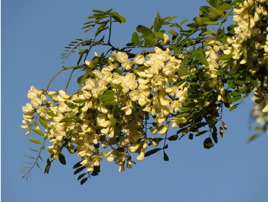
Slika 4. Bagrem( Robinia pseudoacacia )