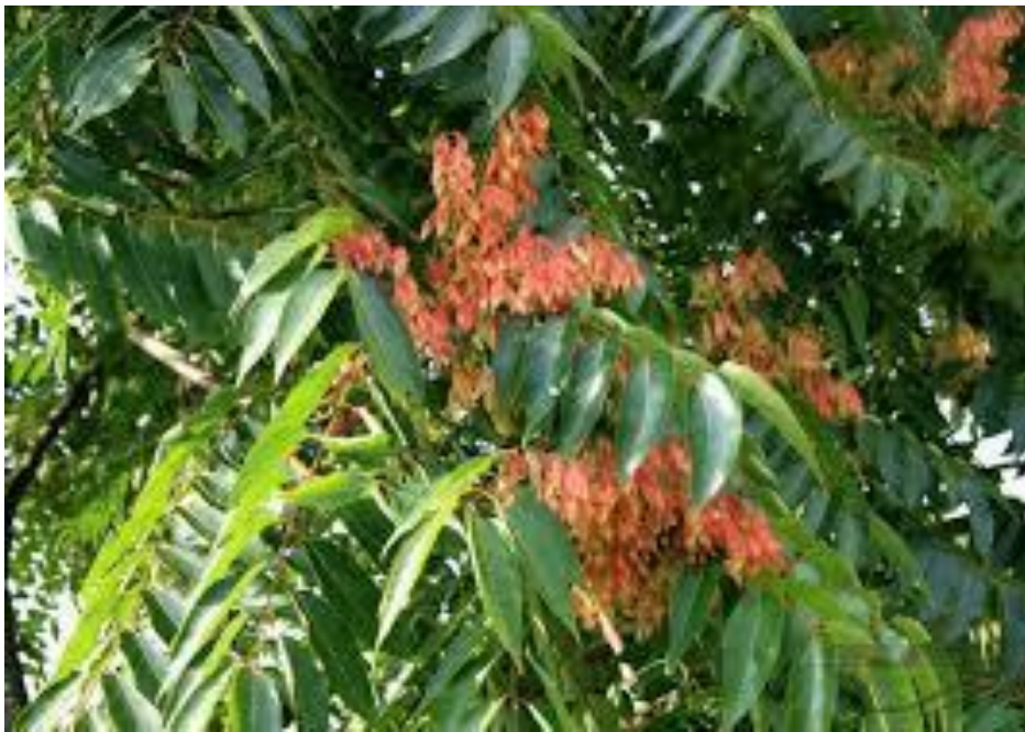
Slika 1.Primjer alohtone vrste ,Pajasen ( Alinthus altissima )

-Sve vrste koje prirodno obitavaju u određenom ekosustavu nekog područja (izvorne, domaće, zavičajne).