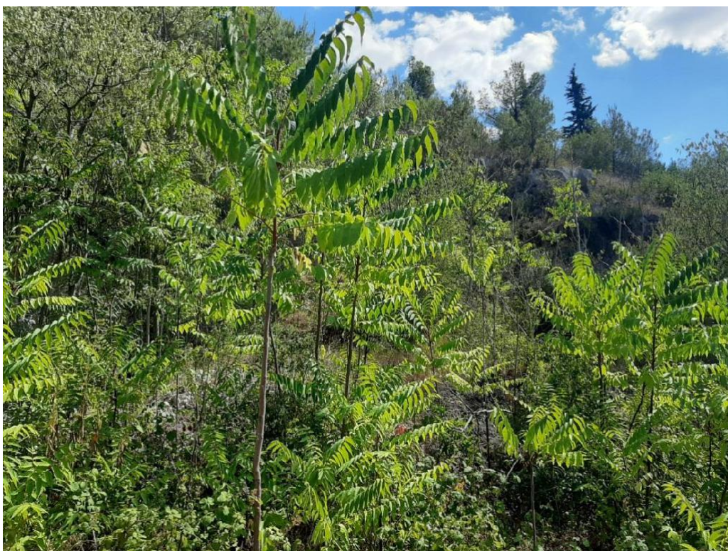
Slika 15 Pajasen na lokaciji Visovac(Rupe)(Nađ M.)