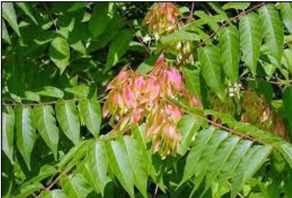
Slika 7 Cvatovi pajasena

Cvjetovi su sitni (7-8 mm široki), neugodnog mirisa, isprva zelenkastožuti, a kasnije crvenkasti. Skupljeni su u uspravnim metličastim cvatovima, dugim 10 - 25 cm.