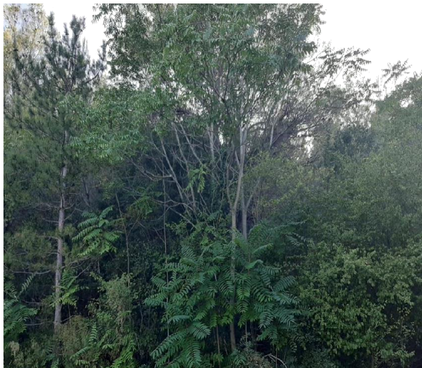
Slika 18 Pajasen na lokaciji Roški slap(Nađ M.)