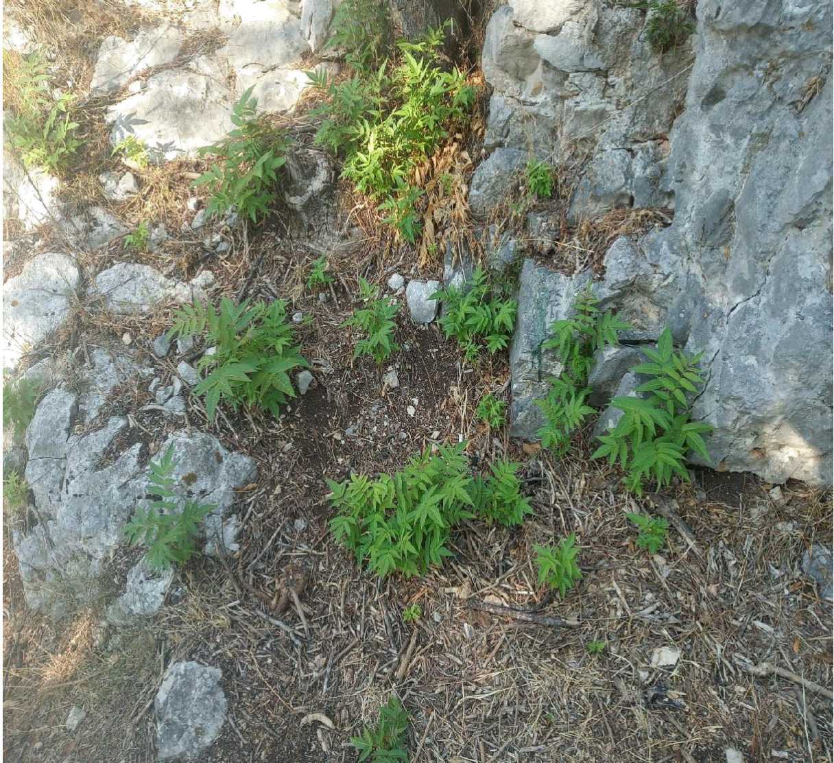
Slika 20 Pajasen na lokaciji Skradinski buk(Nađ M.)