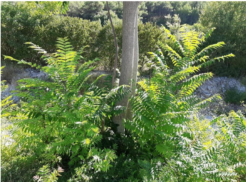
Slika 17 Pajasen i njena velika izbojna snaga iz panja na lokaciji Manastrir Krka(Nađ M.)