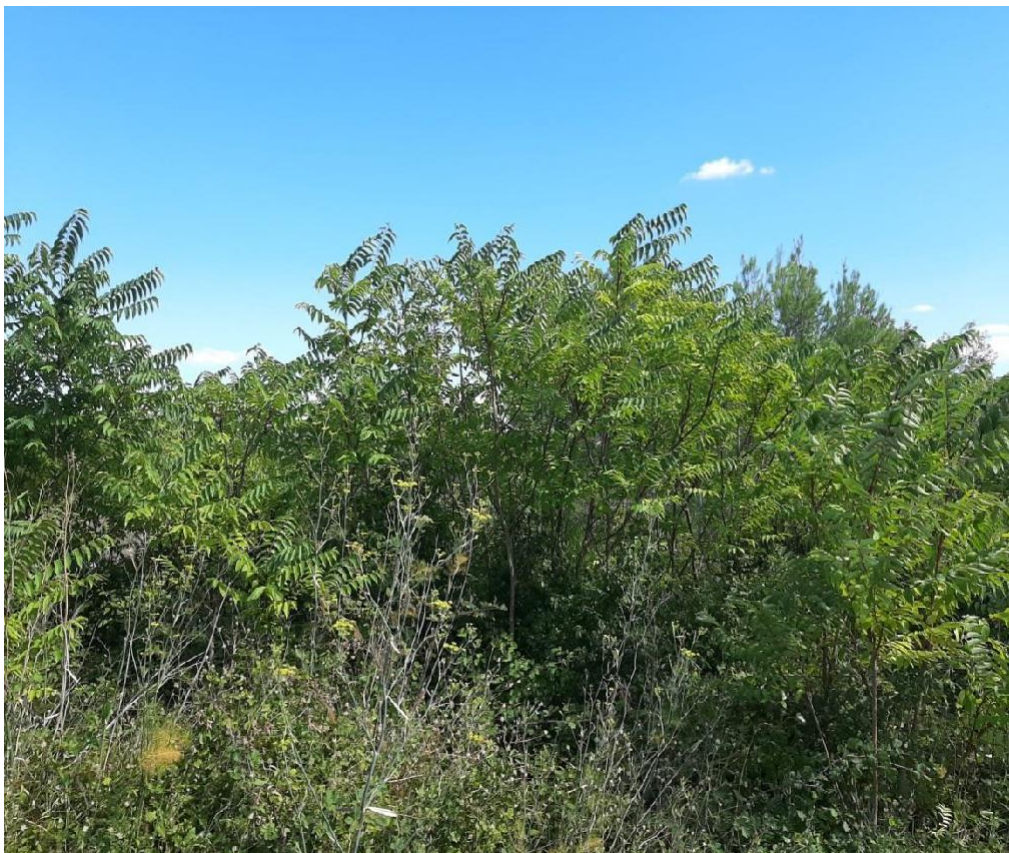
Slika 22 Pajasen ugrožava zajednice(Nađ M.)