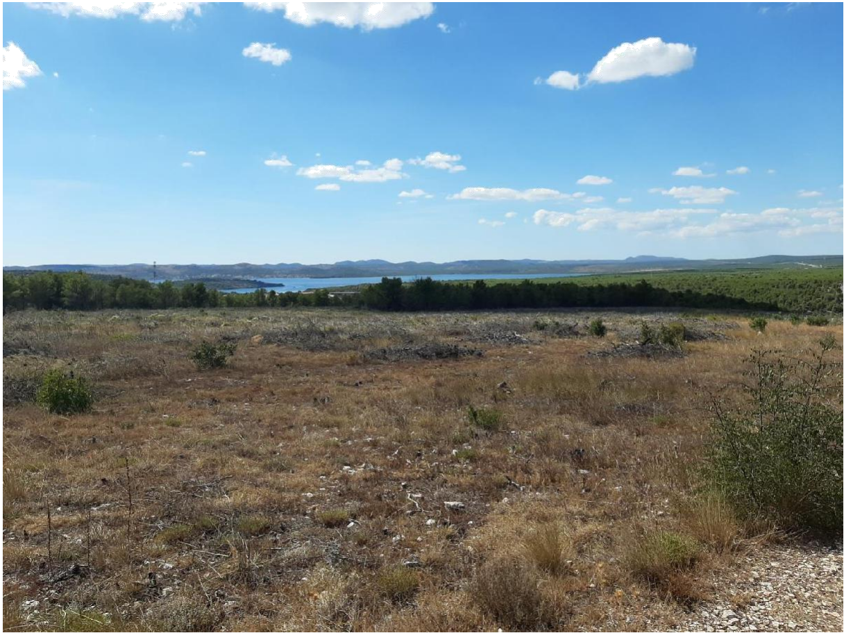
Slika 9 Stanište pogodno za invazivne vrste nakon požara (Nađ M.)