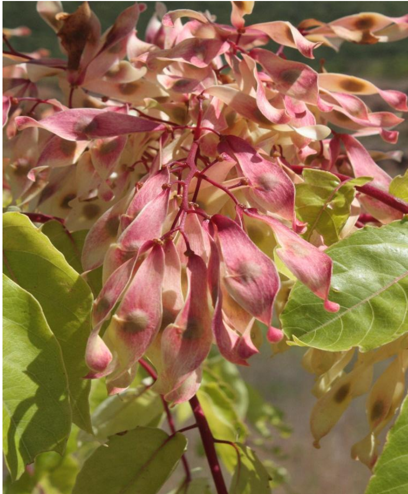
Slika 8 Plod pajasena

Ocvijeće se sastoji od po 5 listova čaške i vjenčića. Cvjeta u srpnju i kolovozu. Oprašuje se kukcima. Plod je perutka, koja se sastoji od okruglaste, spljoštene i na oba kraja okriljene sjemenke. Vrh gornjega krilca je često usukan tako da plodovi pri padanju rotiraju. Plodovi su dugi 3-4 cm, isprva crvenkasti, a kasnije smeđi. Sazrijevaju u rujnu i listopadu, a često se na stablu zadržavaju do idućeg proljeća.