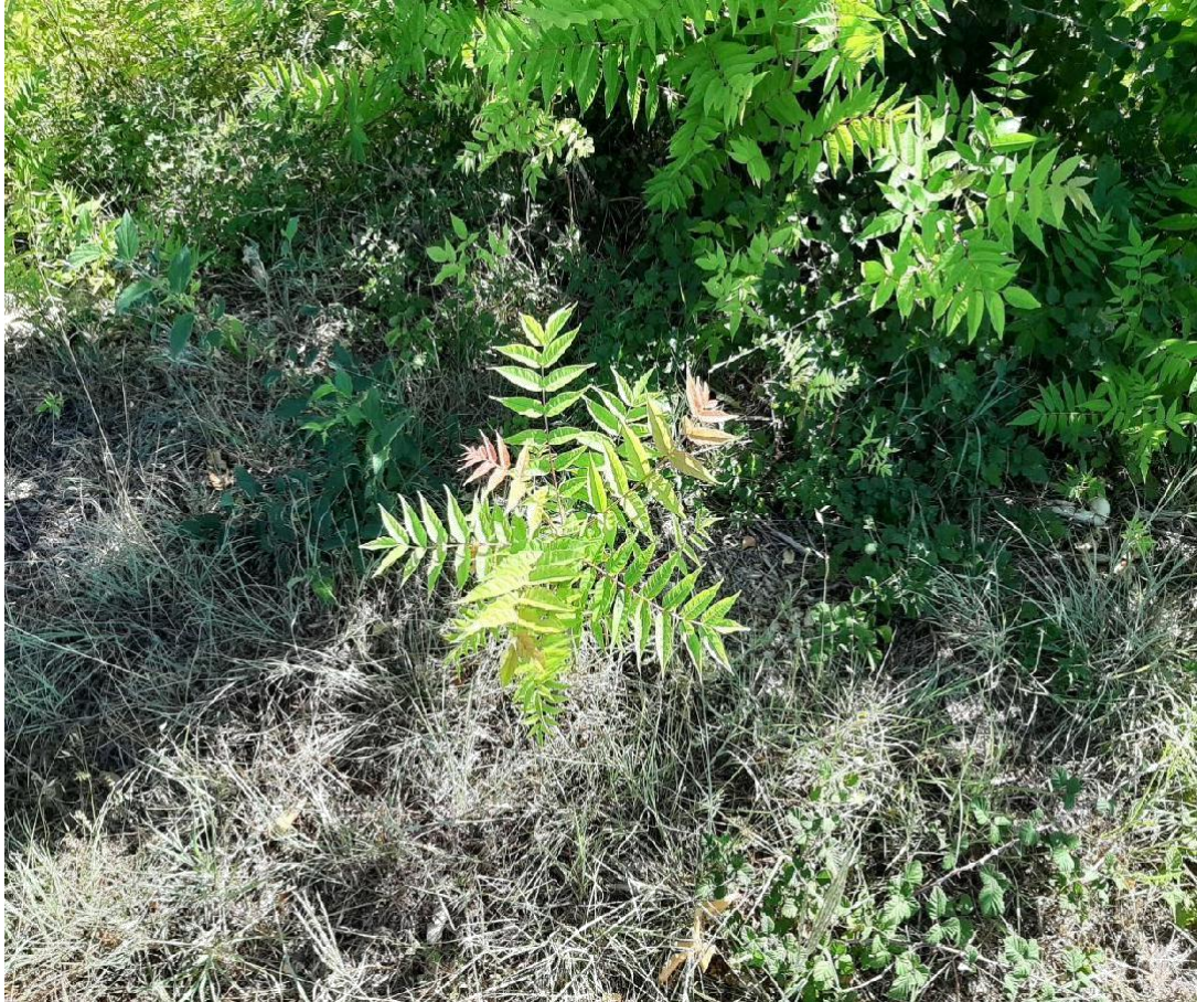
Slika 23 Mlada sadnica pajasena(Nađ M.)