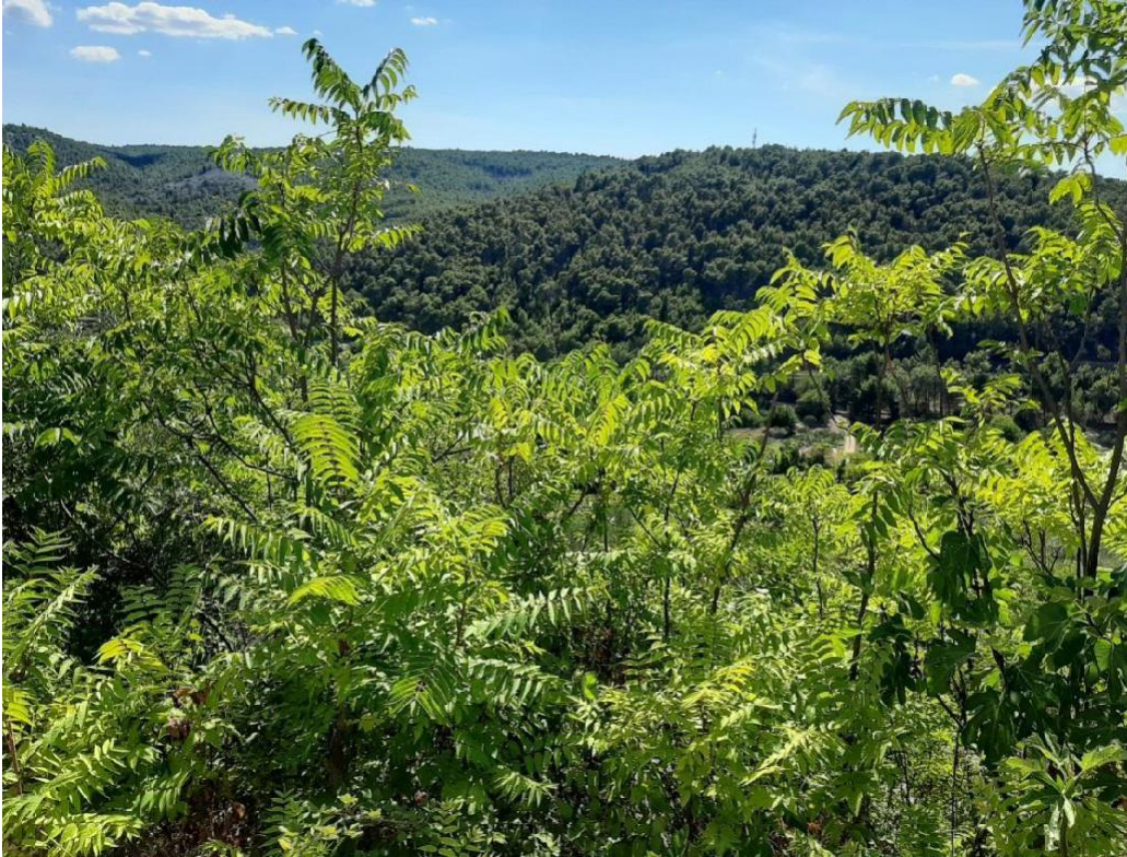
Slika 16 Pajasen na lokaciji Skradinski buk(Nađ M.)