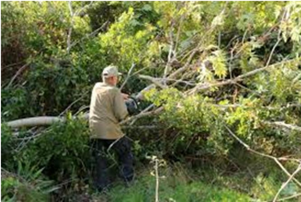
Slika 10 Uklanjanje pajasena motornom pilom