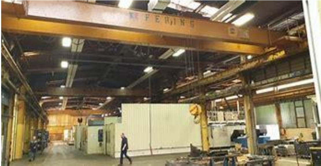
Slika.2. Mosna dizalica

Teoretski dio stručnog osposobljavanja sadrži i mjere zaštite kojih se potrebno pridržavati .