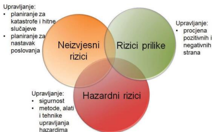
Slika 2. Podjela rizika

Hazardni rizici povezuju se sa rizicima koji imaju negativne rezultate. Neizvjesne rizike ne možemo kontrolirati i utjecati na njih. Rizici prilike još se zovu špekulativni rizici, oni imaju najčešće pozitivne ishode u obliku financija.