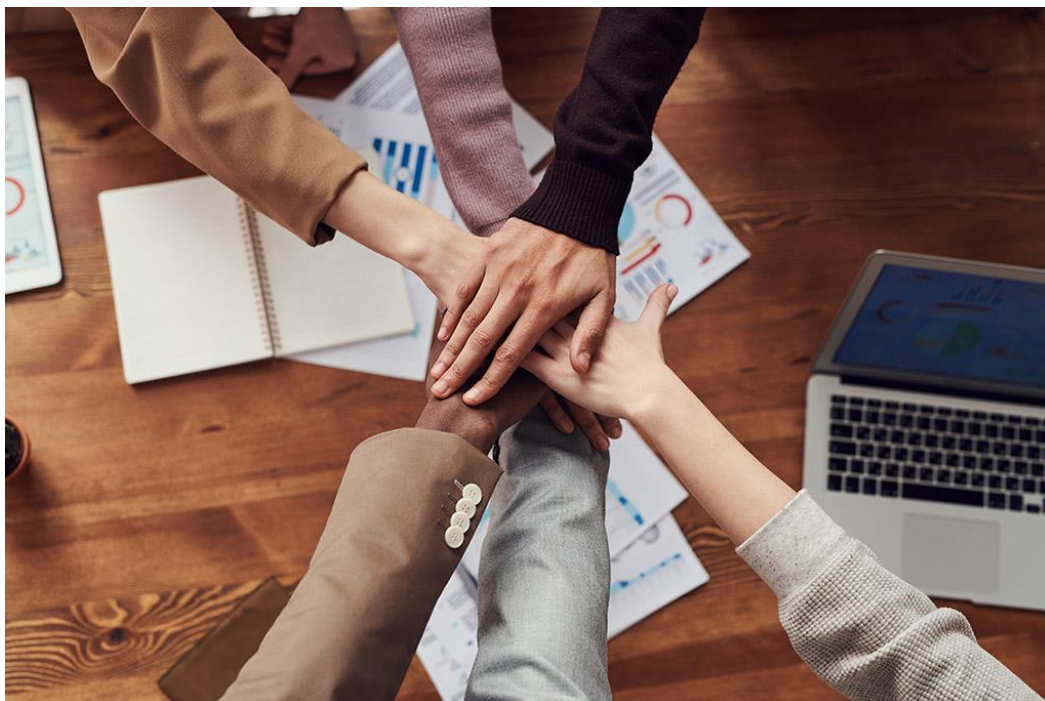
Slika 5. Suradivanje stručnjaka u timskom radu

Kako bi se poboljšao razvoj zaštite na radu potrebno je kontinuirano provoditi programe cjeloživotnog obrazovanja, provoditi edukacije od ranog djetinjstva, poboljšati nastavne programe u srednjim školama i fakultetima, usavršavati stručnjake zaštite i slično.