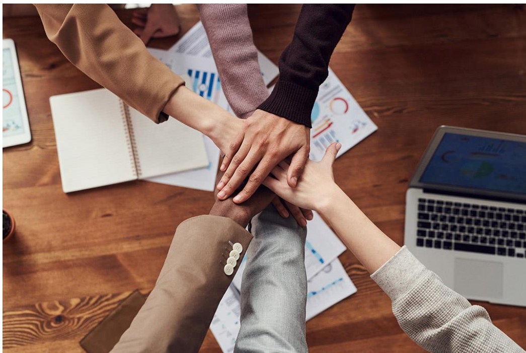
Slika 5. Suradivanje stručnjaka u timskom radu

Kako bi se poboljšao razvoj zaštite na radu potrebno je kontinuirano provoditi programe cjeloživotnog obrazovanja, provoditi edukacije od ranog djetinjstva, poboljšati nastavne programe u srednjim školama i fakultetima, usavršavati stručnjake zaštite i slično.