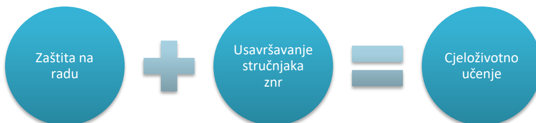
Slika 6. Usavršavanje stručnjaka zaštite na radu

Kako bi se osigurala kvalitetna provedba zaštite na radu potrebno je kontinuirano ulagati u obrazovanje odraslih i stručnjaka zaštite. Zajedničkim djelovanjem poslodavaca, stručnjaka i andragoških djelatnika mogu se ostvariti ciljevi za provedbu cjeloživotnog obrazovanja. Razvojem obrazovne politike poboljšavaju se kompetencije stručnjaka zaštite, kojima se osigurava kvalitetna provedba poslova na siguran način bez ozljeda, nezgoda na radu i profesionalnih bolesti. Pravo svakog čovjeka je pravo na zdravi život, stoga stručnjaci zaštite imaju važnu ulogu u svijetu za osiguranje tog cilja radnicima.