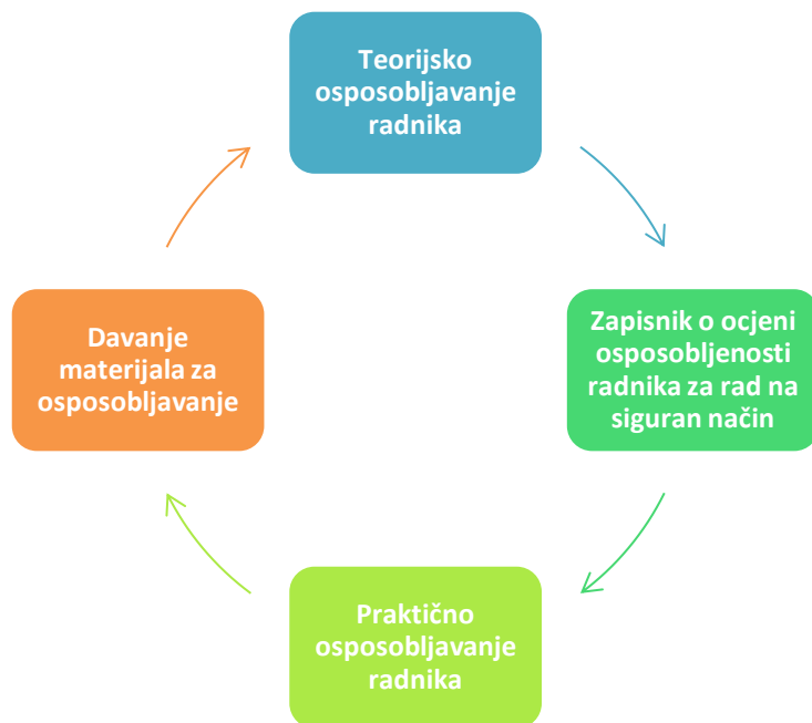
Slika 4. Ciklus provođenja osposobljavanja radnika

Obzirom na važnost sigurnosti radnika u Republici Hrvatskoj uvode se studiji usmjereni na zdravlje i sigurnost radnika. Na taj način odgajaju se generacije studenata koji će završetkom studija steći znanja i vještine potrebne za tržište rada. U prilog tome osnovana su tri studija sigurnosti i zaštite u Republici Hrvatskoj. Kako bi se osiguralo cjeloživotno učenje u području ovih studija uvodi se kolegij Andragogije. Cilj ovoga kolegija jest da stručnjaci zaštite steknu znanja i vještine koje su im potrebne za provođenje osposobljavanja radnika.