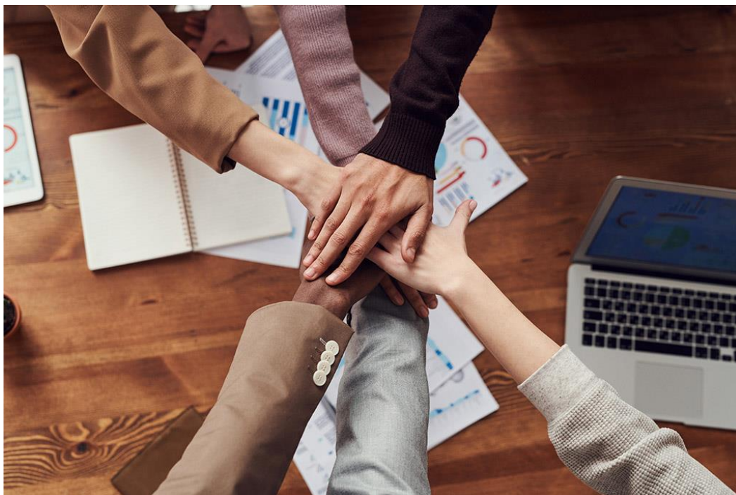
Slika 5. Suradivanje stručnjaka u timskom radu

Kako bi se poboljšao razvoj zaštite na radu potrebno je kontinuirano provoditi programe cjeloživotnog obrazovanja, provoditi edukacije od ranog djetinjstva, poboljšati nastavne programe u srednjim školama i fakultetima, usavršavati stručnjake zaštite i slično.