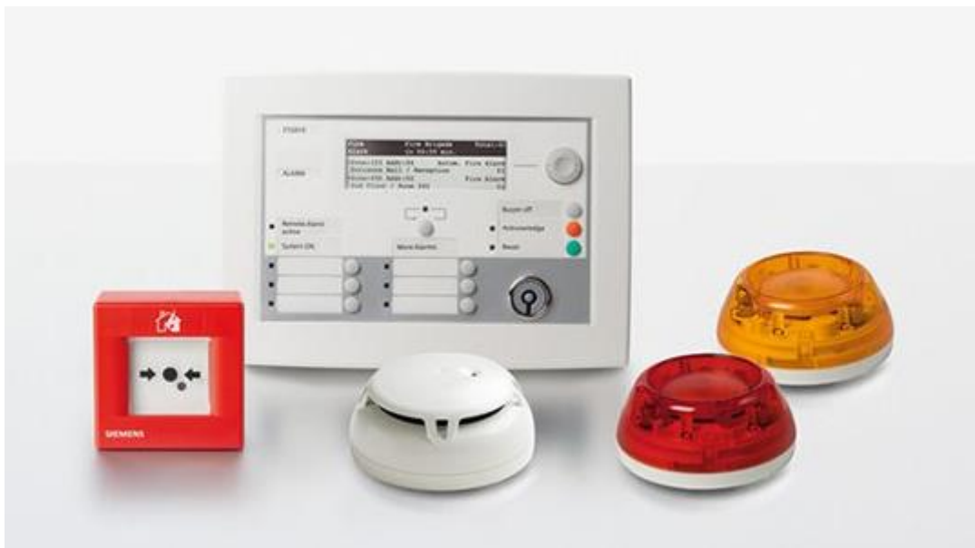
Slika 2. Vatrodojavni sustav

Vatrodojavni sustav je elektronički sustav koji dojavljuje da je u postavljenom objektu došlo do požara. Točnije, on detektira neprirodni porast temperature u objektu i nakon dojave, automatski se poduzimaju određene radnje. Primjer vatrodojavnog sustava prikazan je na slici 2.