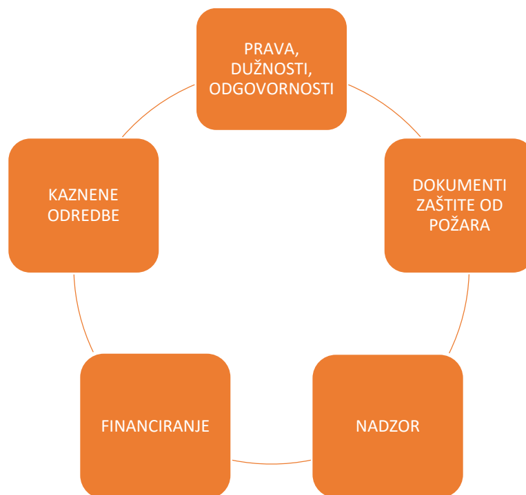
Slika 6. Elementi Zakona o zaštiti od požara

Temelj zakonske regulative u području zaštite od požara te postupaka evakuacije i spašavanja u sportskim dvoranama je Zakon o zaštiti od požara. Osim dijelova koje Zakon obrađuje, a koji su prethodno navedeni, ovdje će biti riječi o odredbama koje su vezane uz prava, dužnosti i odgovornosti, dokumentima zaštite od požara, nadzoru, financiranju te kaznenim odredbama, prikazanima na slici 6.