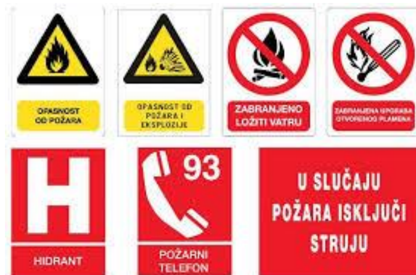
Slika 1. Znakovi upozorenja kao prevencija zaštite od požara

Unutar objekata, a temeljem postavki zaštite na radu, potrebno je unutar naznačiti mogućnost izbijanja požara u određenim uvjetima. Prema tome, stavljaju se određene oznake sa znakovima sigurnosti i upozorenja. Neki od njih prikazani su na slici 1.