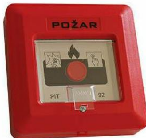
Slika 3. Ručni dojavljivač požara i plamena

Ručni dojavljivači požara uglavnom služe za prijenos informacija o požaru. Aktiviraju se isključivo posredstvom čovjeka. Njihov izgled je standardiziran kako bi se, nakon obuke o načinim postupanja u slučaju požara i uz poštivanje odrednica zaštite na radu, svaka osoba prisutna u sportskom objektu mogla snaći i poslati signal o nastanku požara. U nužnim slučajevima razbija se staklo unutar crvenog kućišta i pritiskom na tipku aktivira se alarm. Slično pritisku na tipku može biti okretanje prekidača i sl. Preporučljivo je i vrlo važno da ručni dojavljivač ne bude jedini u sustavu vatrodjave, već da služi kao nadopuna automatskim dojavljivačima požara.