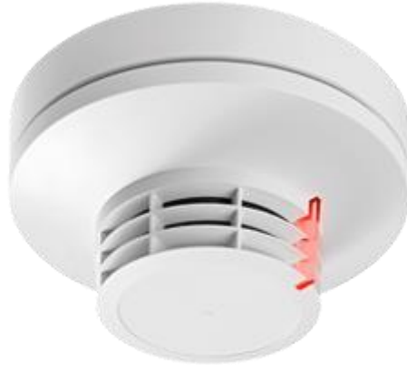
Slika 4. Automatski dojavljivač požara i plamena

Obavezan dio vatrogasnih sustava za dojavu požara su automatski dojavljivači, a u njih se ubrajaju detektori dima, detektori topline, detektori fiksne temperature, detektori brzine porasta temperature te detektori plamena. Na slici 4. prikazan je detektor dima. Automatski dojavljivači bilježe fizikalne promjene u okolišu te iste pretvaraju u električne signale s ciljem aktivacije vatrodojavnog sustava.