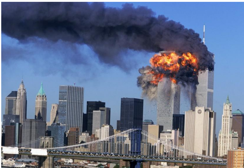
Slika 1 Napad na WTC [32]

11. 9. 2001. godine, 19 pripadnika terorističke organizacije Al-Qaeda otelo je četiri američka putnička zrakoplova i iskoristilo ih kao samoubilačke bombe za udar u ciljeve. Prema službenom izvještaju Povjerenstva 911 (povjerenstvo osnovano 2002. s ciljem analize napada i njegovih posljedica) dva zrakoplova udarila su u Svjetski trgovački centar (WTC) na Manhattanu u New Yorku, ubrzo nakon čega su se oba nebodera srušila. Treći zrakoplov udario je u Pentagon, glavno sjedište Ministarstva obrane SAD-a. Četvrti zrakoplov srušio se u ruralnom dijelu općine Somerset u Pennsylvaniji 130 km istočno od Pittsburga. Pretpostavka je da je četvrti zrakoplov za metu imao Bijelu kuću ili zgradu Kongresa, ali nije uspio u naumu najvjerojatnije zbog otpora posade i putnika [13]. Činjenica da je ovakav napad izvršen na SAD uzdrmla je, ne samo američku, već i svjetsku javnost. Napad je rezultirao smrću 2996 ljudi, ranio preko 6000 ljudi i nanio materijalnu štetu od najmanje 10 milijardi dolara. Izvještaj Povjerenstva 911 pokazao je da su napadači pretvorili otete zrakoplove u najveće samoubilačke bombe u povijesti, te su izvršili najubitačnije napade ikad počinjene protiv Sjedinjenih Američkih Država.