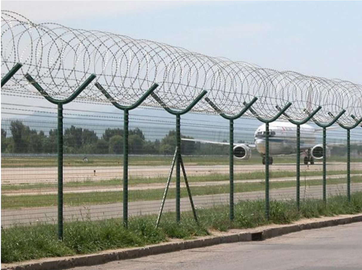
Slika 2 Zaštitna ograda u zračnoj luci [33]