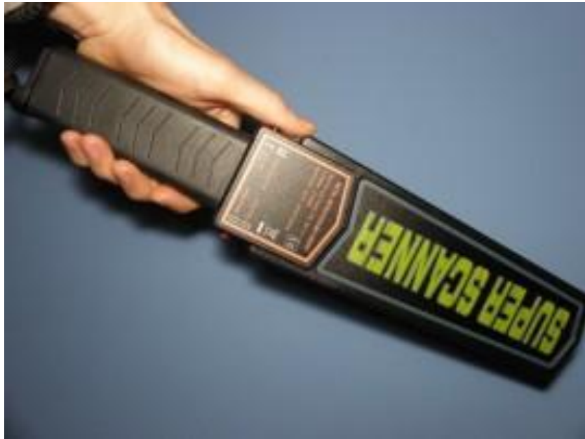
Slika 9 Ručni detektor metala [40]

željezni. Zvučnim i svjetlosnim alarmom se upozorava na otkrivanje metala i utvrđivanje položaja otkrivenog metala. Alarm mora biti čujan na udaljenosti od jednog metra. Nikakvi izvori ometanja ne smiju utjecati na učinkovitost ručnog metal detektora. Samo ovlaštene osobe mogu imati pristup sredstvima za podešavanje postavki osjetljivosti ručnog detektora i sredstva moraju biti zaštićena. Ručni detektor metala mora imati vizualni indikator koji pokazuje da oprema radi [19].