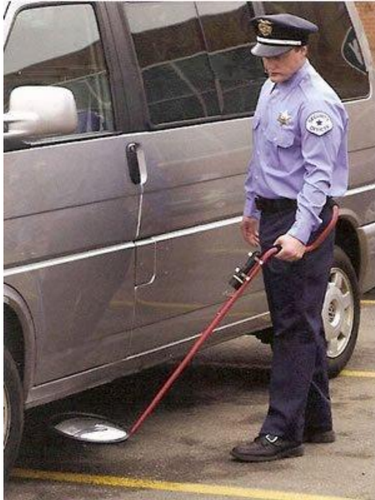
Slika 6 Sigurnosni pregled vozila sa sfernim ogledalom [37]