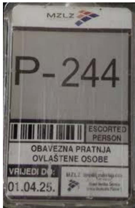
Slika 5 Primjer identifikacijske iskaznice za pristup uz pratnju [36]