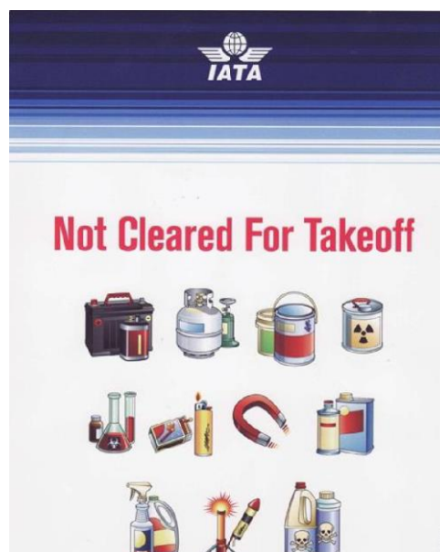
Slika 7 Zabranjeni predmeti za prijevoz [38]

Zabranjeni predmeti u predanoj prtljazi su eksplozivi, zapaljive tvari i naprave kao što su bombe, eksplozivi i streljivo (vidi sliku broj 20).