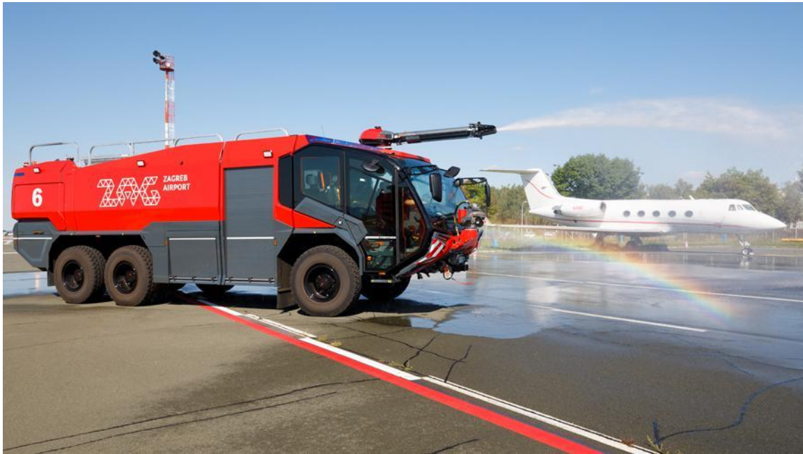
Slika 10 Spasilačko-vatrogasno vozilo [41]