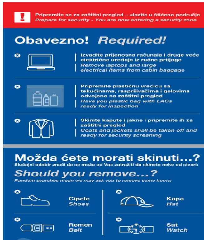
Slika 8 Natpis za zaštitni pregled [39]

Natpis za zaštitni pregled nalazi se na slici 7 koja prikazuje da osobe koje ulaze u štićeno područje prije zaštitnog pregleda moraju izvaditi prijenosna računala i druge veće elektronične uređaje iz ručne prtljage, skinuti kapute i jakne te u slučaju slučajnog odabira maknuti cipele, kapu, sat ili remen. Također, naznačeno je da putnici pripreme plastičnu vrećicu s tekućinama, raspršivačima i gelovima odvojeno na zaštitni pregled [23].