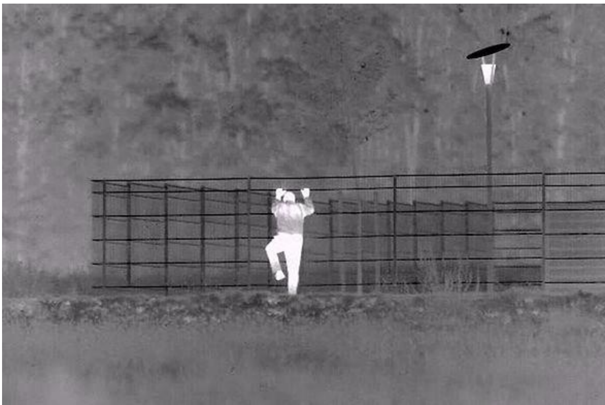
Slika 3 Primjer prikaza termalne video kamere [34]