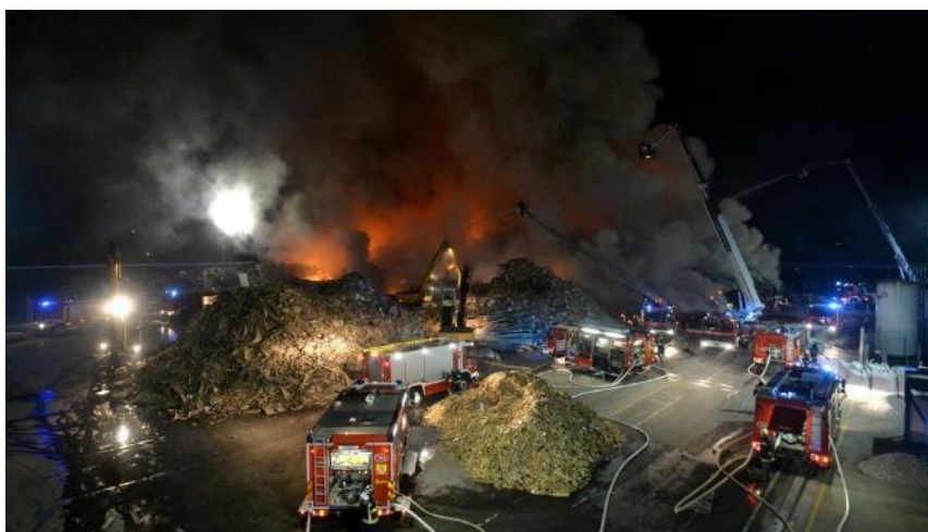
Slika 34. Požar u reciklažnom prostoru tvrtke C.I.O.S.

Vatrogasci su ovaj požar gasili tri dana, uz pomoć mehanizacije vršili su raskapanje i gasili zapaljene hrpe. Sve snage su bile na terenu dok požar nije ugašen, uz zamjenu vatrogasaca iz DVD s područja Grada Zagreba i JVP Grada Zagreba. 16.4.2014 godine nakon što je požar ugašen, jedna je cisterna ostala na lokaciji na dežurstvu.