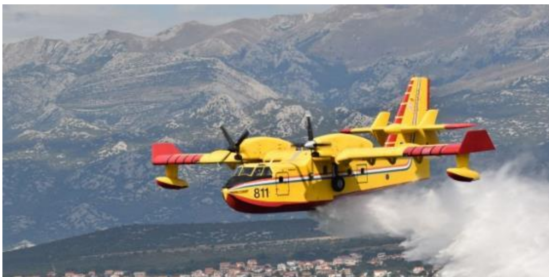
Slika 13. Canadair CL 415

Primjenjuju se na sam požar i namijenjeni su neposrednom gašenju požara. Zadaća im je poboljšavanje gasivih svojstava vode i to tako da joj smanjuju površinsku napetost i povećavaju prodornost u gorivu tvar. Većina supresanata ima i svojstvo pjenjenja pa ih se sagledava kao pjenu za gašenje požara razreda A. osim zemaljskih snaga u gašenju šumskih požara uključuju se i zračne snage. U Republici Hrvatskoj za ovu su namjenu na raspolaganju avioni Canadair CL 415 (slika 13) i Air Tractor te Air Tractor Fire Boss , kao i helikopteri, koji osim za gašenje požara vjedrom, imaju primjenu za transport vatrogasaca i opreme za gašenje. [1,4]