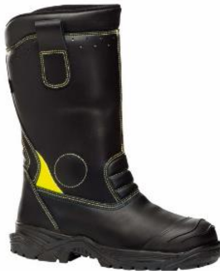
Slika 28. Vatrogasne čizme za požare u zatvorenom prostoru