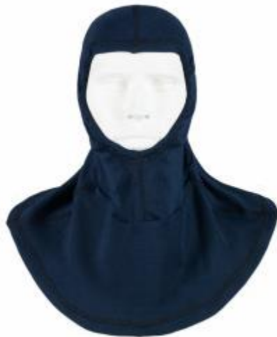
Slika 16. Nomex navlaka za glavu

Vatrogasac ispod zaštitne kacige mora imati Nomex navlaku (potkapa) za zaštitu od hladnoće i toplinskih utjecaja.