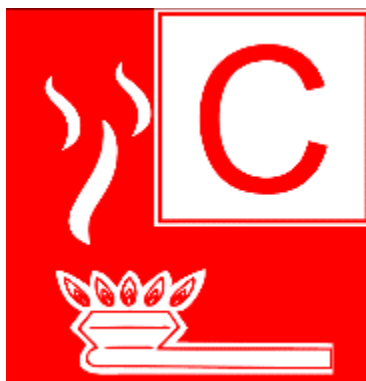
Slika 5. Piktogram požara razreda C

Požari razreda C (slika 5.) odnose se na gorive plinove kao što su metan, etan, propan, butan, vodik, acetilen, ugljikov monoksid. Plinovi gore plamenom, a intenzitet gorenja gotovo odmah po paljenju postiže najveću vrijednost. U zatvorenim prostorima postoji velika opasnost da se kod ispuštanjem plina vrlo brzo u prostoru postigne donja granica eksplozivnosti pa uz prisutnost izvora paljenja može doći do eksplozije. Ako dođe do zapaljenja plina, plamen se ne bi trebao gasiti, nego bi trebalo zatvoriti ventil koji se u većini slučajeva nalazi izvan građevine. Prilikom gašenja plina vatrogasci se štite raspršenim mlazom.