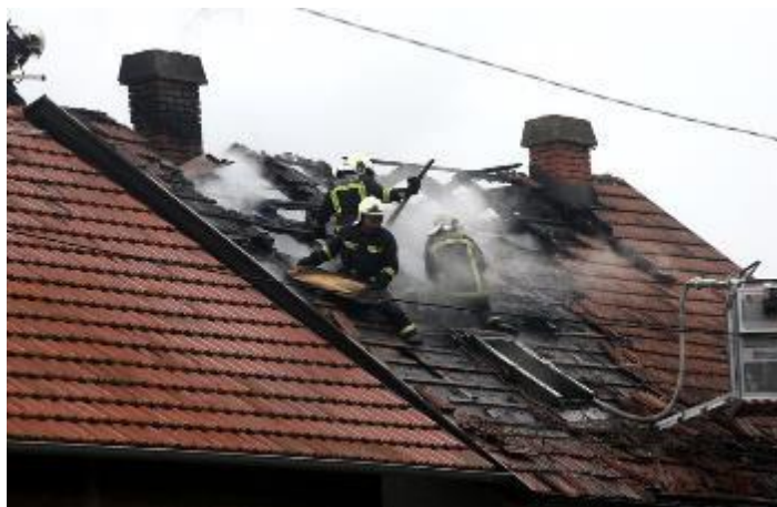
Slika 10. Požar krovišta

Vremenske prilike imaju jako veliki utjecaj na razvoj i širenje požara. Kad se govori o vremenskim prilikama tu spada utjecaj vjetra, snijega, kiše, vlage u zraku, visokih ili niskih temperatura i atmosferskog tlaka. Vremenske prilike imaju neposredan utjecaj na razvoj i širenje požara, ali i na tijek akcije gašenja. Utjecaj vremenskih prilika najviše se osjeti kod požara otvorenog prostora.