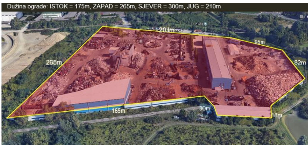
Slika 35. Područje C.I.O.S. - a

Kada dođe do požara, s obzirom da se do područja može doći sa više strana, ovisno u kojem je sektoru požar izbio ulazi se na određene ulaze (tablica 2).