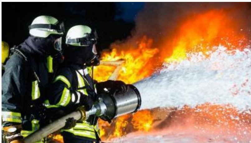
Slika 4. Pjena kao sredstvo za gašenje

Osnovno sredstvo za gašenje ovog razreda požara je pjena (slika 4.). [1,4]