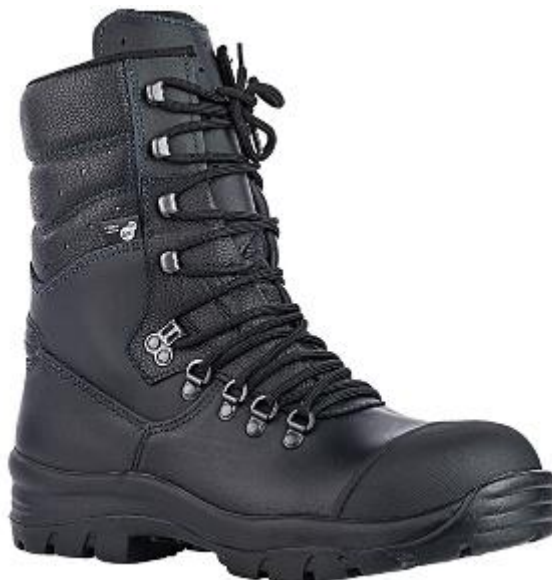
Slika 17. Vatrogasne čizme za požare na otvorenom prostoru

Ove čizme su namijenjene za šumske požare i certificirane su prema normi EN 15090:2012, HI3 CI SRC F2A.