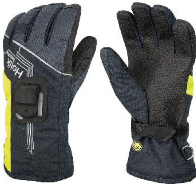
Slika 29. Vatrogasne rukavice