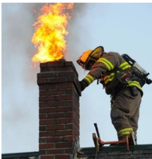
Slika 24. Požar čađe u dimnjaku

Ako je gorenje u dimnjaku znatno, i ako prethodno poduzete mjere ne daju rezultat, pristupa se aktivnom gašenju suhim prahom i to ubacivanjem praha kroz donja vratašca za čišćenje. Požar se ne preporuča gasiti vodom jer zbog nagle promjene temperature može doći do pucanja i urušavanja dimnjaka. U iznimnim slučajevima požar dimnjaka može se gasiti vodom, ali mora biti raspršeni mlaz i veliko iskustvo. [1,4]