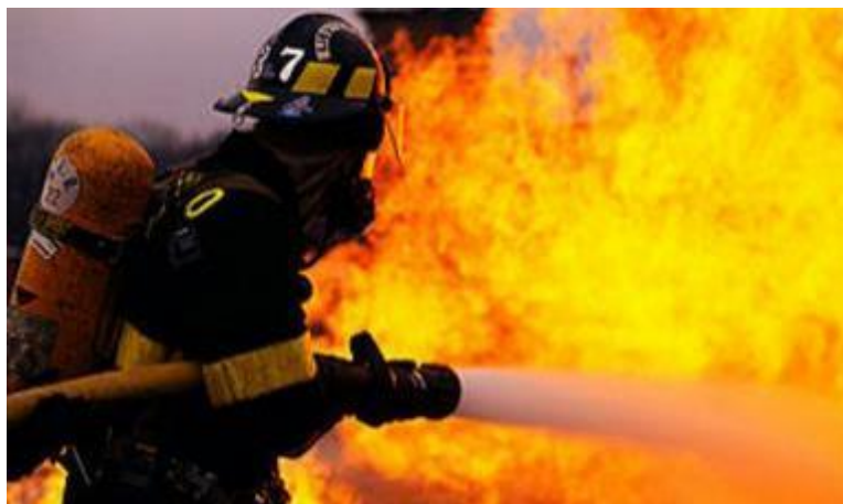
Slika 2. Voda kao sredstvo za gašenje