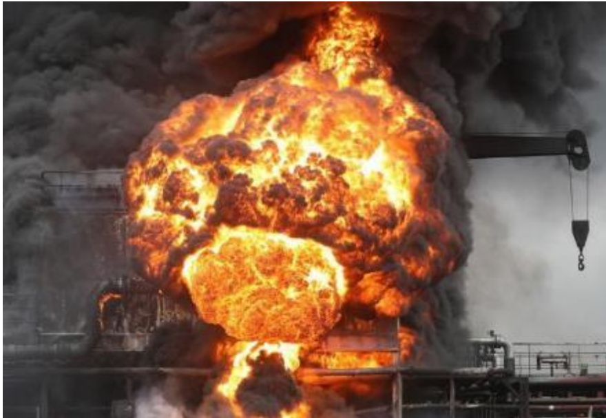
Slika 11. Eksplozija i požar tvornice