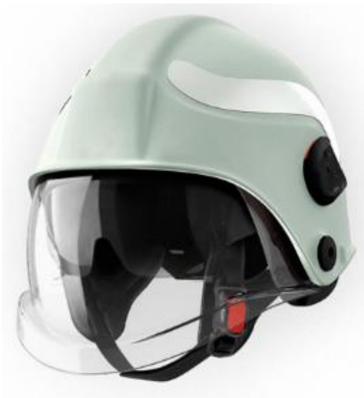
Slika 27. Vatrogasna kaciga za požare u zatvorenom prostoru

Vatrogasna kaciga prema normi HRN EN 433:2008 Kacige za gašenje požara u zgradama i drugim građevinama (slika 27). Opći zahtjevi se odnose na unutrašnjost kacige koja mora biti podesiva, jer se time poboljšava udobnost pri uporabi kao i učinkovitost kacige. Ako je podešavanje moguće na više veličina glave, onda proizvođač mora priložiti odgovarajuće upute za uporabu. Na kacigi ne smije biti oštih rubova, grubih mjesta, niti dijelova koji strše, jer bi mogli ozlijediti korisnika. Na dijelovima koji su u dodiru s kožom ne smiju se upotrebljavati materijali koji nadražuju kožu ili su na neki drugi način štetni za zdravlje. Materijali moraju biti izdržljivi odnosno njihove karakteristike pri starenju ili u uvjetima upotrebe u kojima je kaciga obično izložena (utjecaj sunca, kiše, mraza, znoja itd.) ne smije se osjetno promijeniti. [1, https://vatropromet.hr/ ]