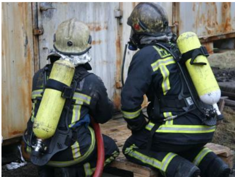
Slika 32. Izolacijski aparat s otvorenim sustavom