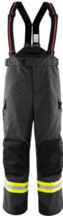
Slika 26. Vatrogasne intervencijske hlače

Interventna zaštitna odjeća (jakna i hlače) za vatrogasce ima više slojeva te svaki sloj je izrađen od drugog materijala, te može imati razne dodatke kao što su patentni zatvarači, vezice, refleksne trake, specijalne oznake itd. To je odjeća koja mora biti vidljiva te je opremljena trakama koje imaju retroreflektivna i fluorescentna svojstva te su pozicionirana na mjestima gdje će biti vidljiva npr. rubovi jakne ili hlača, rubovi rukava. Kao prvi zaštitni sloj često se koristi tkanina koja je po sirovinskom sastavu kombinacija Nomexa i nekog drugog aramidnog vlakna u omjeru 75% prema 25% kod vatrogasne odjeće.