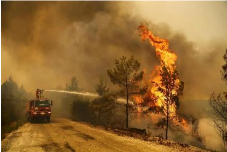
Slika 12. Šumski požar