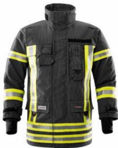
Slika 25. Vatrogasna intervencijska jakna

Za požare u zatvorenom prostoru najčešće se koristi vatrogasno intervencijsko odijelo, koje je sačinjeno od dva dijela. Vatrogasne hlače (slika 23) i vatrogasna jakna (slika 22). Ovo odijelo ima sistem dvostruke membrane. Površinski materijal je IB-TEX®, membrana je GORE® PARALLON® System - Thermal Barrier, a obloga je GORE® PARALLON® System - Moisture Barrier. [ https://vatropromet.hr/ ] Također, vatrogasac tijekom intervencije u zatvorenom prostoru mora imati, vatrogasne rukavice (slika 29), vatrogasne čizme, vatrogasnu kacigu, Nomex navlaku za glavu i izolacijski aparat. Ako je intervencija rad na visini i za sprječavanje pada s visine koristi se vatrogasni penjački pojas. [4]