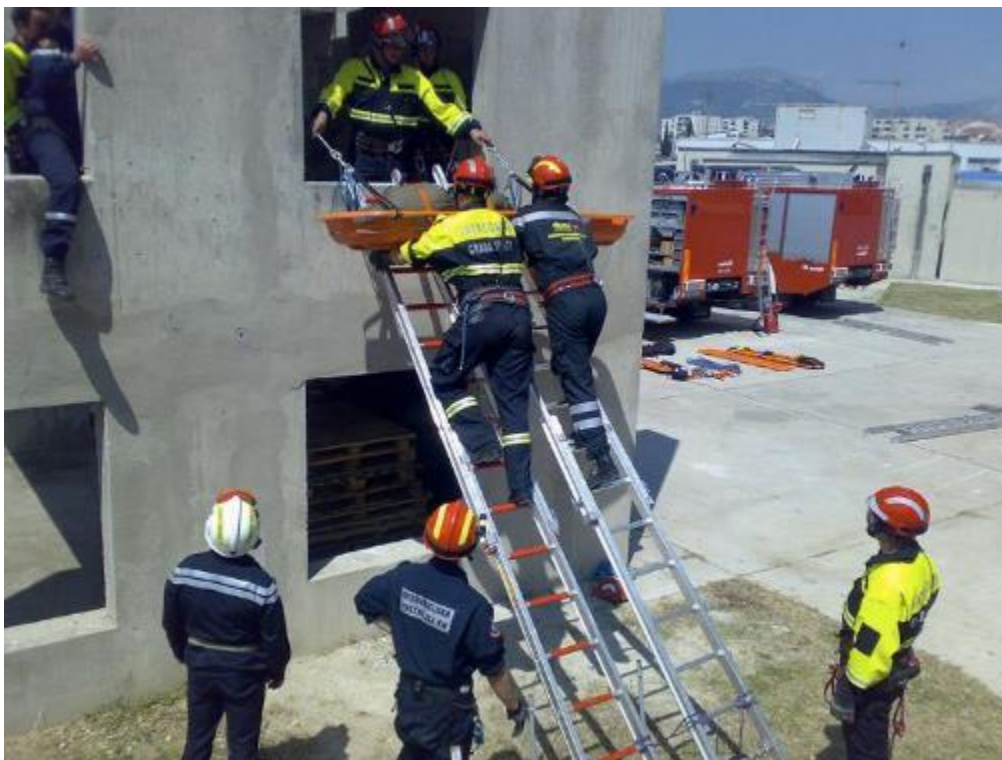
Slika 21. Spašavanje ljudi tijekom požara u zgradi

tavanske prostorije. Vatrogasna grupa koja odimlja mora biti oprezna pri odvođenju dima i topline. [1,4]