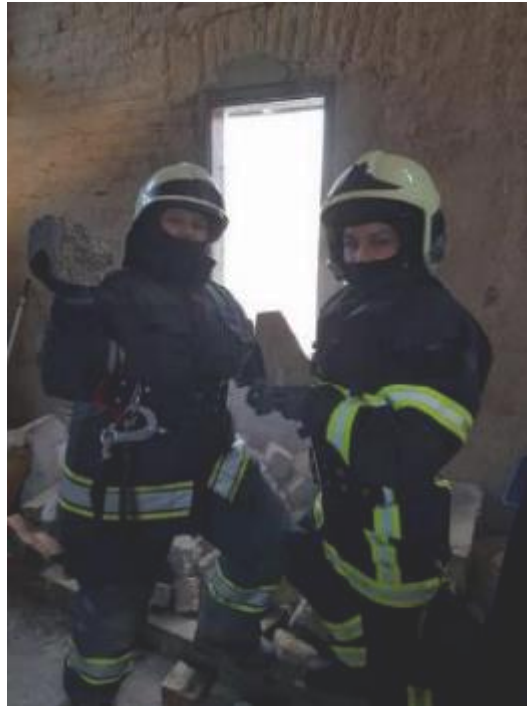
Slika 33. Opasnost od mehaničkih povreda na intervenciji

Vatrogasac mora nositi zaštitnu opremu kako bi se kako bi se zaštitio od opasnosti u operativnom djelovanju. Ta oprema se dijeli na osobnu zaštitnu opremu i drugu osobnu opremu. Osobna zaštitna oprema je oprema koju zadužuje svaki vatrogasac i o njoj brine, a to je: [1]