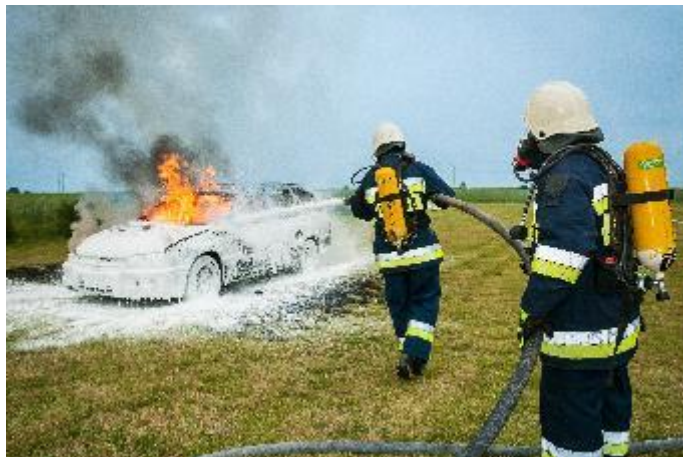
Slika 7. Prah kao sredstvo za gašenja