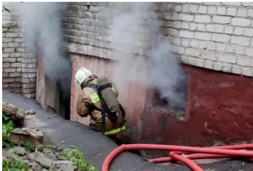
Slika 19. Požar podruma

postoji vanjsko stubište do podruma, vatrogasci će koristiti taj put za unutarnju navalu. Kretanje vatrogasaca do središta požara biti će tako da se kreću pognuto, u poluklečećem položaju, ili s nogom u čučnju koju drže ispred, da bi održali ravnotežu u slučaju da noga koja je u čučnju propadne.