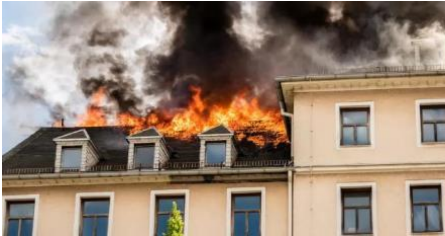
Slika 18. Požar u zgradi