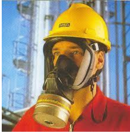
Slika 31. Filtarska naprava

Aparati za disanje su uređaji koji su neovisni o okolnoj atmosferi. Temelje se na izolaciji dišnog sustava onog koji nosi aparat. Aparati za disanje izoliraju korisnika od okolnog zraka i dobavljaju zrak ili plin pogodan za sigurno disanje. Osnovna podjela aparata za disanje: