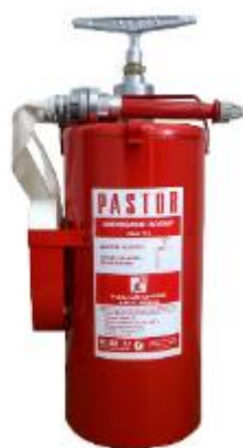
Slika 23. Brentača

mjeri zahvaćeni i konstrukcijski elementi krova. u slučaju da se unutarnjom navalom ne može doći do zone gorenje, krov se kontrolirano otvara 1m 2 neposredno iznad središta požara kako bi se dim i toplina kontrolirano odveli. Pri završetku gašenja požara uvijek je potrebno provjeriti ima li, i u kojoj mjeri, zaostalih žarišta u tavanici ispod krova. Ako postoje, zaostala žarišta gase se brentačom (slika 23). Provjera se provodi otvaranjem konstrukcije i uporabom termovizijske kamere. Nakon provjere poželjno je neko vrijeme dežurati na požarištu i promatrati javlja li se još uvijek sumnjivi dim i isparavanje kako se ne bi pojavili prvi znaci tinjanja, osobito u slučajevima potpomognutim laganim vjetrom.