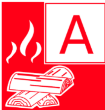
Slika 1. Piktogram požara razreda

Požari razreda A (slika 1.) odnose se na krutine većinom organskog porijekla kao što su drvo, ugljen, papir, pamuk, sijeno, lišće, slama, guma te neke polimerne tvari koje izgaraju žarom. Neke tvari iz ove skupine gore i plamenom i žarom. Plamen nastaje kao posljedica raspadanja tvari iz ove skupine na kruti dio koji gori žarom, i plinoviti dio koji gori plamenom. Raspadanje krutih tvari se odvija pri visokoj temperaturi i u uvjetima u kojima nema dovoljno kisika za gorenje plinova koji nastaju raspadanjem. Do daljnjeg razbuktavanja požara u obliku plamene fronte koja se brzo širi može doći ako dođe do pretjecanja svježeg zraka u smjesu s plinovitim produktima raspadanja, a temperatura smjese je na temperaturi samozapaljenja tog plina. Čest slučaj u praksi je kod naglog otvaranja vrata manjih zatvorenih prostora s visokim požarnim opterećenjem, u kojem gore tvari iz razreda A i gdje temperature mogu biti i preko 400°C. Tvari iz razreda A mogu i eksplodirati, ako je goriva tvar prašina. Čest je slučaj kod eksplozije prašine fine piljevine u mlinovima ili prašina žita u silosima. Eksplozije se tada nižu jedna za drugom.