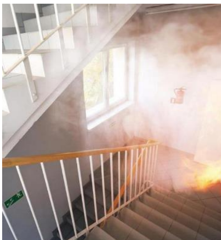
Slika 20. Požar u stubištu

Stubišta po namjeni služe kao komunikacijski putevi u građevini. Stubišta često mogu biti na podestima i okretištima zakrčena raznim gorivim tvarima. Danas se stubišta grade od armiranobetonskih elemenata uz ograničenu upotrebu negorivih materijala kao što su čelik, kaljeno staklo i drugi. Kod stare gradnje stubišta izvedba je bila od drvene građe ili kamena. U slučaju da dođe do požara stubišta (slika 20), prekinut je put za evakuaciju. Velika je opasnost od nastajanja panike i morati će se pristupiti i spašavanju ljudi.