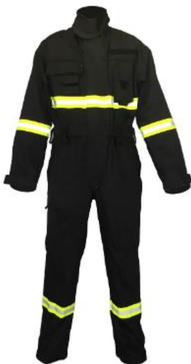
Slika 14. Vatrogasni kombinezon za šumske požare

Za požare na otvorenom prostoru prvenstveno se koristi vatrogasni kombinezon. Vatrogasni kombinezon (slika 14) ima dva osnovna sloja, a to su zaštitni (vanjski) sloj i izolacijski sloj. Vanjski sloj je 50% od materijala Nomex (aramidno vlakno) i 50% od materijala Viskoza (viskozno vlakno).