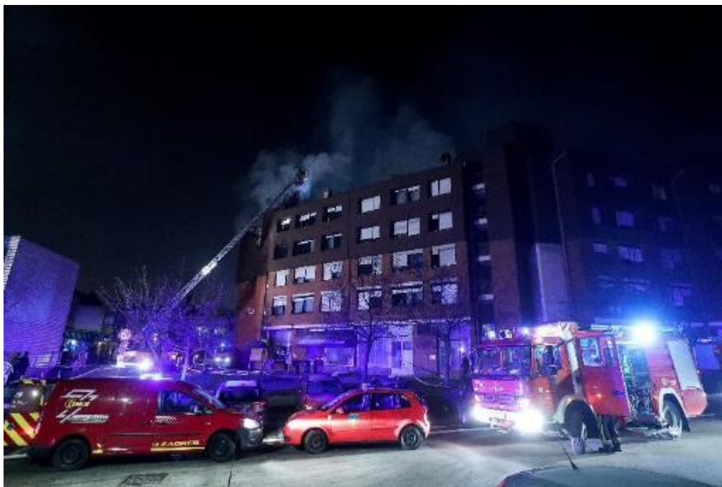
Slika 22. Gašenje požara u stanu

hodnicima ili skućenim prostorima gdje je odvođenje produkata gorenja slabo. Pri ulasku u prostoriju gašenje započinju tako da iznad sebe ispuste nekoliko kratkih impulsa raspršene vode hladeći tako nakupljene vruće plinove. Nakon toga gase i hlade ispod sebe, lijevo i desno. Kod kombinirane navale vatrogasna grupa koja djeluje izvana ne smije zalijevati vodnom unutrašnjost objekta dok druga vatrogasna grupa unutra provodi unutarnju navalu. [1,4]