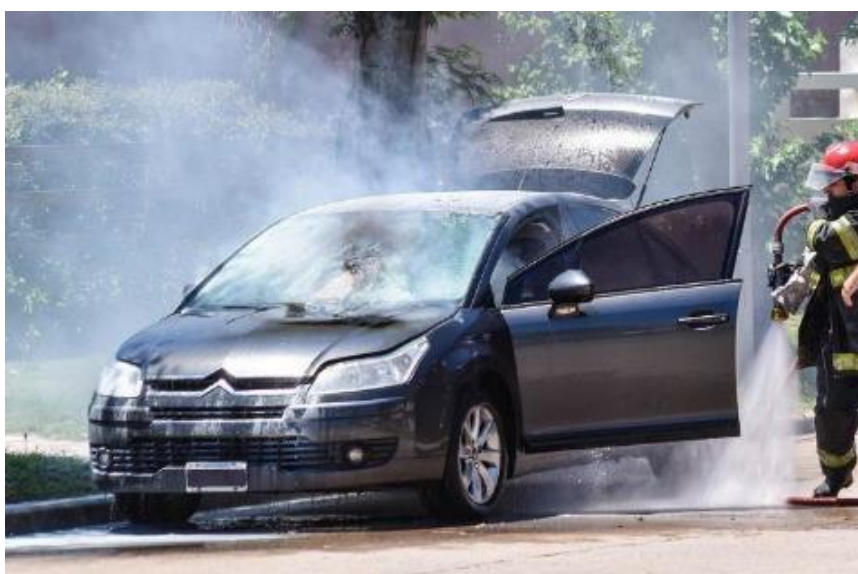
Slika 30. Požar osobnog vozila

Interventno osoblje prvenstveno pažnju usmjeruju na evakuaciju putnika, a paralelno s evakuacijom i gašenje požara. Obavezno treba isključiti motor, zatvoriti dovod goriva, odvojiti i izvaditi akumulator te vozilo osigurati od pomicanja. Ako je došlo do prometne nezgode, morati će se angažirati vatrogasna tehnička služba sa hidrauličnom i drugom opremom za izbavljanje osoba priklještenih u vozilu. Spašavanje priklještene osobe iz gorućeg vozila u prvome će redu ovisiti o brzini dolaska interventne ekipe na mjesto događaja. Požar osobe je vrlo specifičan iz nekoliko razloga, a jedan od važnijih je odabir sredstva za gašenje. Najčešće sredstvo koje se upotrebljava za gašenje požara vozila je voda (slika 30). Ako se u vozilu nalazi osobe, treba voditi računa o vrsti mlaza kojim će se voda ubacivati u vozilo zahvaćeno požarom. Široko raspršeni mlaz ili vodena magla koji djeluju hlađenjem, a dobrim djelom i ugušivanjem. Takav mlaz može oduzeti kisik osobama koje se nalaze unutar vozila. [1,4]