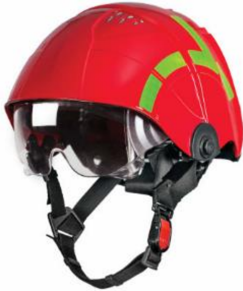
Slika 15. Vatrogasna kaciga za požare na otvorenom prostoru

Vatrogasac ispod zaštitne kacige mora imati Nomex navlaku (potkapa) za zaštitu od hladnoće i toplinskih utjecaja.