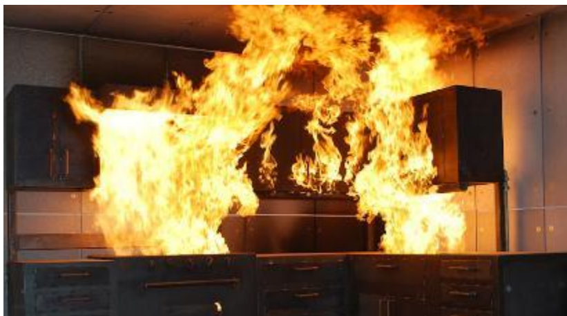
Slika 9. Požar kuhinje