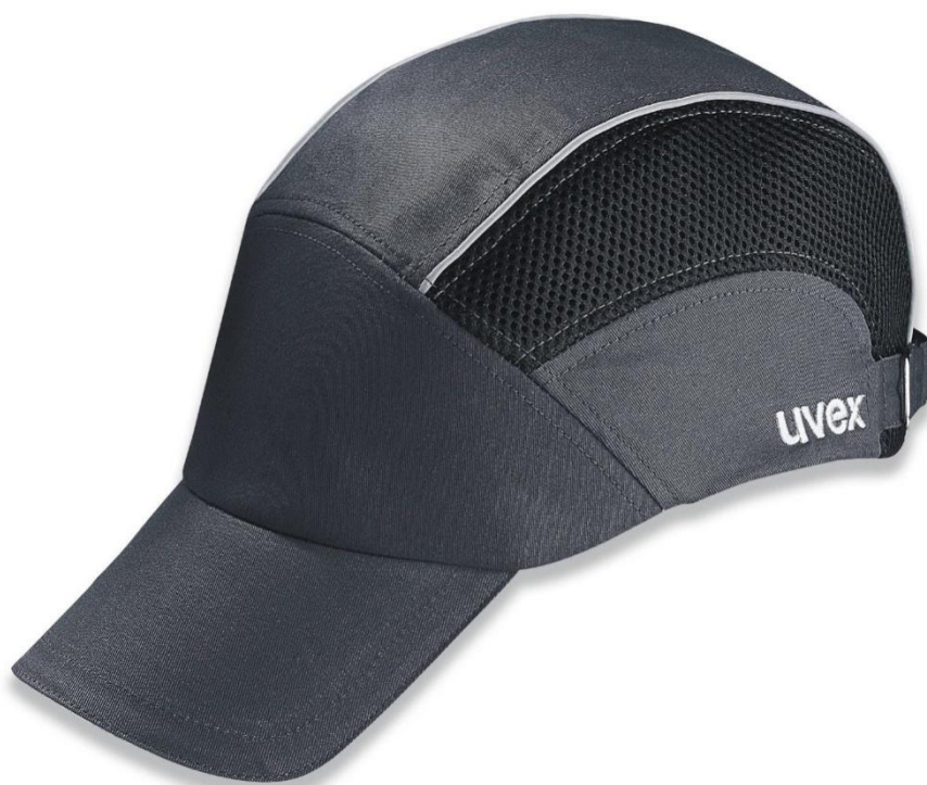
Slika 7. Zaštitna kapa EN 812. (8)

Nikako se ne smije koristiti kao zaštita za pad predmeta sa visine. Zaštitna kapa mora zadovoljavati zahtjeve norme EN 812 Industrijske kape. Moraju biti kompatibilne sa drugim zaštitnim sredstvima za glavu. [8]