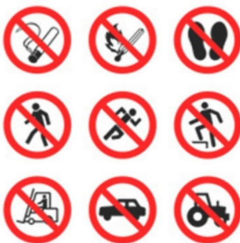
Slika 13. Znakovi zabrane