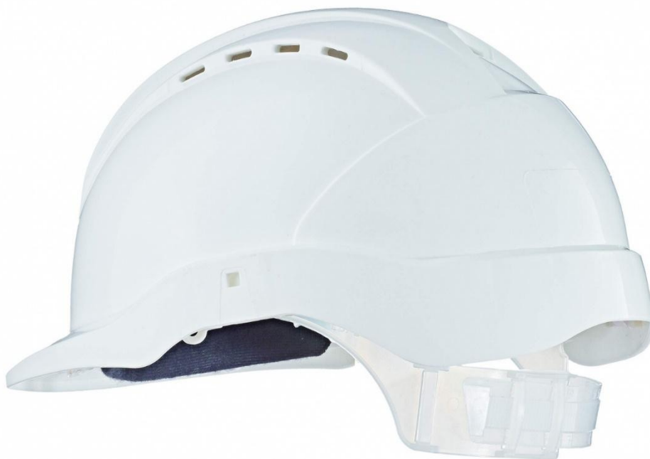
Slika 6. Zaštitna kaciga EN 397. [7]

Kacige moraju biti izbačene iz upotrebe ako je došlo do udarca u istu, ili ako postoje znakovi značajne istrošenosti ili nakon isteka roka trajanja.