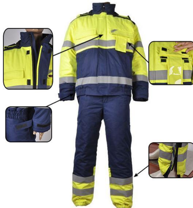
Slika 11. Zaštitno odijelo EN 61482

Električarska zaštitna odjeća uključuje: vatrootporne košulje, hlače, kombinezon, jakne, kapuljače i odijela za zaštitu od kratkog spoja, naočale i zaštita za glavu. Ovakva vrsta zaštitnog odijela se mora nositi kada postoji opasnost od strujnog udara za vrijeme trajanja radnog zadatka. Električarska zaštitna odjeća mora biti minimalno u skladu sa karakteristikama, ispitivanjem i označavanjem EN 61482 normom.