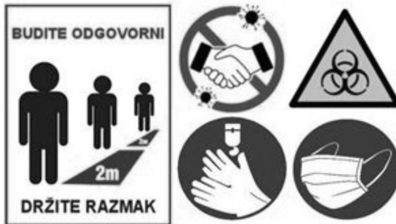
Slika 17. COVID-19 znakovi