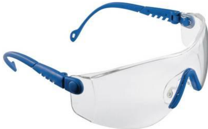
Slika 2. Zaštitne naočale (1),[4]