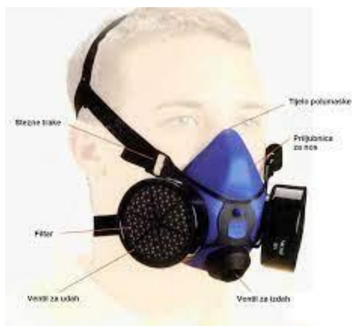
Slika 9. Maska za disanje EN 529 [10]