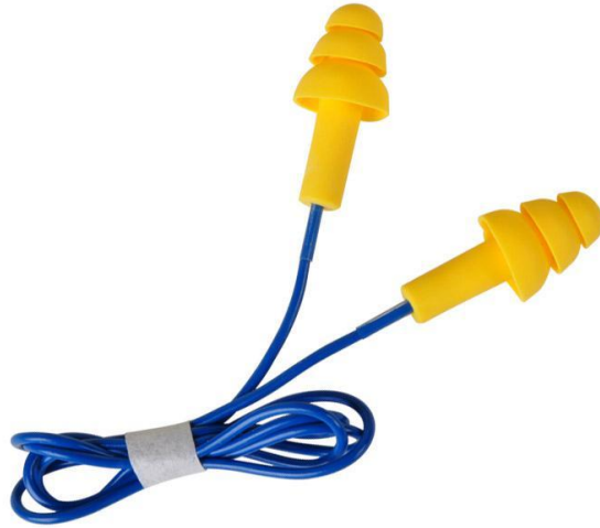
Slika 4. Ušni čepići EN 352-2 (3)

Jednokratni ušni čepići moraju se koristiti isključivo jednokratno. Prvo se moraju oblikovati ili se moraju samooblikovati tako da potpuno ispune ušni kanal kako bi što bolje štitili od buke. Moraju biti ugodni za korištenje i ne smiju uzrokovati bol ili nelagodu prilikom korištenja.