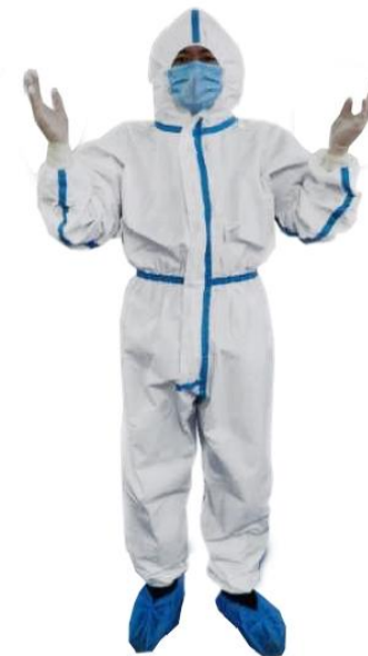
Slika 10. Zaštitno odijelo EN 13688

Temeljna norma koja propisuje standard zaštitnih odijela jest EN 13688.