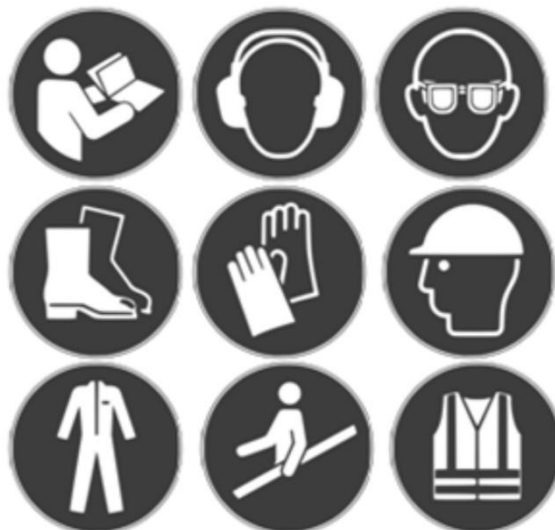
Slika 14. Znakovi obaveze