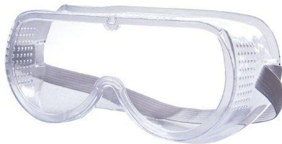
Slika 3. Goggles (2)