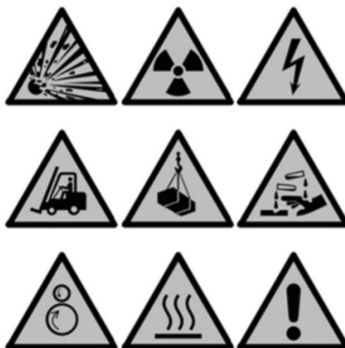
Slika 15. Znakovi opasnosti