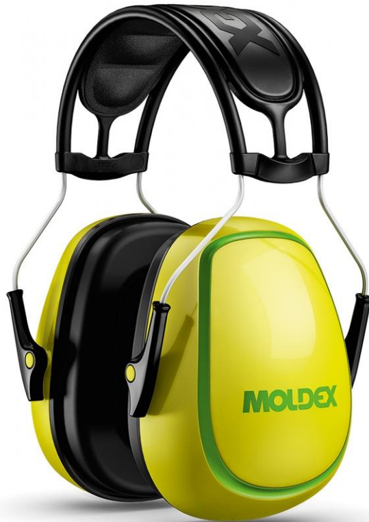
Slika 5. Zaštita sluha EN 352-1 (4)

Vrste zaštite s obzirom na intenzitet buke: