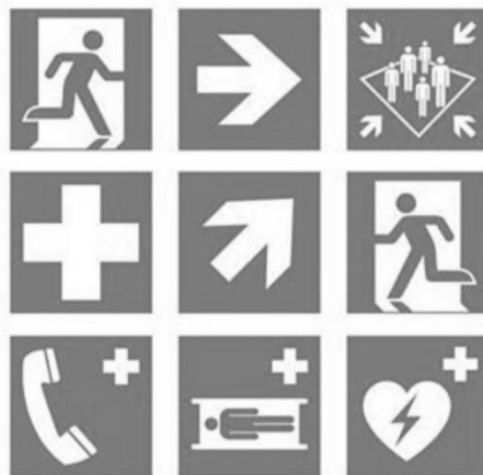
Slika 16. Znakovi Evakuacije i spašavanja