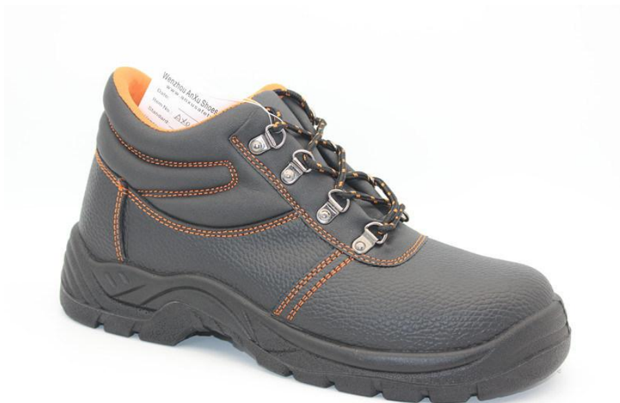
Slika 12. Zaštitne cipele EN 20345 [11]

Zaštitne cipele također moraju imati otpornost na klizanje, antistatičnost, đon otporan na mineralna ulja, otpornost na kemikalije. Također moraju biti otporne na toplinu ukoliko se rad odvija na vrućim površinama te nevodljive za električnu energiju kako ne bi došlo do električnog udara. Ukoliko se radi u laboratoriju, cipele moraju biti zatvorenog tipa, a sandale, klompe i platnene cipele su strogo zabranjene!