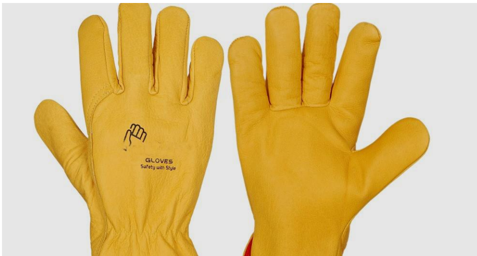
Slika 8. Zaštitne rukavice EN 420. (7)

Moraju biti izrađene od neoprena, nitrila ili tri-polimera te se moraju koristiti u kombinaciji sa kožnim rukavicama da se izbjegnu nehotična mehanička oštećenja. Obavezno se moraju provjeriti prije svakog korištenja ili nakon potencijalnog oštećenja. Također se provjeravaju prije prve uporabe te svakih 6 mjeseci nakon toga ili ako postoji sumnja da im je smanjena izolacijska vrijednost.