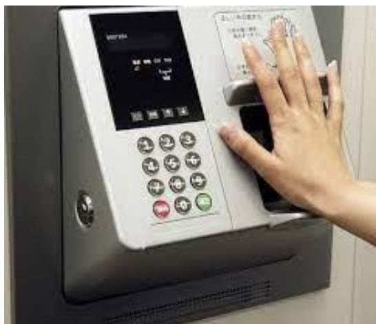
Slika 17: Identifikacija otiska dlana

Izvor: https://encrypted-tbn0.gstatic.com/images?q=tbn:ANd9GcQ-n7SmLbZtDtt3q1UZdjpuFlx9rA-4ao-q5DJ2NrFybeN-fkKECi9tQhC3IN18Z8t3l4&usqp=CAU , pristupila 03.09.2021.