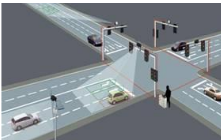
Slika 5: Prikaz detekcije video kamere