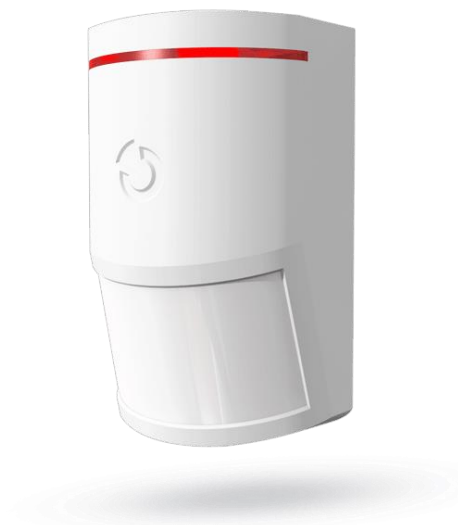
Slika 4: Prikaz pasivnog infracrvenog detektora

zaprimljenog infracrvenog zračenja na jednom od dva dijela koja čine piroelektrični element. Ako jedna od njih dobije više zračenja od druge, senzor će reagirati na tu promjenu. Zbog toga je moguće detektirati samo pokrete živih bića jer ona zrače. Uz piroelektrični element PIR senzor se sastoji i od električnog kruga koji obrađuje podatke i priprema digitalni izlazni signal od ulaznog analognog. Značajni dio korištenog PIR senzora je vrsta leće, odnosno Fresnelova leća 10 koja omogućava raspodjelu vidljivosti na manja područja. [9]