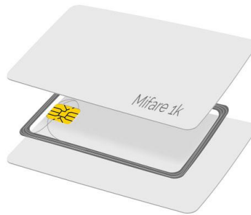
Slika 20: RFID kartica