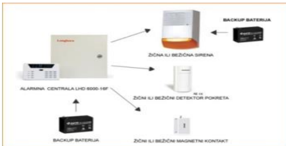
Slika 1: Shema spajanja žične alarmne centrale i elementi žičnog protuprovalnog sustava

unutarnje sirene koje su veličinom manje i manje bučne te vanjske sirene koje imaju vlastito napajanje, a zadatak im je upozoriti okolinu i provalnika da je alarm aktiviran. Sirene mogu biti žičane ili bežične. [5]