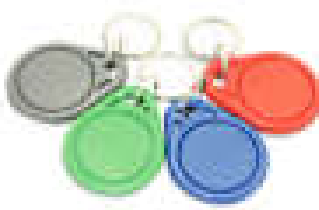
Slika 23: RFID privjesci

RFID privjesci prikladni su za upotrebu na sportskim terenima te u svrhu identifikacije pri ulasku i izlasku iz štićenih objekata. Praktični su jer se mogu koristiti kao privjesak za ključeve te su malih dimenzija i stanu u džep. Mogu biti različitih boja te različitih frekvencijskih izvedbi.[19]