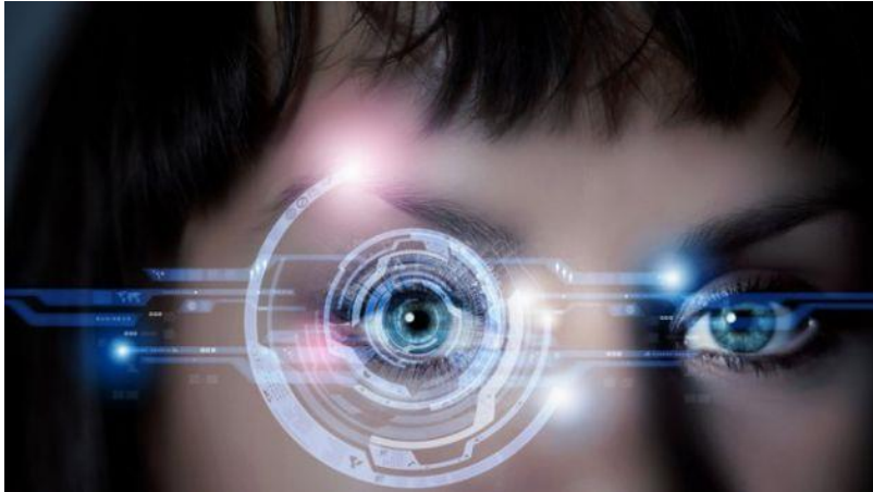
Slika 19: Identifikacija zjenice oka

odstranjenim s mrtvog čovjeka jer odvajanjem od tijela organ gubi svoje karakteristike i ne dolazi do širenja zjenice prilikom obasjavanja oka. Ovakva metoda identifikacije je jednostavna, pouzdana zbog prirodne značajke šarenice i neinvazivna jer ne dolazi do fizičkog kontakta sa skenerom.[16][18]