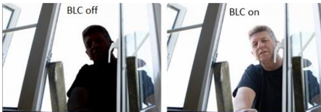
Slika 12: Predodžba slike bez i s BLC-om