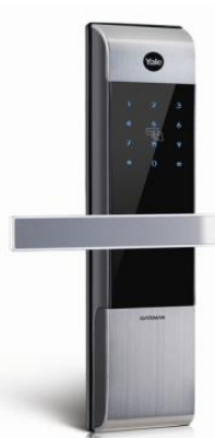
Slika 24: Prikaz digitalne brave Yale GATEMAN YDM 3109