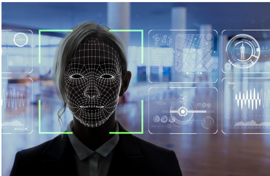
Slika 18: Identifikacija lica

analizira položaj i relativna udaljenost između dijelova korisnikova lica (nosa, usta i oči). Dvodimenzionalni algoritmi se lako mogu zavarati podmetanjem slike legitimnog korisnika. Kut pod kojim je izvršeno snimanje lica i kut upada svjetlosti na lice osobe bitni su kod kvalitete prepoznavanja. Nedostatak kod dvodimenzionalnog algoritma je promjena frizure, promjenjivost lica starenjem, način šminkanja, nošenjem naočala ili brade. Zbog nepouzdanosti i nepreciznosti dvodimenzionalni algoritmi se ne koriste često u identifikaciji.