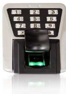
Slika 15: Identifikacija otiska prsta

Metodom analize pojedinosti analiziraju se relativni položaji jedinstvenih karakteristika otiska prsta kao npr.: završeci grebena (predstavlja točku u kojoj se greben naglo završava), bifurkacije (mjesto na kojem se dvije linije spajaju u jednu), uzorak izbočina i udubljenja na površini jagodice prsta. Otisci prstiju su različiti kod svakog čovjeka, čak i kod jednojajčanih blizanaca. Otisak prsta je metoda koja je lako dostupna te se najčešće koristi zbog jednostavnosti. Postoje tri tehnike za skeniranje otisaka prstiju: optički čitač, silicijski čitač i ultrazvučni čitač. Optički čitač je način zapisa podataka gdje se čitanje ili pisanje izvodi korištenjem svjetla i optičkih pojava te ti podatci odlaze na optički disk. Silicijski čitač spada u silicijski sustav koji je pripadao američkoj poluvodičkoj tvrtki koja je imala sjedište u Tustinu u Kaliforniji. [18]