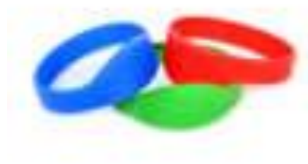
Slika 22: RFID narukvice

jednostavna provjera gostiju i zaposlenika. Narukvice mogu raditi na frekvencijama od 125 kHz i 13,56 MHz, a doseg na kojem prepoznaje broj iz narukvice je između 8 i 10 centimetara udaljenosti od RFID čitača. Narukvice su elastične, vrlo dobro prijanjaju uz ruku osobe koja ju nosi, te su 100% vodootporne. Također, otporne su na vanjske utjecaje i nemaju rubove, kopče i slično.[19]