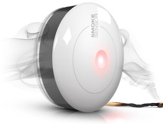
Slika 6: Prikaz detektora dima

Detektori su najbitniji dio sustava za dojavu požara zato što o brzini detekcije ovisi reakcija na pojavu požara, odnosno štete.