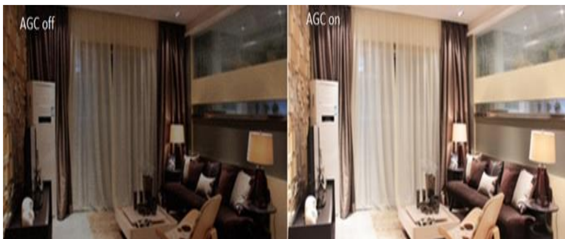
Slika 10: Predodžba slika bez i sa stabilizacijom slike