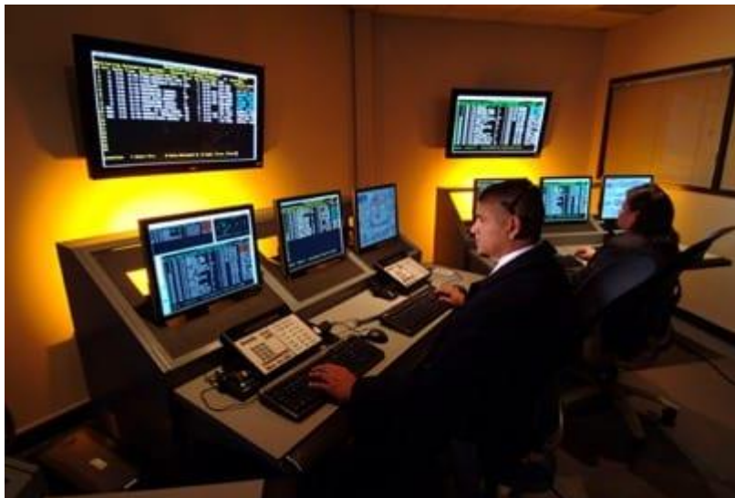
Slika 14: Nadzorna prostorija

operateru koji mora imati vidljivost preko pulta do najudaljenijih monitora. Na pultu mora biti predviđen dovoljno veliki horizontalni prostor za postavljanje knjige evidencije, tipkovnica, telefona, radio stanica i slično, a radna površina mora biti nereflektirajuća. Uređaje i opremu koji se nalaze u centralnoj nadzornoj prostoriji potrebno je periodično testirati i ispitivati njezinu funkcionalnost. Svako izvršeno testiranje mora biti evidentirano zajedno s rezultatima. Pravilno projektiran centralni dojavni sustav mora biti zaštićen protuprovalnim i protuprepadnim sustavima, sustavom kontrole pristupa, video nadzora i odgovarajućim mjerama tjelesne zaštite. Najvažniji faktor i pokazatelj učinkovitosti i kvalitete centralnog dojavnog sustava je školovani operater. O njegovim vještinama, odnosno znanju, uvježbanosti i pravovremenoj reakciji ovisi uspješnost svih ostalih elemenata u propisanim procedurama i reakcijama nakon prijema poruke. [6][15]