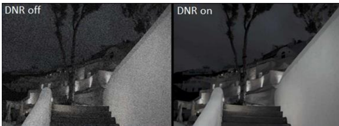
Slika 11: Predodžba slike bez i sa redukcijom šuma