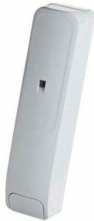
Slika 3: Prikaz detektora vibracije zida

potenciometar za podešavanje osjetljivosti. Detektor vibracija montira se u sredinu okvira ili zida koji se štiti, a raspon otkrivanja je preko 2m. Detektira mehaničke vibracije uzrokovane bušenjem rupa, rezanjem ili bilo kakvom drugom vrstom fizičkog oštećenja. Ugrađeni detektori pretvaraju vibracije u električne veličine pomoću svojih piezoelektričnih 9 ili mehaničkih pretvarača. Signal putuje kroz filter koji određuje poklapa li se spektar detektiranog signala sa spektrom karakterističnim za pokušaj prolaska. Ukoliko dođe do poklapanja alarm će se uključiti.