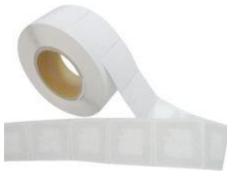
Slika 21: RFID naljepice

RFID naljepnice Confidex UHF naljepnica za prednje staklo automobila posebno je osmišljena za kvalitetnu i brzu identifikaciju vozila. RFID oznaka UHF-a dizajnirana je za vjetrobransko staklo vozila i prikladna je za velik izbor automatskih aplikacija za provjeru vozila, kao što su kontrola pristupa, parkirna dozvola, naplata cestarine ili potvrda o osiguranju. Proizvod se ne može prenositi niti posuđivati jer se ne može eliminirati sa stakla bez uništavanja.[19]