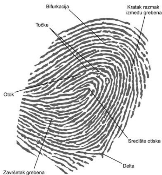
Slika 16: Identifikacija otiska prsta