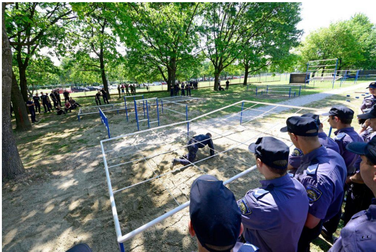
Slika 1.: Test izvršenja policije – poligon