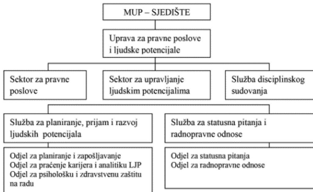
Slika 3.:Organizacijske jedinice sustava upravljanja ljudskim potencijalima u MUP-u